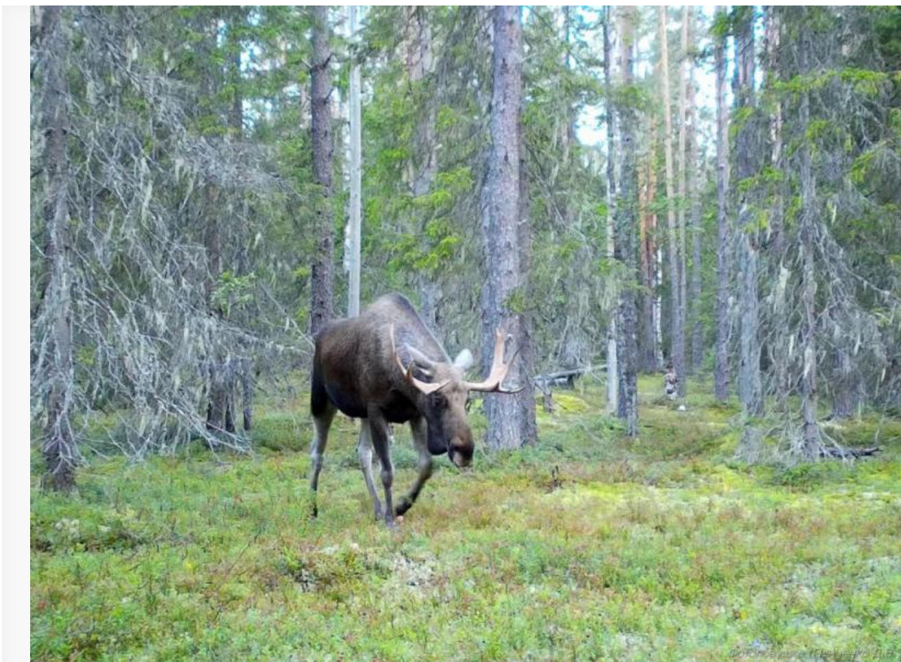
Лесной житель «Максимъярви».

Общая площадь заказника «Максимъярви» составляет порядка 40 тысяч гектаров, из которых 37 тысяч было арендовано сегежскими лесорубами. Экоактивисты потратили немало сил, чтобы запретить компании вырубать уникальные леса. Весной 2023 года от Минприроды Карелии поступила информация, что с комбинатом были достигнуты договоренности об остановке вырубки.