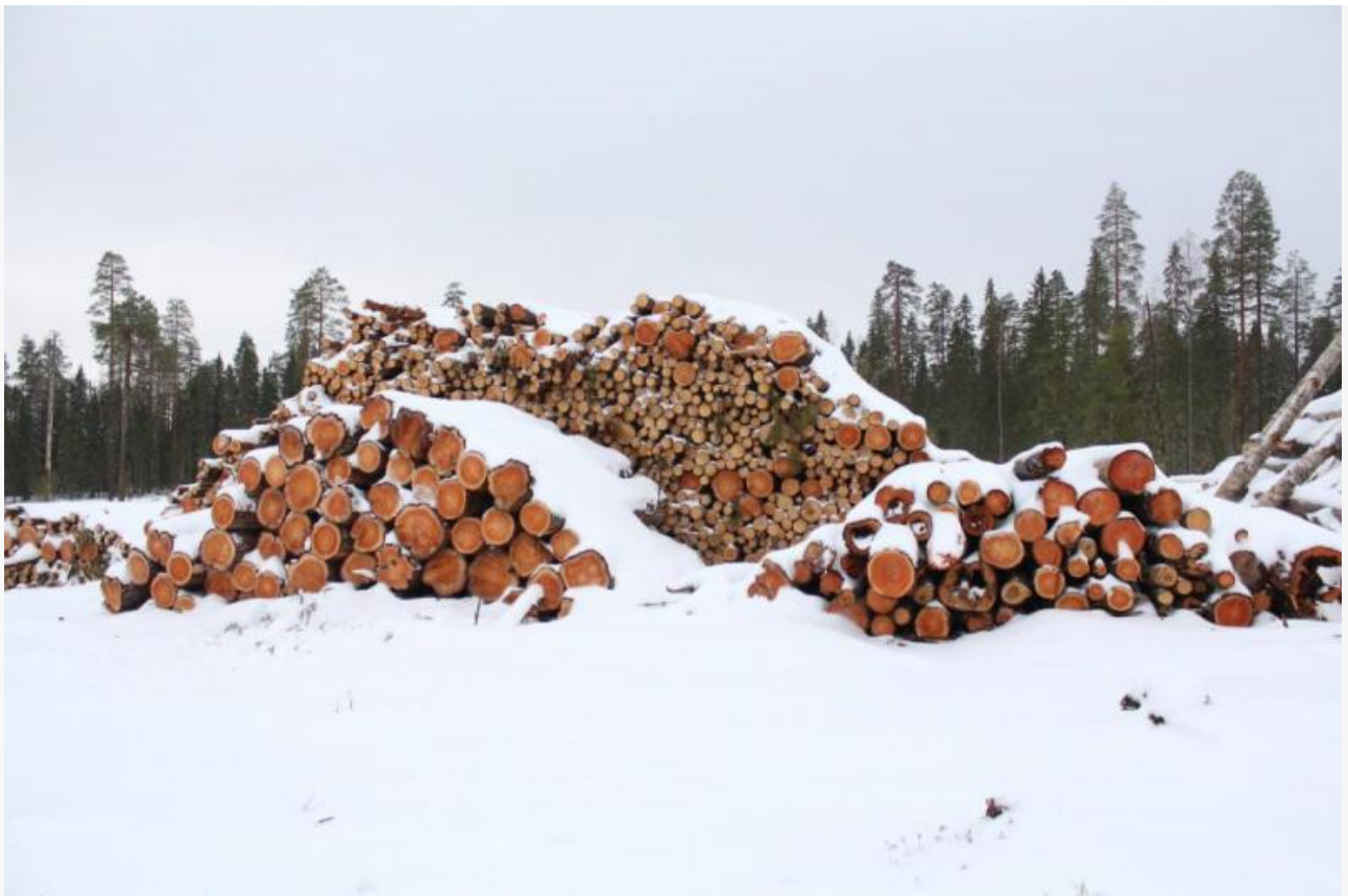
Рубки предприятий Segezha Group на территории планируемого заказника «Максимъярви», ноябрь 2023 года.

Не так давно президент ассоциации Александр Калинин направил вице-премьеру Виктории Абрамченко требования от лесных предпринимателей. Предприниматели буквально намекают на то, чтобы разрушить монополию ФГБУ «Рослесинфорг» и предлагают России выйти из СИТЕС, так как сертификаты этой конвенции мешают вырубке некоторых пород деревьев для поставок в Китай.