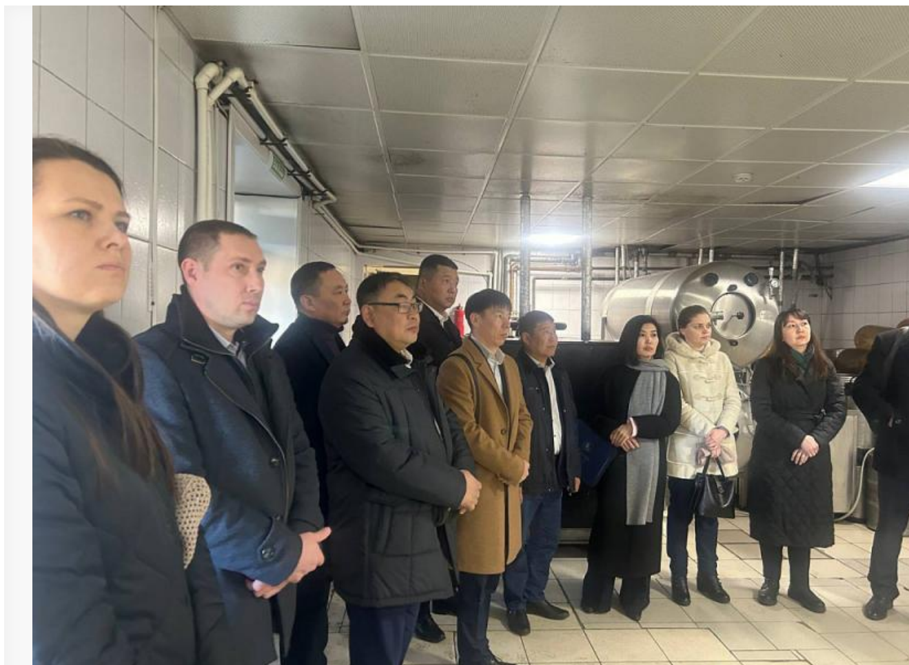
Депутаты Народного Хурала на пивоваренном заводе