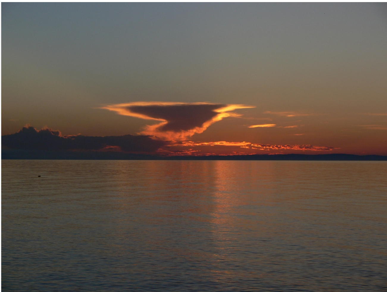
Автор: Даниил Тетерин Фото из альбома "Байкал. Виды - лето" © Фотобанк "RuBabr"

Начались проверки всех вовлеченных отраслей: выделение земельных участков, строительство турбаз, предприятий, функционирование транспорта. Особое внимание рубкам и стройкам. Появились громкие результаты (вспомните Туколонь и арест министра лесного комплекса). А вот в стройках не все так однозначно. Поначалу все хорошо - снос китайского завода, огромное количество исков о сносе самовольных и не только построек. Но решения судов нужно еще и исполнять.