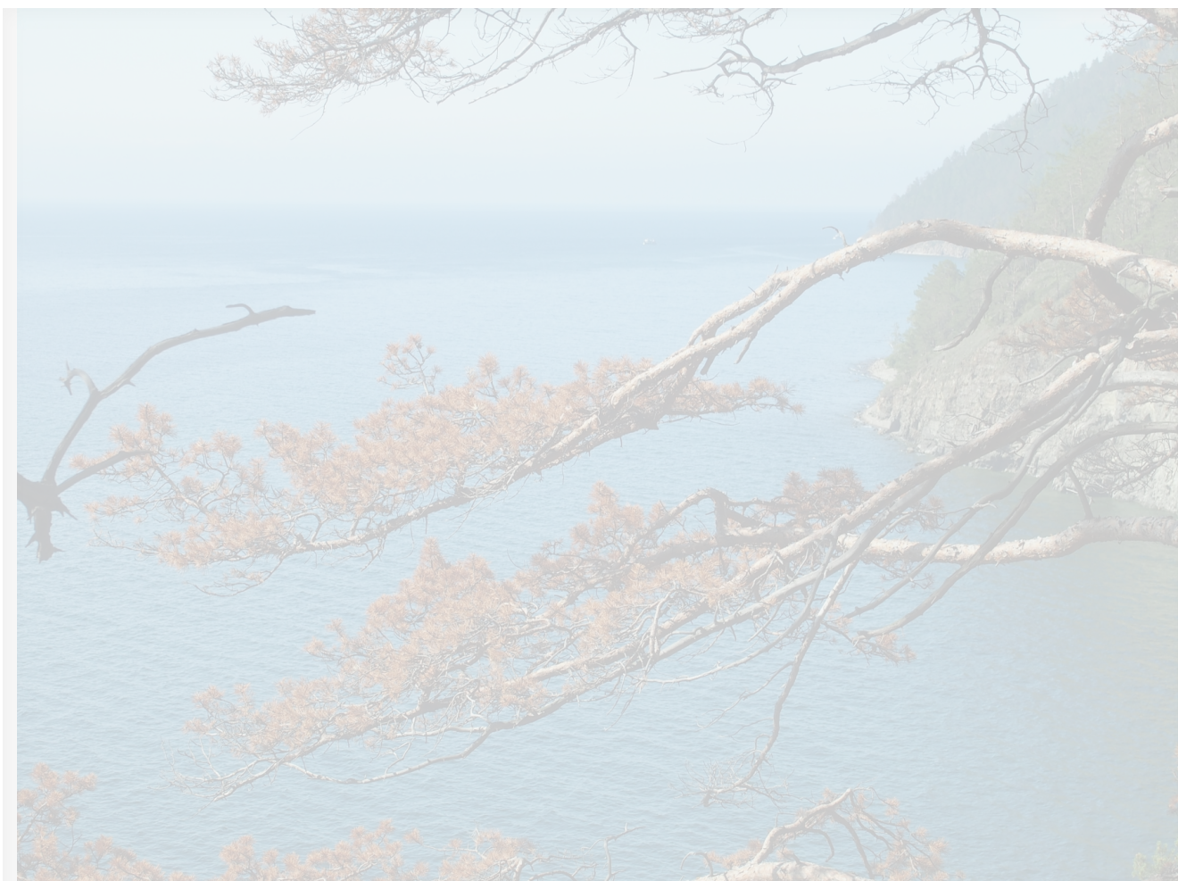
Автор: Екатерина Долинская Фото из альбома "Байкал. Виды - лето" © Фотобанк "RuBabr"

Так что давайте попробуем взглянуть на вопрос без эмоций и не получивших официальное подтверждение версий.