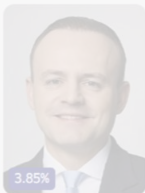
Владислав Даванков Партия «НОВЫЕ ЛЮДИ»