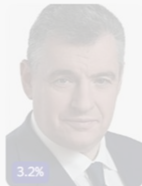
Леонид Слуцкий ЛДПР

Результаты голосования по выборам президента Российской Федерации 2024 года