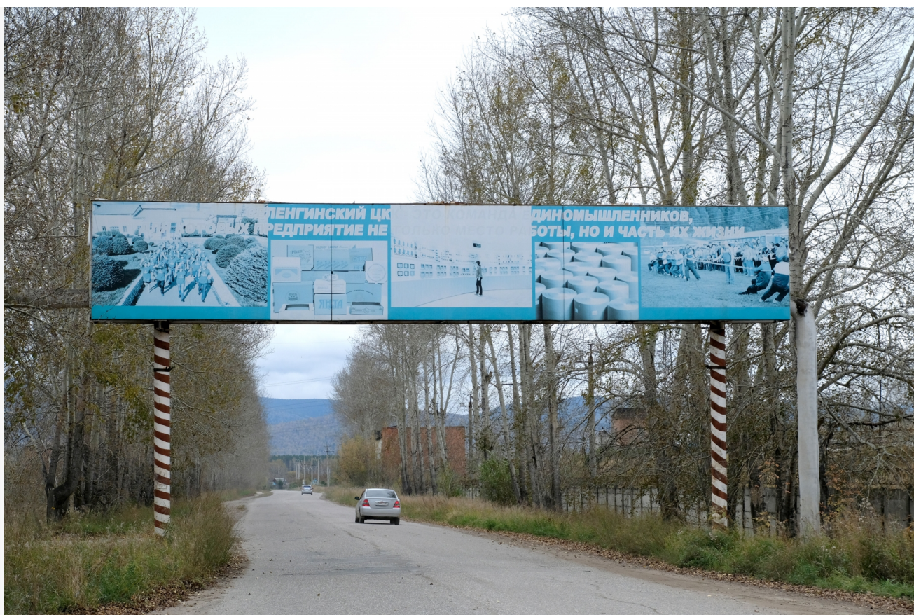
Автор: Алёна Штерн Фото из альбома "Бурятия. Селенгинский ЦКК" © Фотобанк "RuBabr"

В Бурятии продолжают разбирательства в связи с массовой гибелью сотрудников Селенгинского ЦКК. Родственники погибших пытаются добиться компенсации морального ущерба с осужденных и комбината, но мешают им уже заключенные ранее договоренности с предприятием.