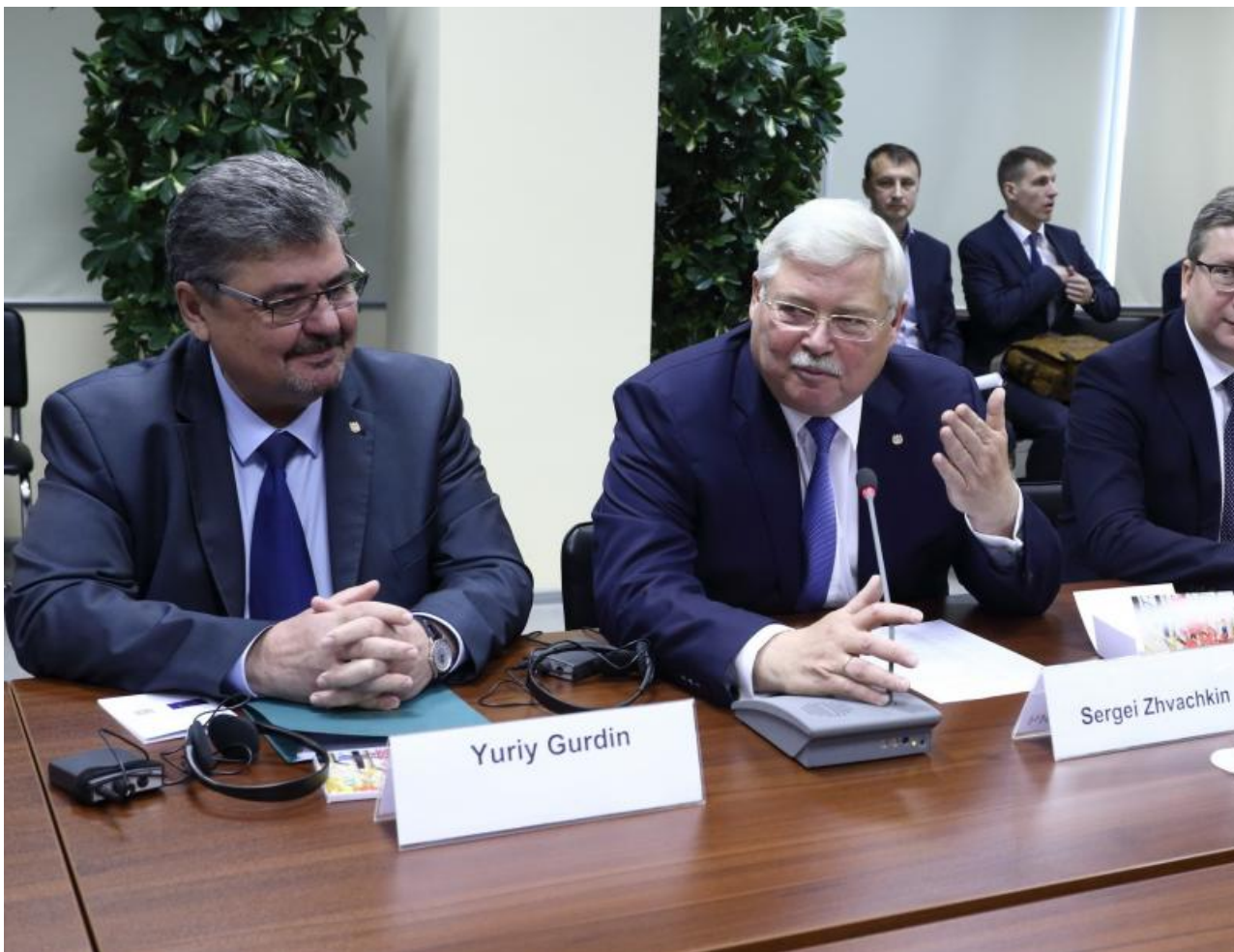
Фото: vtomske.ru, администрация Томской области

Автор: Андрей Игнатьев © Babr24.com КРИМИНАЛ, РАССЛЕДОВАНИЯ, ПОЛИТИКА, ТОМСК 25074 14.03.2024, 11:24 304