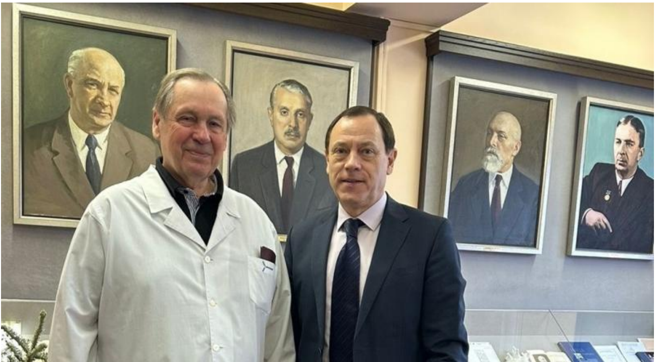
Только за последний месяц трижды со знанием дела рассказал о своих походах в театры. В столичные.