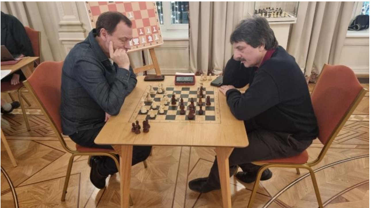
Много ездит по стране в своей должности. Ведет активную жизнь профессионала и руководителя.