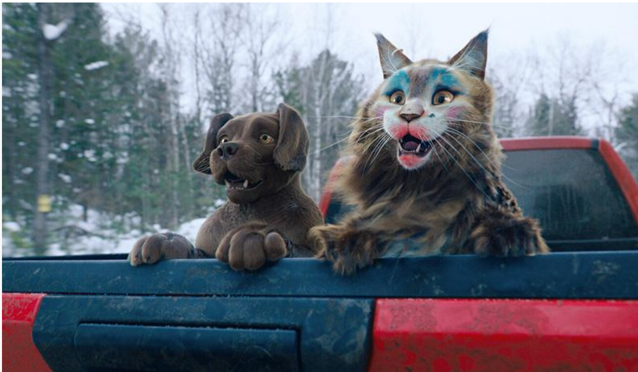
Кадр из фильма «Кот и пёс»

А вот другая премьера из семейного сегмента – южнокорейский мультфильм Ом Ён-щика « Лонки – великий обманщик » – привлекла в среднем 19,9 зрителя за сеанс, собрав на 988 экранах всего 5,3 миллиона и завершив стартовый уикенд на 18 месте.