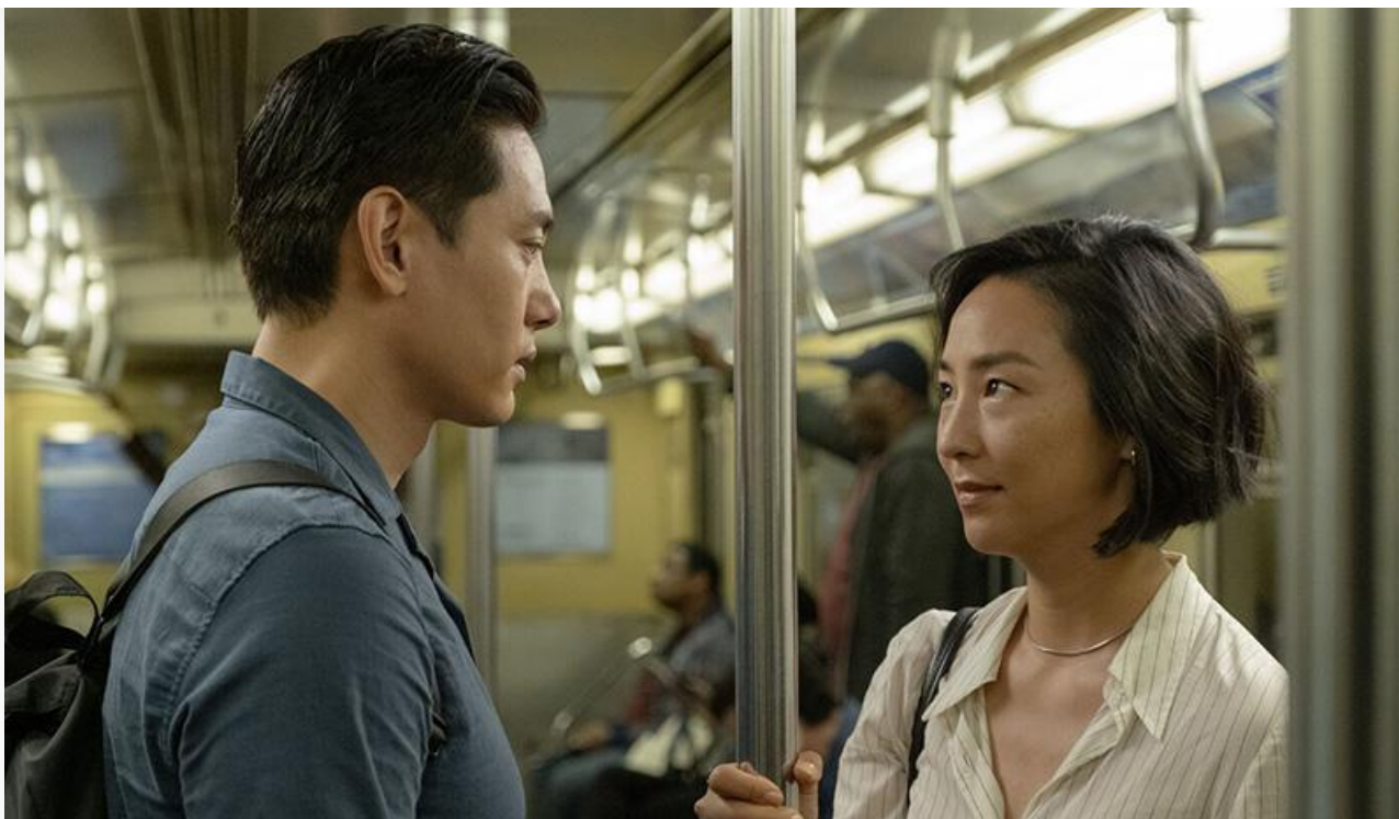
Кадр из фильма «Прошлые жизни»