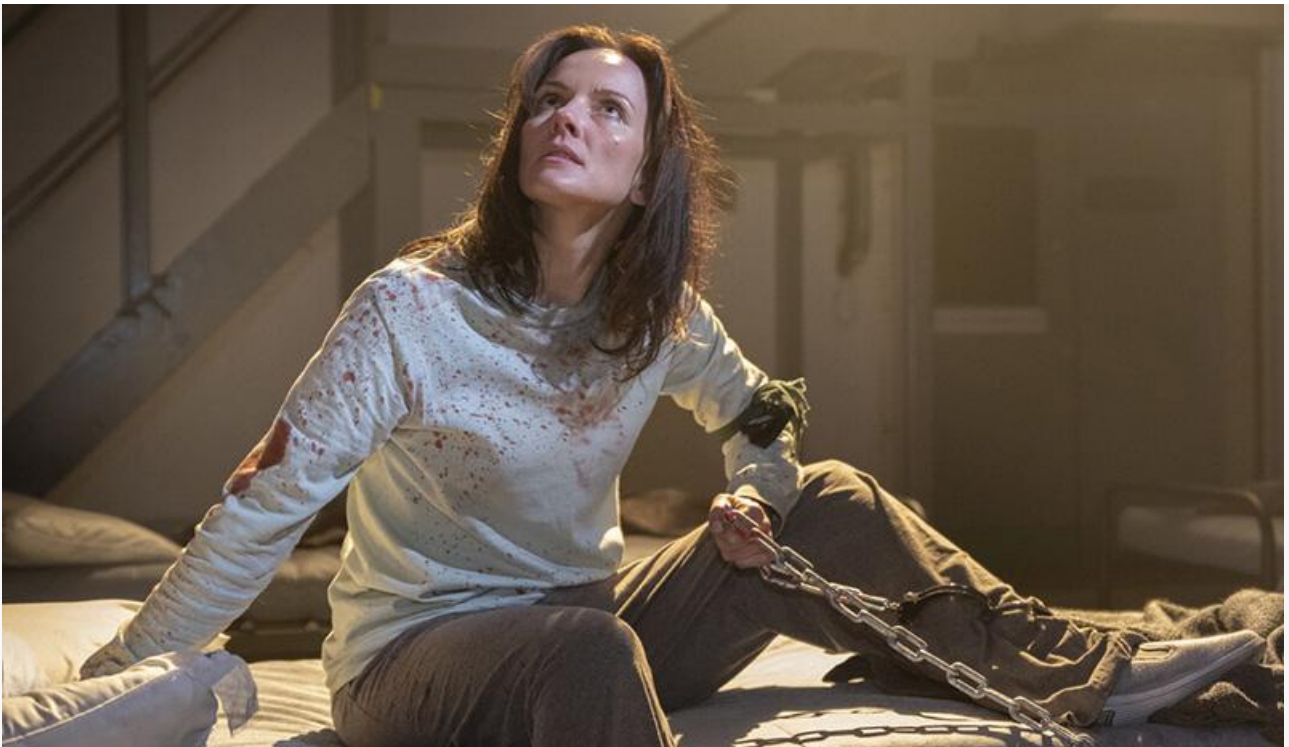
Кадр из фильма «Пила. Джокер»

Номинанты на премию «Оскар» – мелодрама Селин Сон «Прошлые жизни» и драма Тодда Хейнса «Май декабрь» – при неплохой посещаемости 54,5 и 47 зрителей за сеанс получили по 250 экранов и смогли собрать в кассах кинотеатров лишь 5,7 и 5,4 миллиона соответственно. Как результат – 15 и 17 строки в российском чарте.