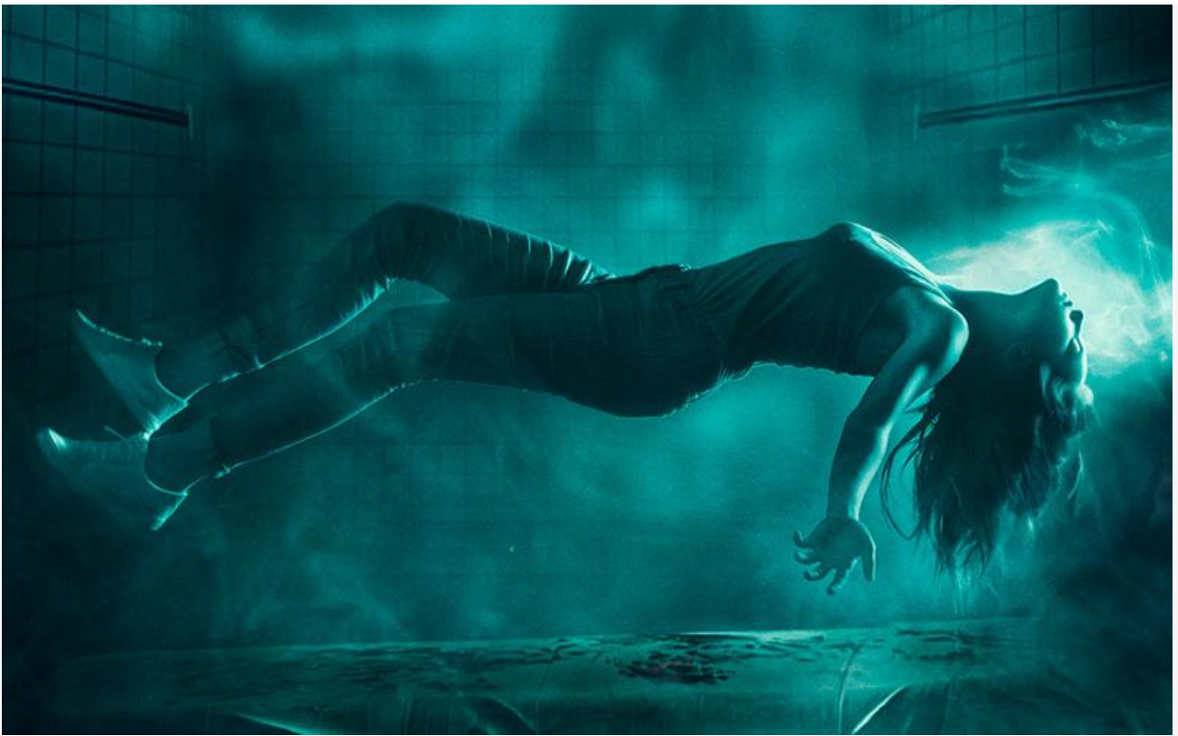
Постер к фильму «Клаустрофобы: Инсомния»

Среди других новинок проката – итало-франко-германская историческая мелодрама Пьетро Марчелло «Алые паруса» , итальянский альманах 2022 года «Italian Best Shorts 7: Быть женщиной» и документальный фильм Михаила Щедрина «Роман Костомаров. Рождённый дважды» .