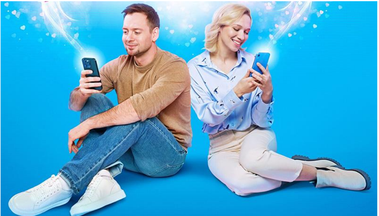
Постер к фильму «Любовь со второго взгляда»