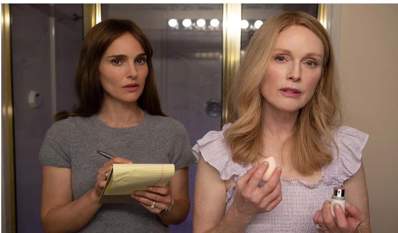
Кадр из фильма «Май декабрь»