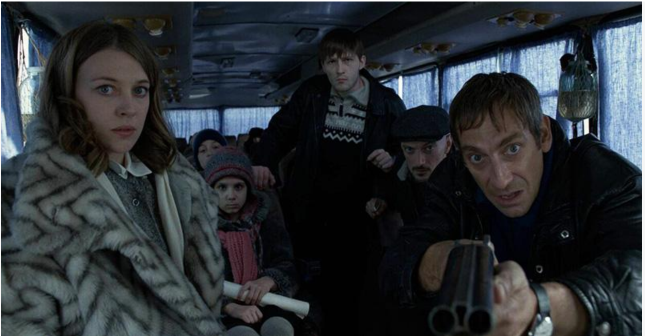
Кадр из фильма «Командир»