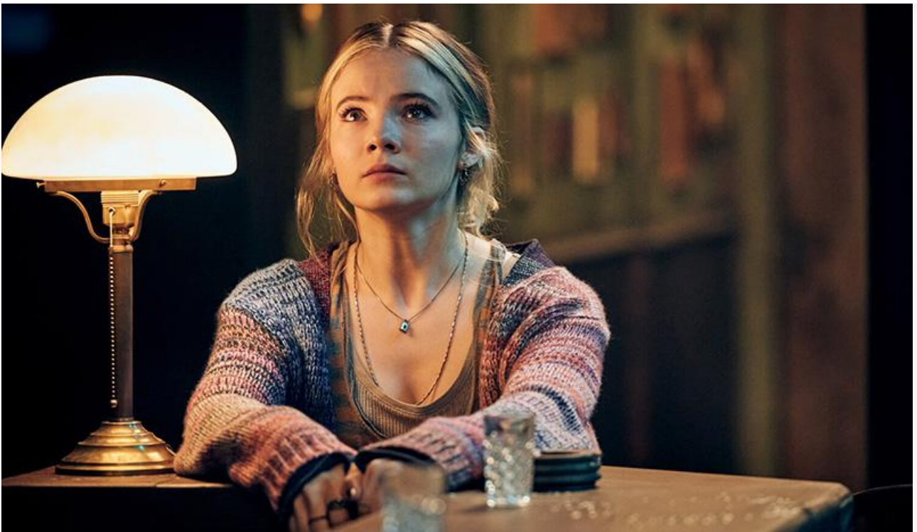
Кадр из фильма «Нечисть»

Наступивший уикенд вновь будет праздничным с тремя выходными вместо двух. Это значит, что сборы кинотеатров пойдут вверх. Тем более что нас, судя по всему, ожидает смена лидера проката.