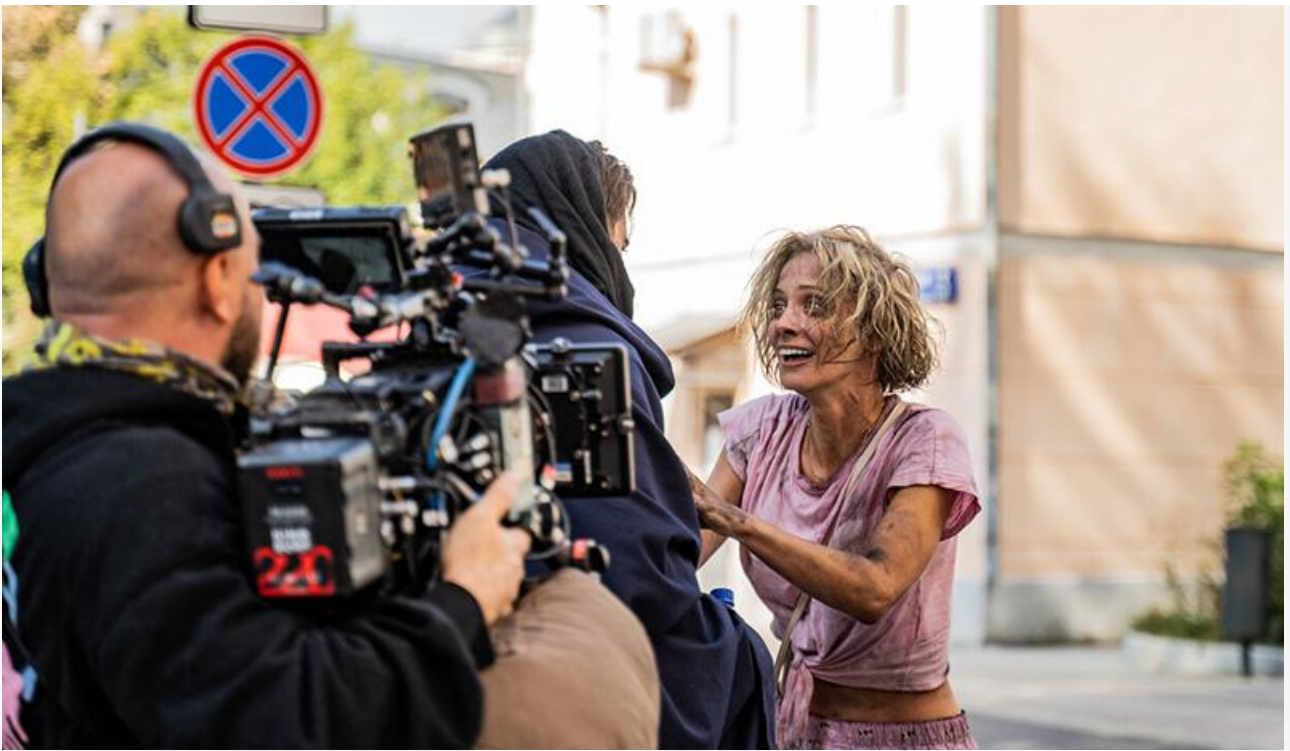
Полина Максимова на съёмках фильма «Адам и Ева»