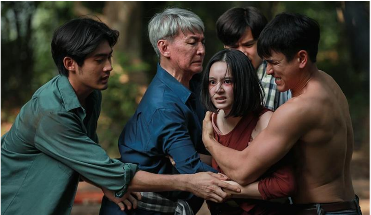
Кадр из фильма «Первая ведьма. Реинкарнация»