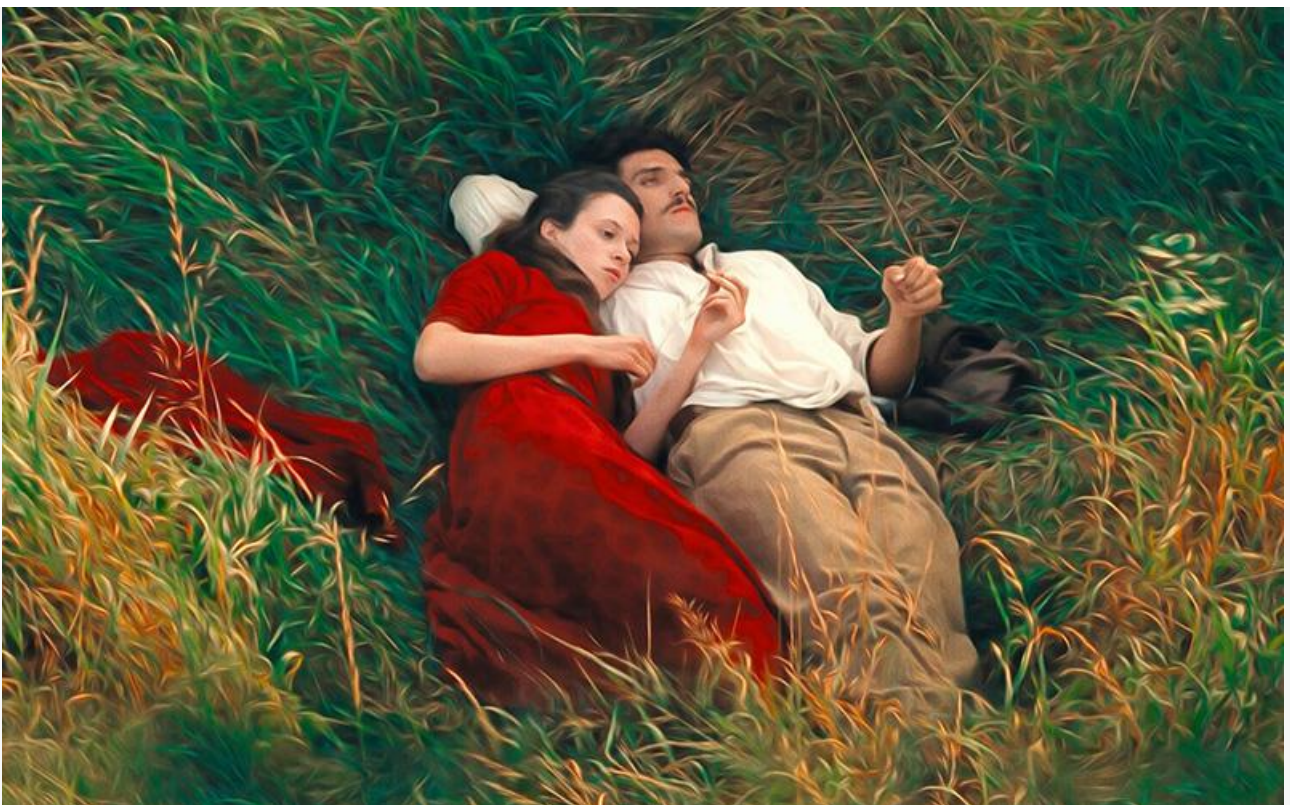
Постер к фильму «Алые паруса»

В формате перевыпуска зрители смогут вновь посмотреть на большом экране аниме Ёсифуми Кондо 1995 года «Шёпот сердца» .