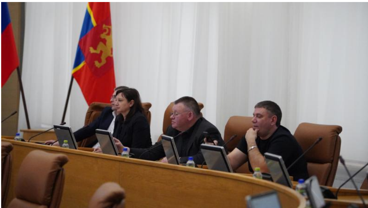
Фото: krasnoyarsk-gorsovet.ru , krasksp.ru , gazetankk

Автор: Валерий Лужный © Babr24.com НЕДВИЖИМОСТЬ, ПОЛИТИКА, ЭКОНОМИКА И БИЗНЕС, КРАСНОЯРСК 👁 17996 07.03.2024, 22:45 📄 270