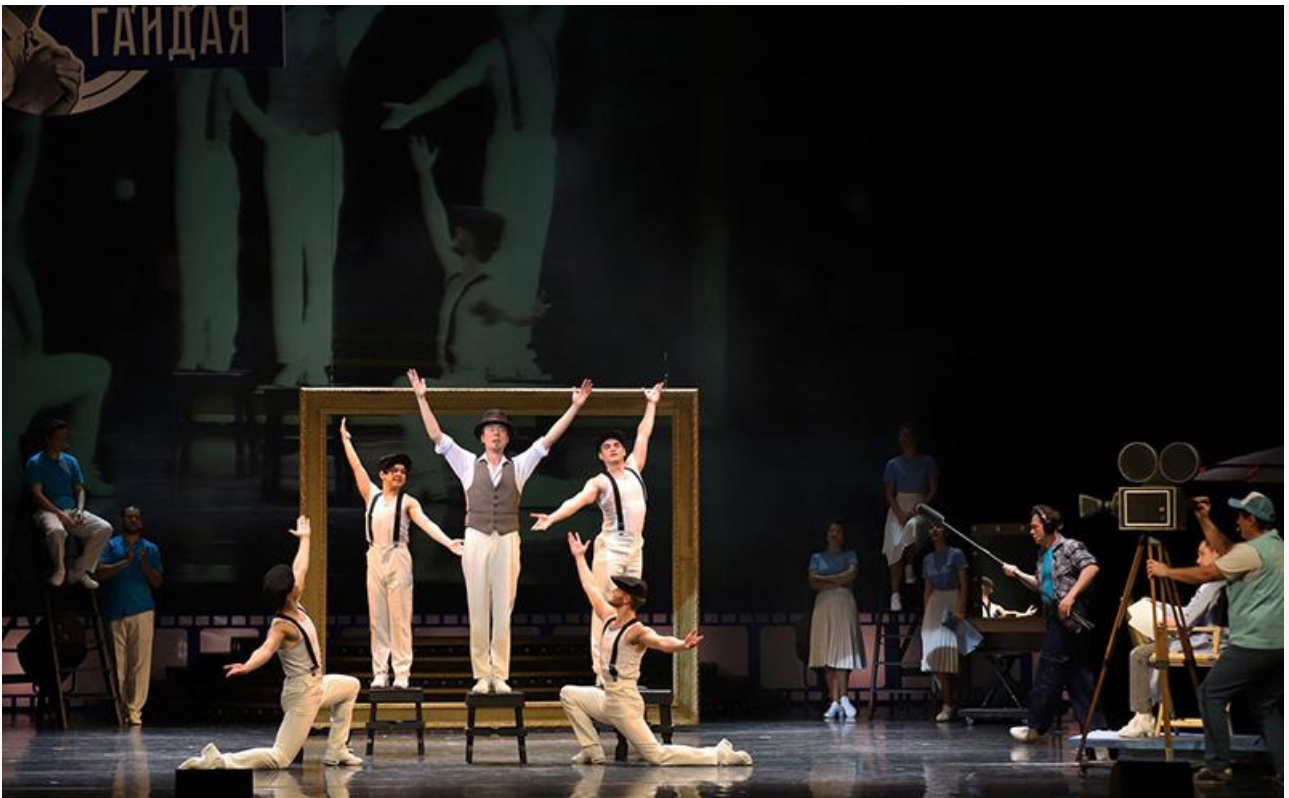
Сцена из спектакля «Формула Гайдая»

Начинается спектакль с сюрприза в виде... фонограммы. На первой премьере было особенно забавно: музыка зазвучала, когда маэстро Олин, только взобравшись на постамент, здоровался с первой скрипкой. Всё же помощнику режиссёра стоило дожидаться, чтобы дирижёр хотя бы встал красиво, если уж не смог весь музыкальный материал оркестровать.