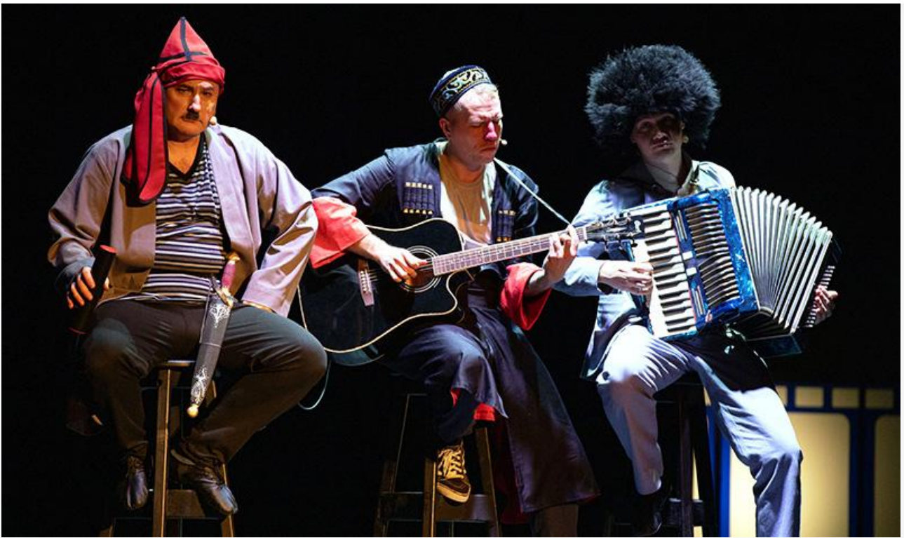
Сцена из спектакля «Формула Гайдая»

Ну и последнее. Как ни крути, но спектакль о Гайдае к его 100-летию – знаковое событие для Иркутска и области. Тем более что спектакль уникальный и целиком рождённый внутри театра. Однако министра культуры Олеся Полунину мы на премьерке не увидели. Невелика потеря, конечно, и не привыкать, но осадок остался.