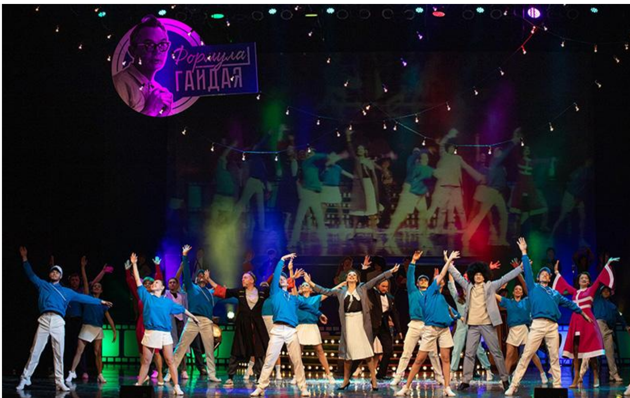
Сцена из спектакля «Формула Гайдая»

При этом совершенно не оправдан экран, за исключением документальных кадров, конечно. Нет, задумка с эффектом живой съёмки хорошая, но воплощение подкачало: вместо логичного крупного плана зритель видит либо дублирование общего, лишь отвлекающее от сцены, либо и вовсе суету за кулисами.