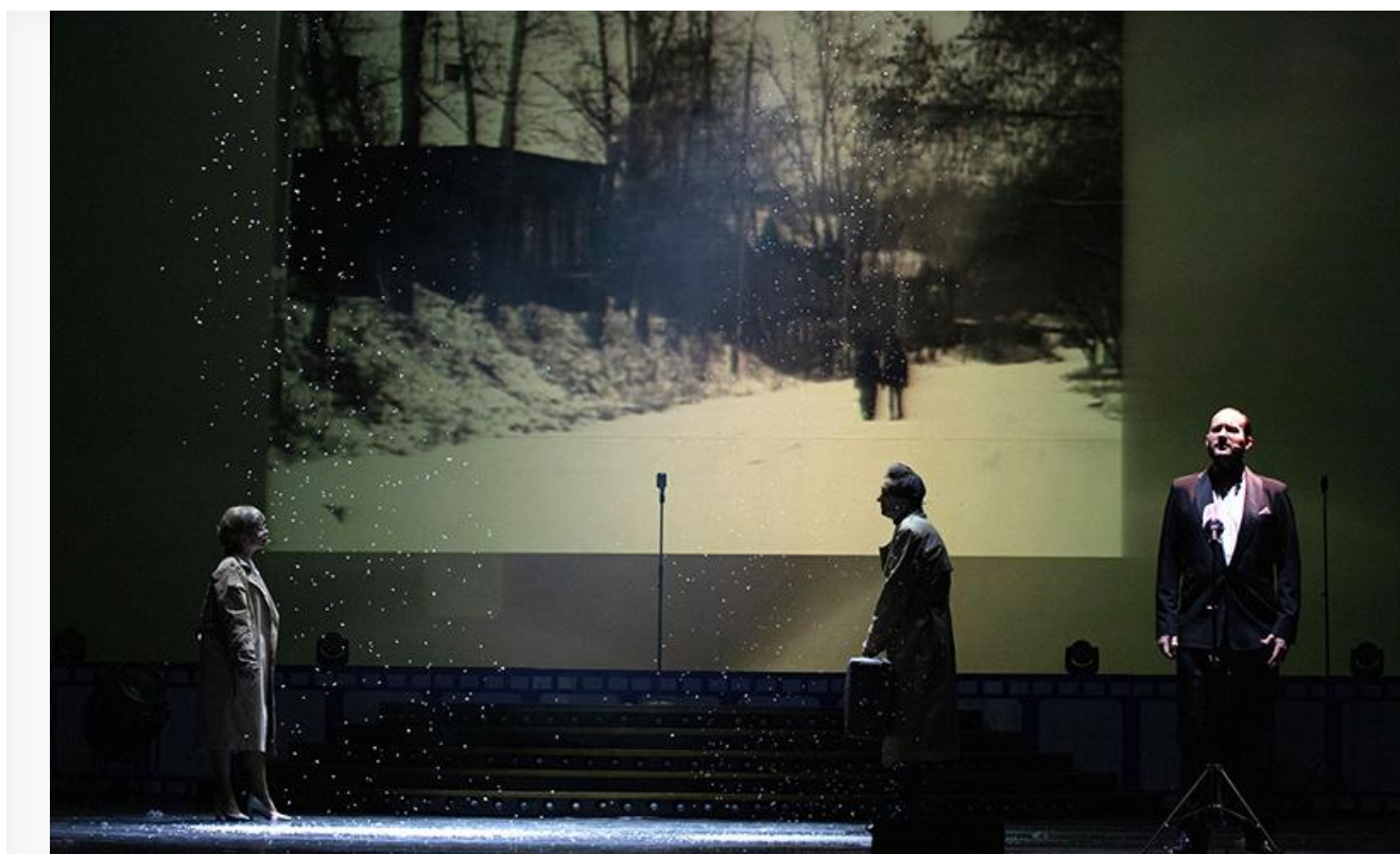
Сцена из спектакля «Формула Гайдая»

«Ленинградом» в первом акте, хоть и удивил, но всё же был уместен. Но заканчивать спектакль о Гайдае песней из фильма Аллы Суриковой? Неужели нельзя было без неё обойтись? Конечно можно. И финал от этого только выиграл бы.