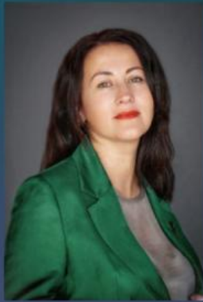
заведующая литературно-драматургической частью

Образование — высшее, Иркутский государственный технический университет, специальность декоративно-прикладное искусство и народные промыслы. В 2011 году закончила ФГОУ ВПО «Сибирская академия государственной службы», специальность государственное и муниципальное управление.