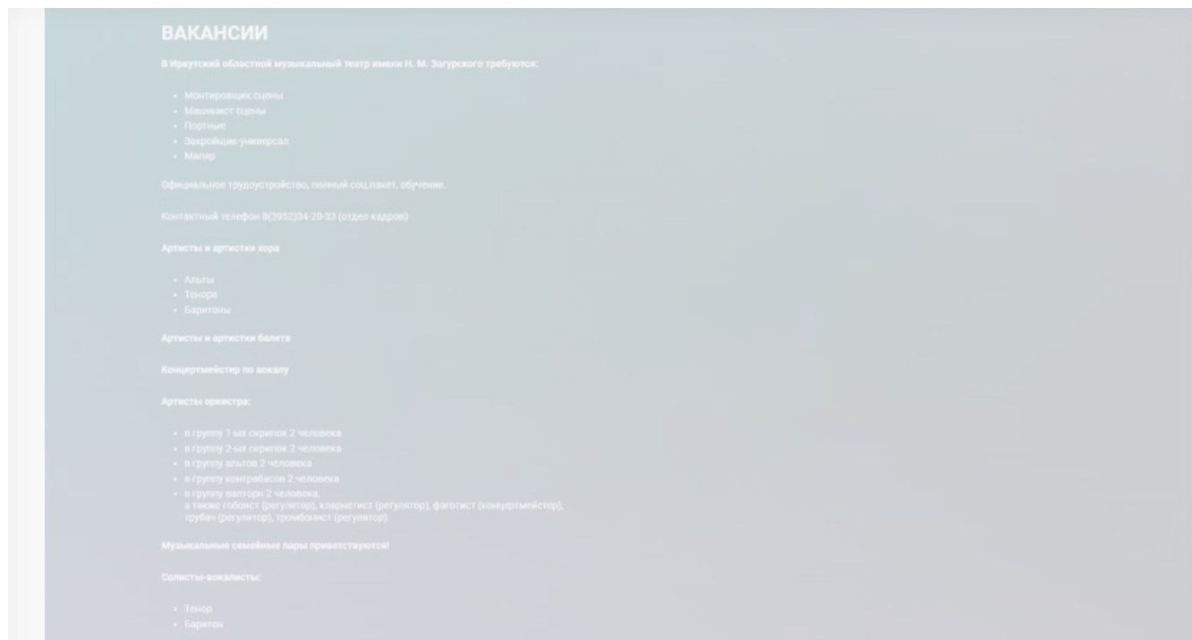
Перечень вакансий на сайте театра