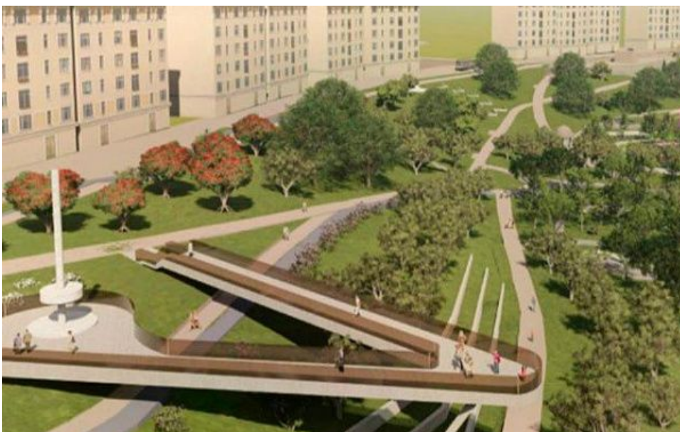
Зона отдыха у пруда. Вид 1

Интересно, что 17 января в интернете появился генеральный план благоустройства правой стороны «Мемориала Победы» от проектной мастерской «Атриум». Сейчас страница удалена, но в поисковиках осталась сохраненная копия. Возможно, случилась замена проекта, как это ранее произошло со зданиями театра «Байкал» и национального музея Бурятии.