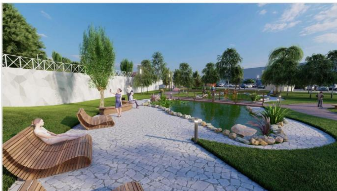
Фото из генплана

Бабр продолжит внимательно следить за развитием событий.