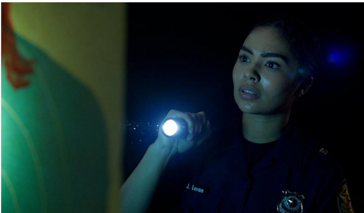
Кадр из фильма «Астрал. Ритуал Малум»