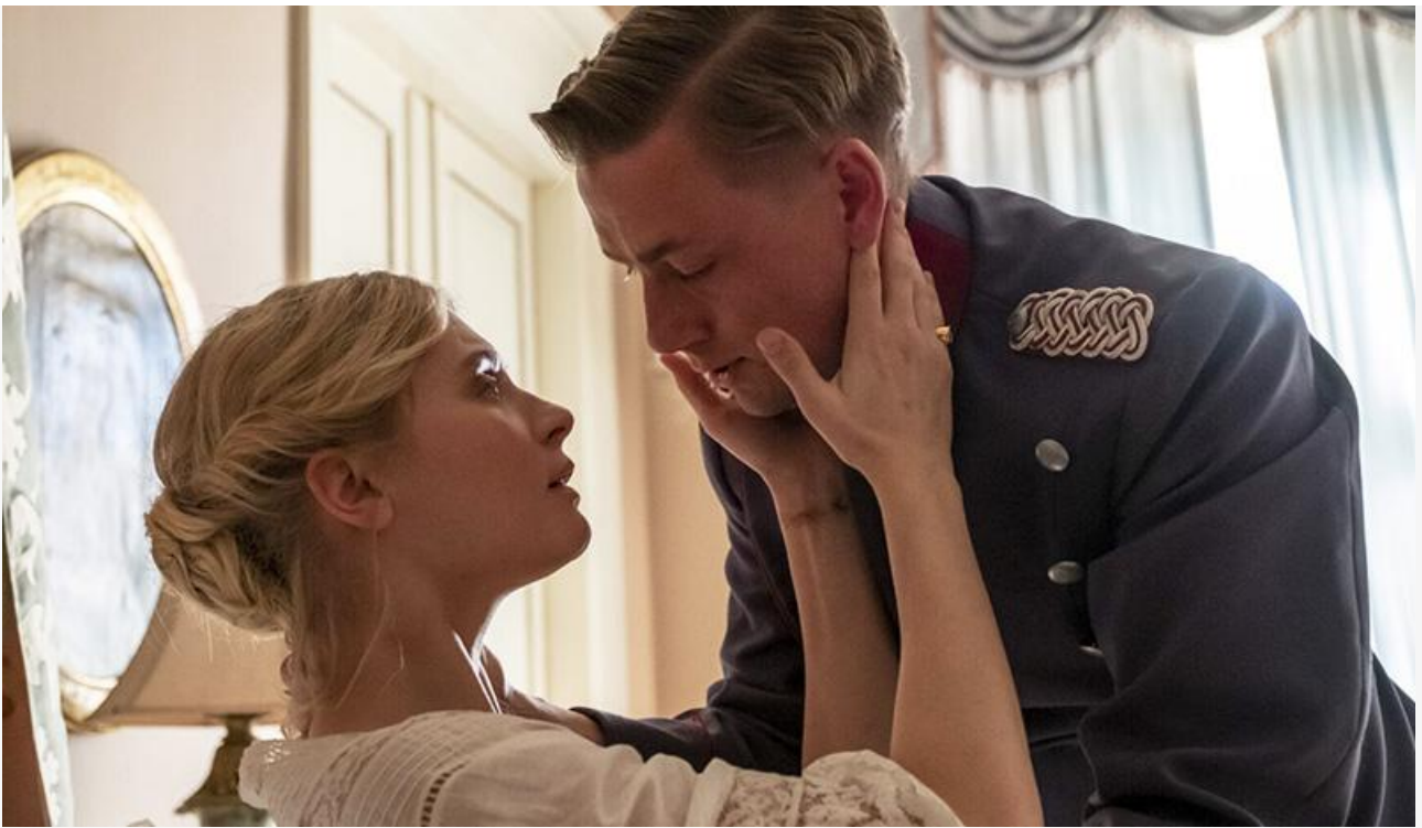
Кадр из фильма «Поцелуй»

В формате переиздания зрители смогут вновь посмотреть на большом экране аниме Макото Синкая 2007 года « 5 сантиметров в секунду ».