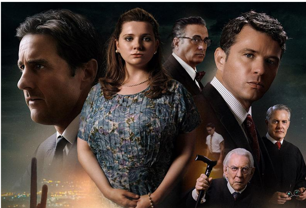
Постер к фильму

На семейную аудиторию, а значит, на потенциальный успех рассчитаны франко-германская приключенческая лента Жиль де Мэтра « Элла и чёрный ягуар » и бразильско-индийский приключенческий мультфильм « Звериный рейс ».