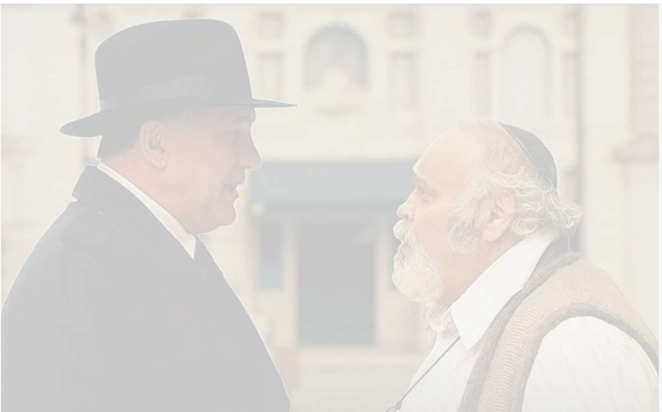
Постер к фильму «Портной из Бруклина»