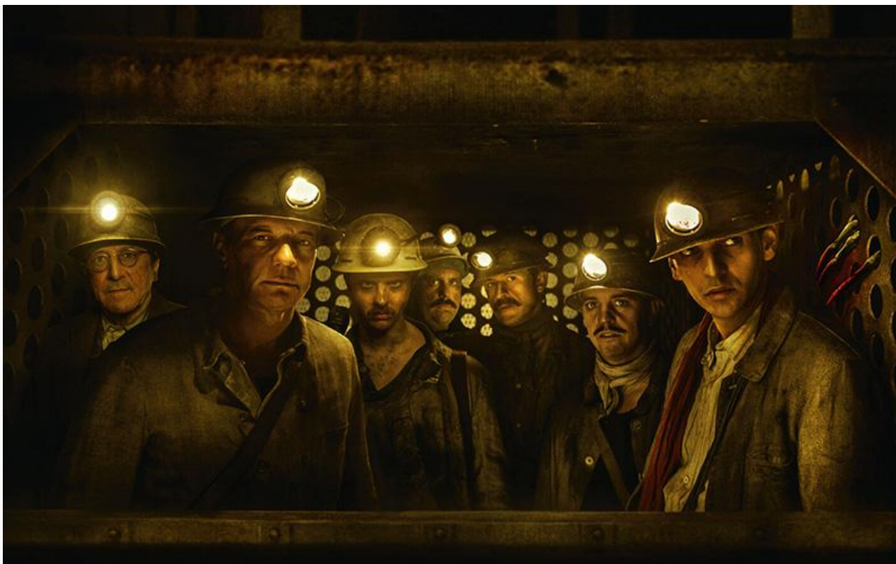
Постер к фильму «Спуск в бездну»

американский хоррор Энтони ДиБлази «Астрал. Ритуал Малум» (18+) и тайландский триллер 2022 года «Демоны внутри» (18+).