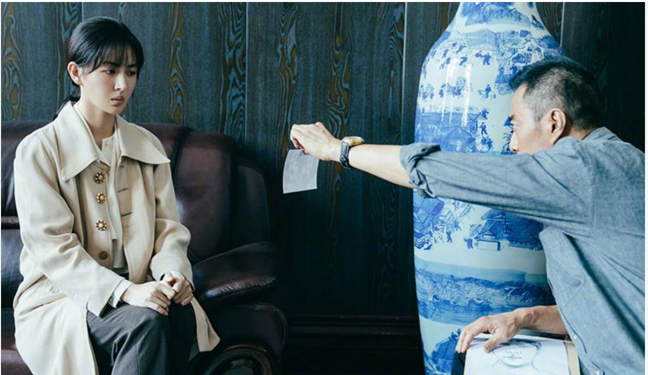
Кадр из фильма «Миссия в Москве»