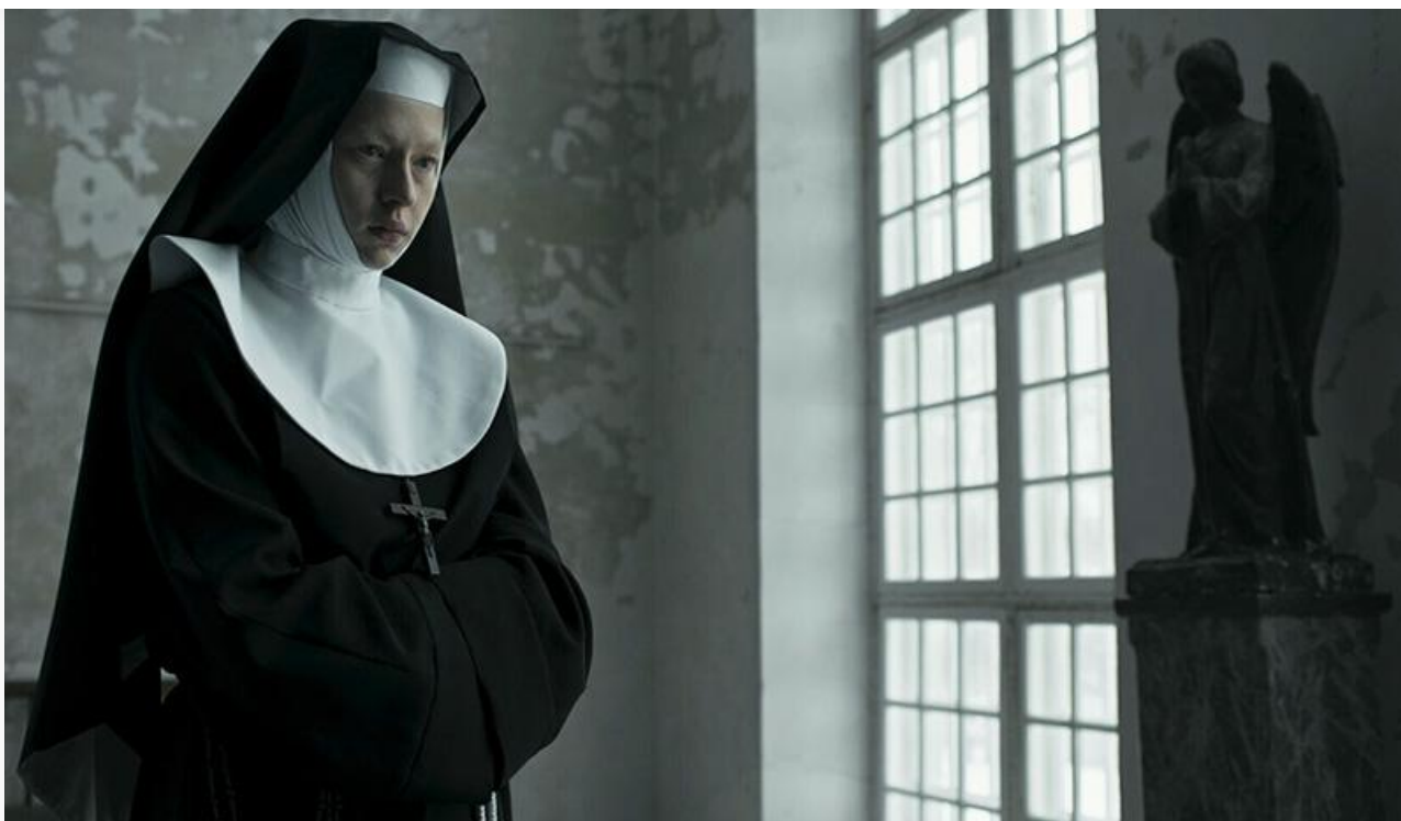
Кадр из фильма «Избави нас. Одержимые»