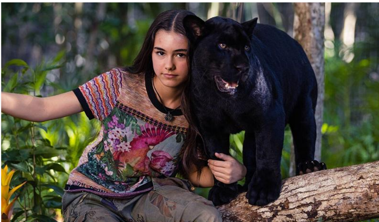
Кадр из фильма «Элла и чёрный ягуар»