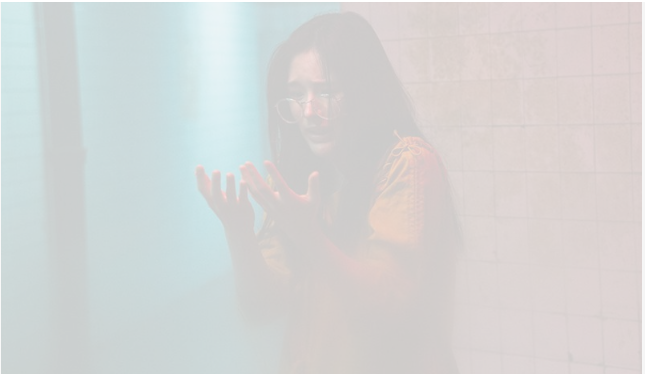
Кадр из фильма «Демоны внутри»