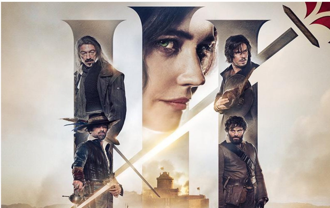
Постер к фильму «Три мушкетёра: Миледи»