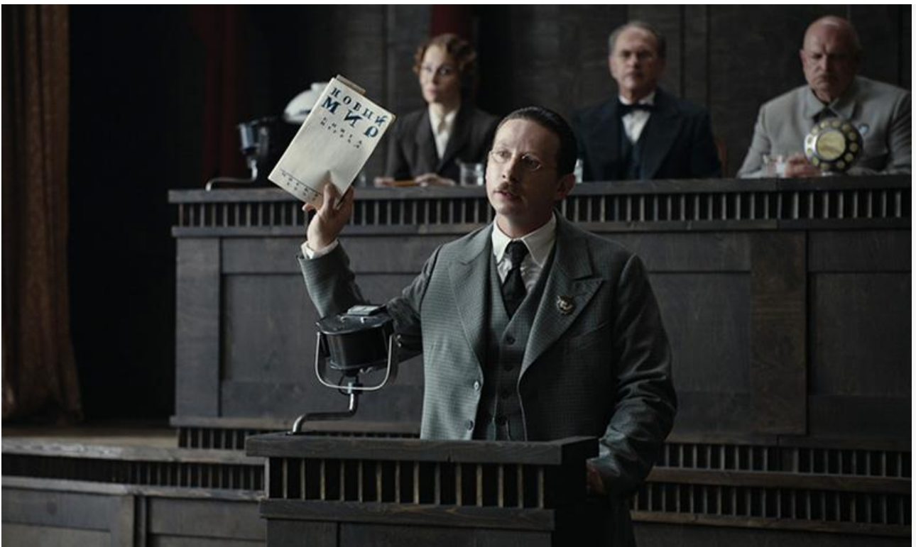
Кадр из фильма «Мастер и Маргарита»

Относительно неплохо стартовала семейная комедия Кирилла Кемница с Никитой Кологривым и Агатой Муцениеце «Я – медведь», на счету которой 62,4 миллиона рублей, собранных на 2 024 экранах, средняя посещаемость 103 зрителя за сеанс и пятое место.