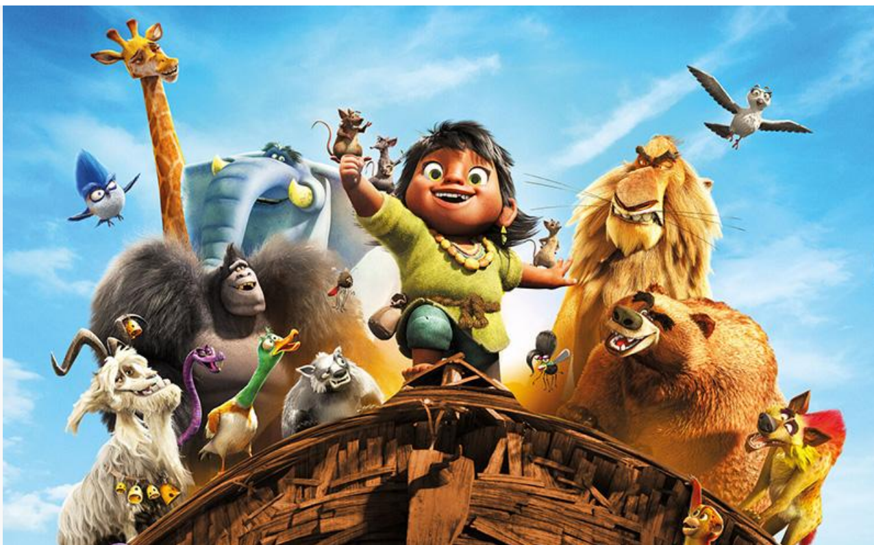
Постер к фильму «Звериный рейс»

Поклонников фильмов ужасов ждут в кинотеатрах французский «Спуск в бездну» (18+) Матьё Тури,