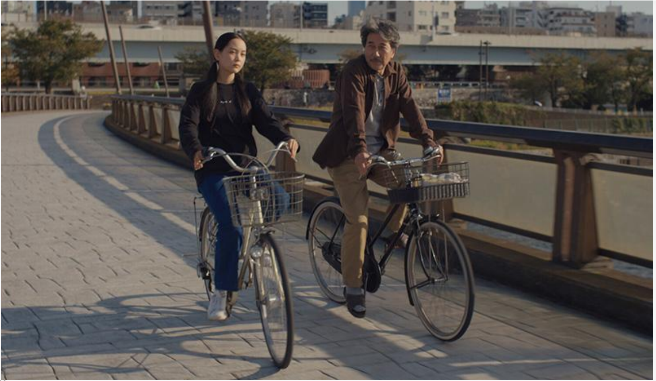
Кадр из фильма «Идеальные дни»

Сохранили места в десятке лучших «Воздух» (59,3 миллиона с потерей в сборах 43 % и шестое место), «Три богатыря и Пуп Земли» (25,5 миллиона с потерей в сборах 33 % и седьмое место) и «Мальчик и птица» (6,3 миллиона с потерей в сборах 23 % и десятое место).