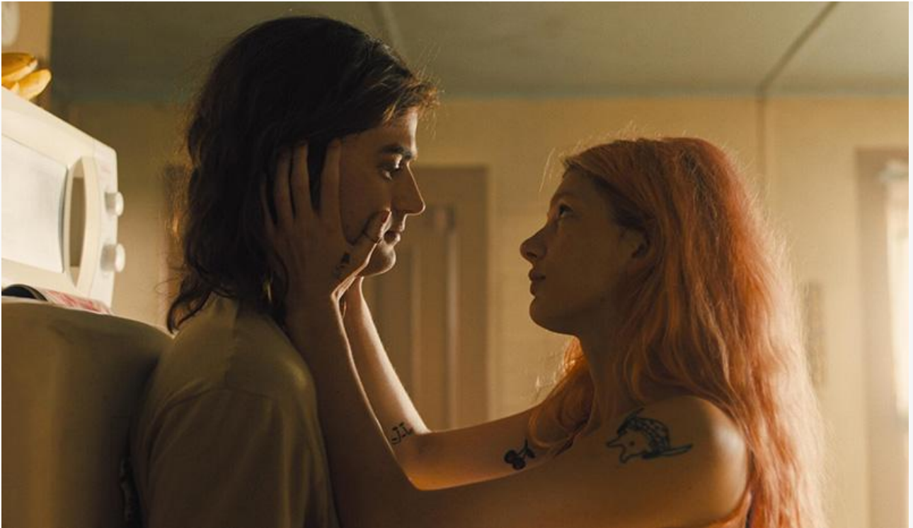
Кадр из фильма «Мармелад»