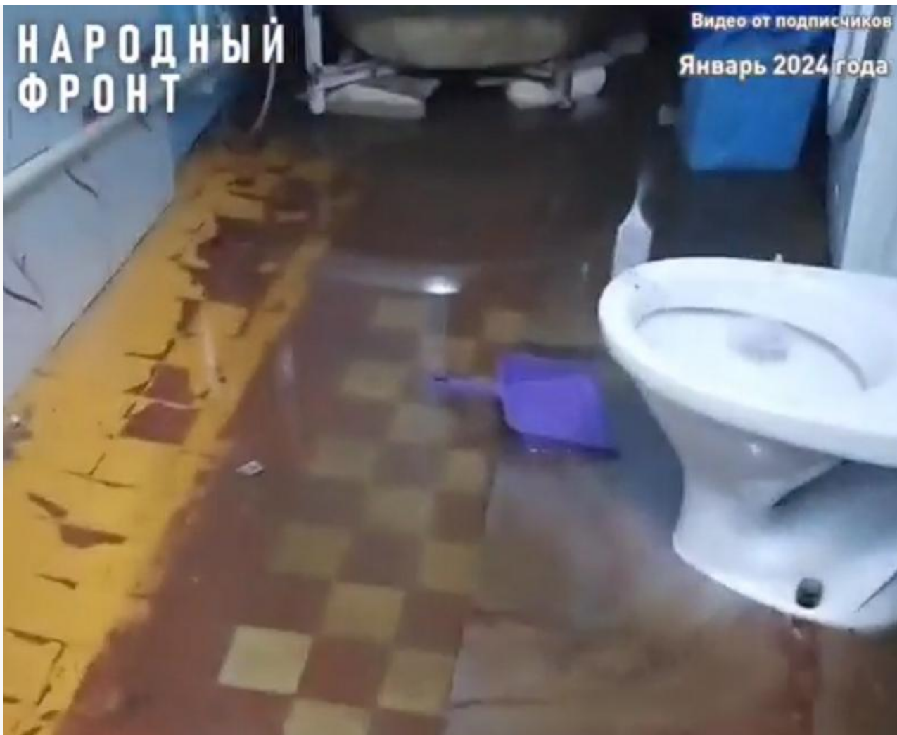
Скриншот видео Народного фронта. Местная жительница демонстрирует подтопление у себя дома

Только после того как активисты Народного фронта по Бурятии обратили внимание СМИ на проблему жителей поселка Гусиное Озеро, местный поставщик коммунальных ресурсов «Импульс Плюс» 24 января выступил с заявлением. Со слов представителей компании, трубу прорвало из-за критического износа. Местным жителям было предложено бесплатное подключение к новой системе водоснабжения через прокол, но они по каким-то причинам отказались.