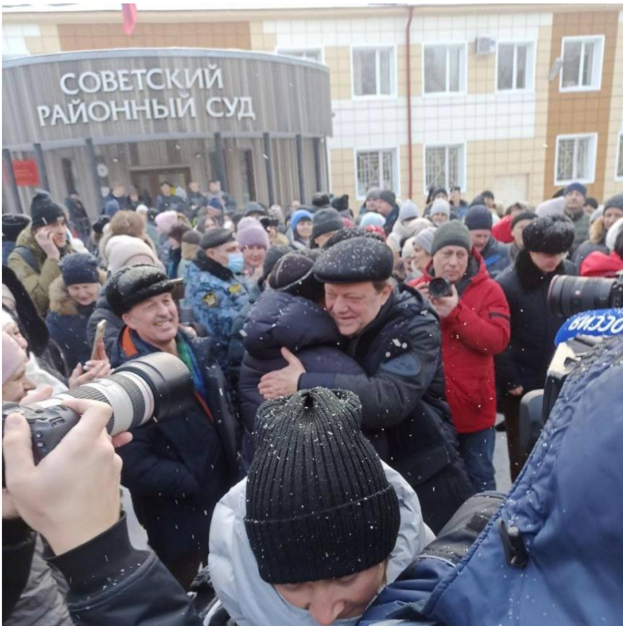
Фото: Бабр, ТГ-канал «За Кляйна». Видео: ТГ-канал «За Кляйна»

Автор: Андрей Игнатьев © Babr24.com КРИМИНАЛ, РАССЛЕДОВАНИЯ, ПОЛИТИКА, ТОМСК 22196 31.01.2024, 12:58 359