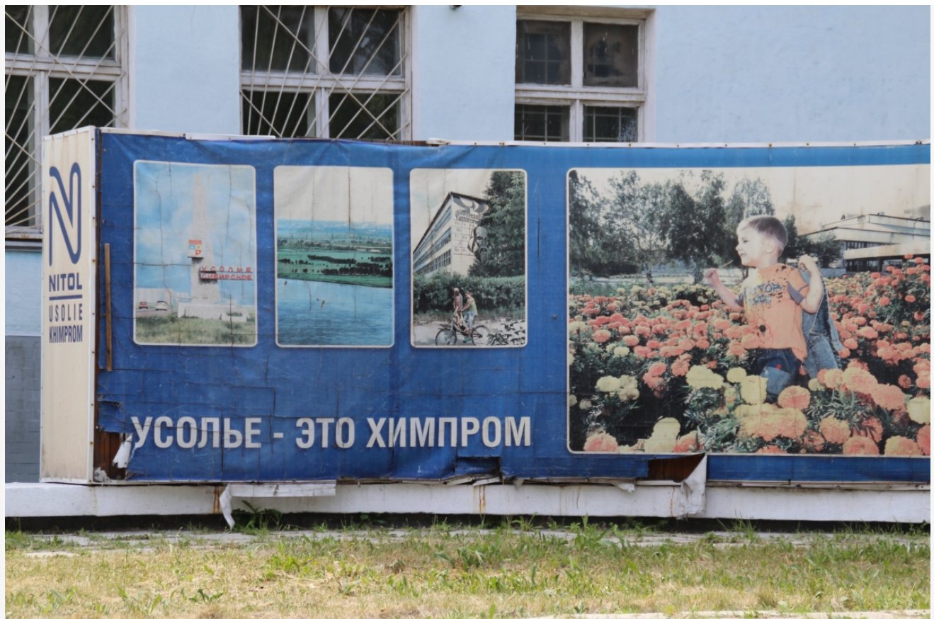
Автор: Даниил Тетерин Фото из альбома "Иркутская область. Усольский Химпром" © Фотобанк "RuBabr"

В 2020 году ФГУП «Федеральный экологический оператор» был назначен ликвидатором накопленного вреда на территории БЦБК. Также в 2021 году дочерняя компания ВЭБ.РФ БАЙКАЛ.ЦЕНТР приобрела территорию БЦБК и получила статус регионального оператора Фонда «Сколково».