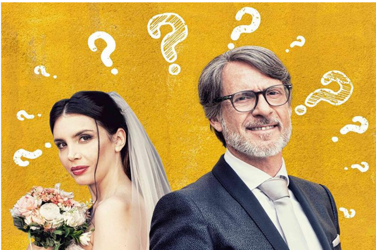
Постер к фильму «Нерешительный жених»