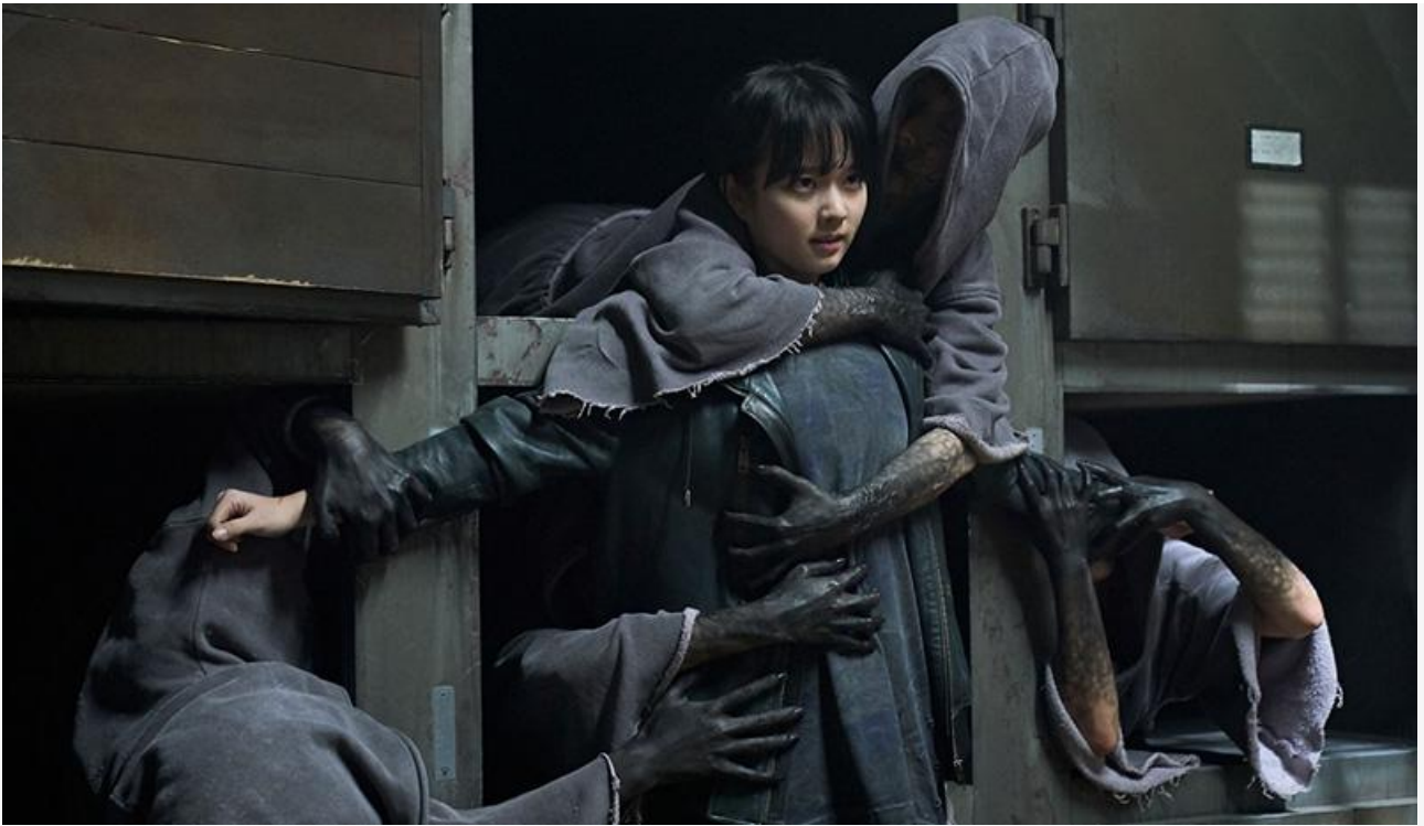
Кадр из фильма «Армия мёртвых в Пусане»

Также на экраны выходят драма Ивана И. Твердовского «Панические атаки» (18+) с Леной Трониной, британский фантастический триллер Спенсера Брауна «Иллюзия превосходства» , американский экшн-триллер Джона Сталберга «Плохие парни» (18+) и итальянская комедийная мелодрама Джорджо Амато «Нерешительный жених» с Орнеллой Мути в одной из главных ролей.