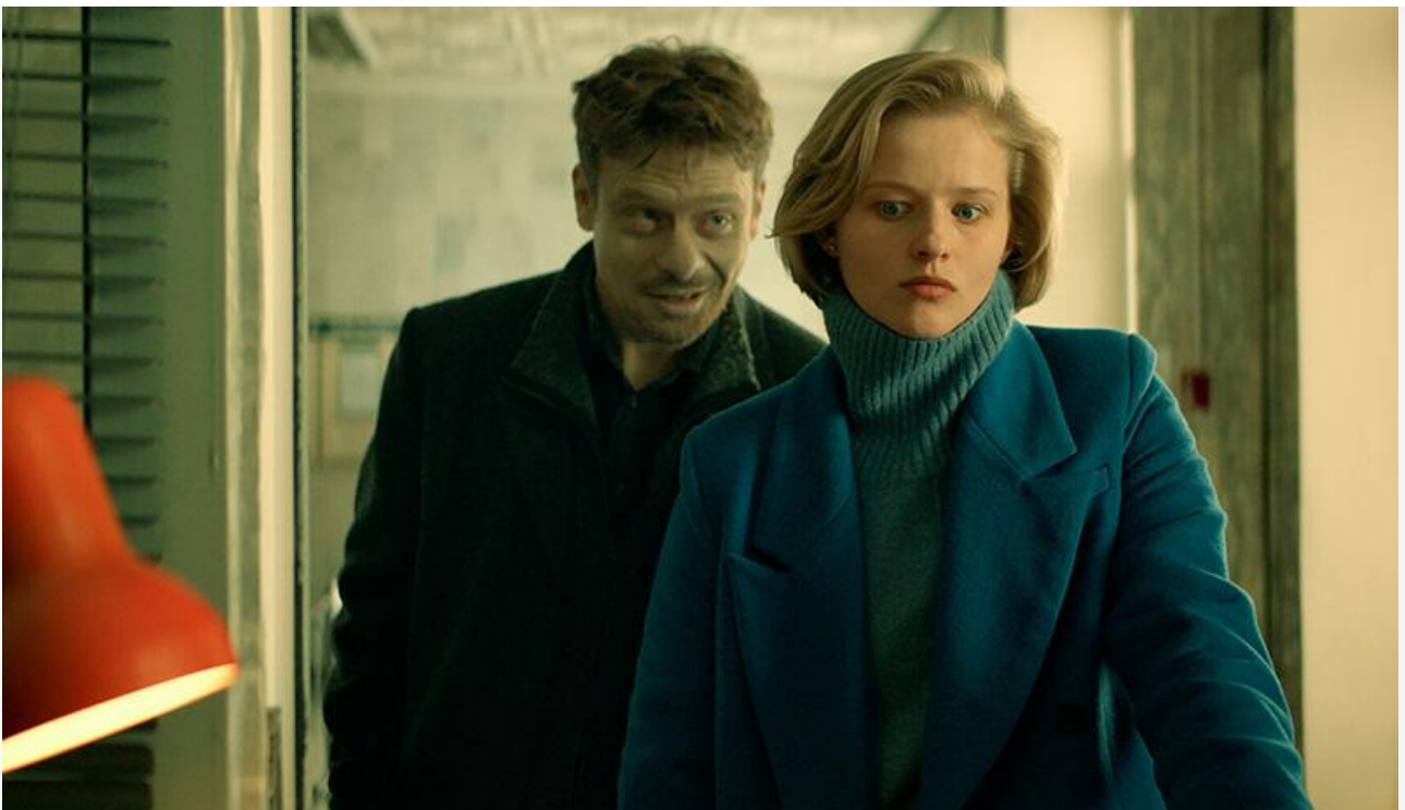
Кадр из фильма «Танцуй, Селёдка!»

Ещё хуже дела у триллера Тома Бидегена «Остров изгоев» (4,6 миллиона на 322 экранах и 14-е место), южнокорейского хоррора «Вкус страха» (2,9 миллиона на 122 экранах и 16-е место), военно-приключенческой драмы Марка Форстера «Белая птица. Новое чудо» (2,6 миллиона на 465 экранах и 18-е место), фэнтези ужасов Адриена Бо «Вурдалак» (1,7 миллиона на 277 экранах и 19-е место).