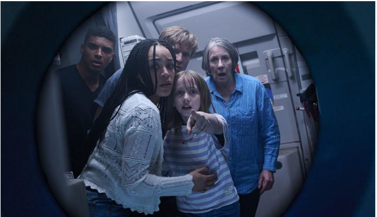
Кадр из фильма «Из глубины»

Восьмое место весьма неожиданно заняло аниме Хаяо Миядзаки 1997 года « Принцесса Мононоке », в формате переиздания получившее всего 208 экранов, однако собравшее семь миллионов рублей при средней посещаемости 115 зрителей за сеанс.