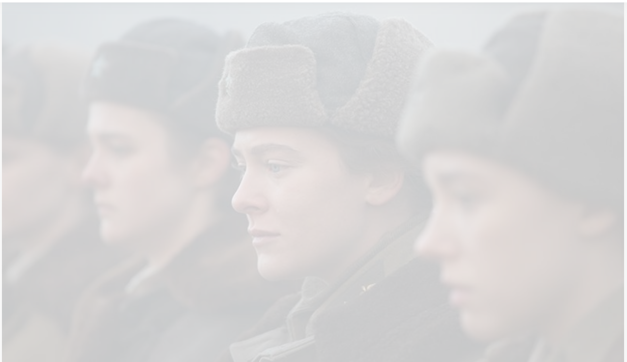
На съёмках фильма «Воздух»