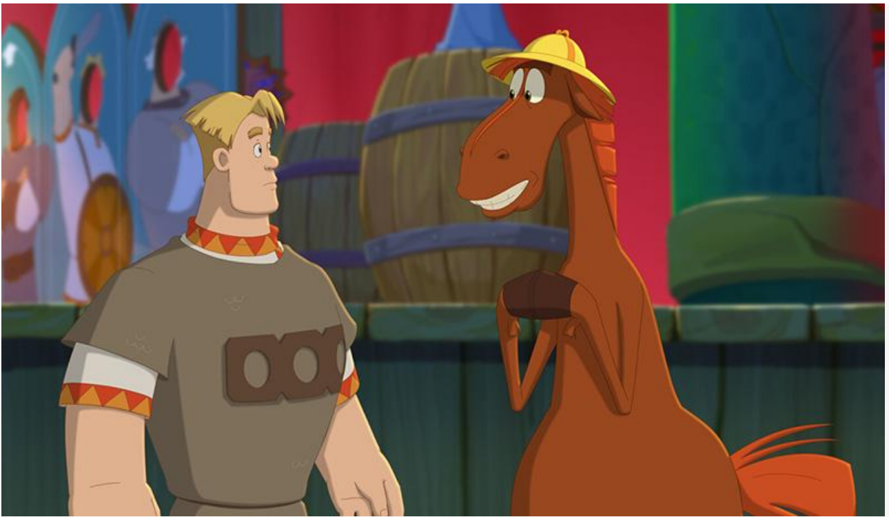
Кадр из фильма «Три богатыря и Пуп Земли»