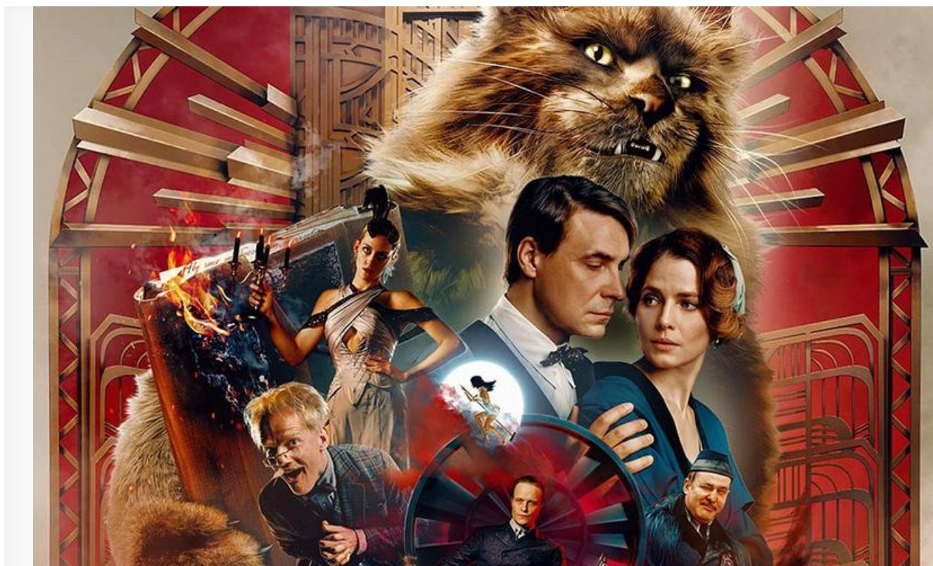
Постер к фильму «Мастер и Маргарита»