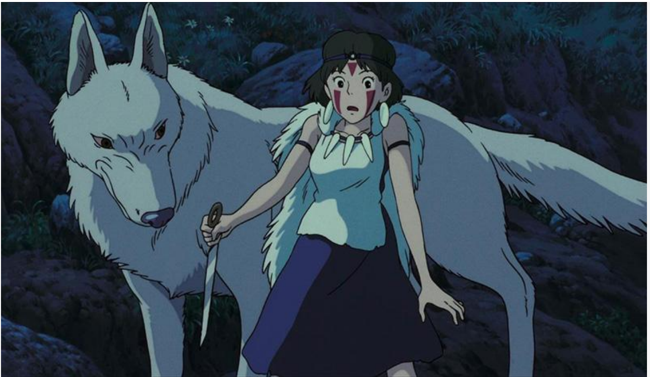
Кадр из фильма «Принцесса Мононоке»