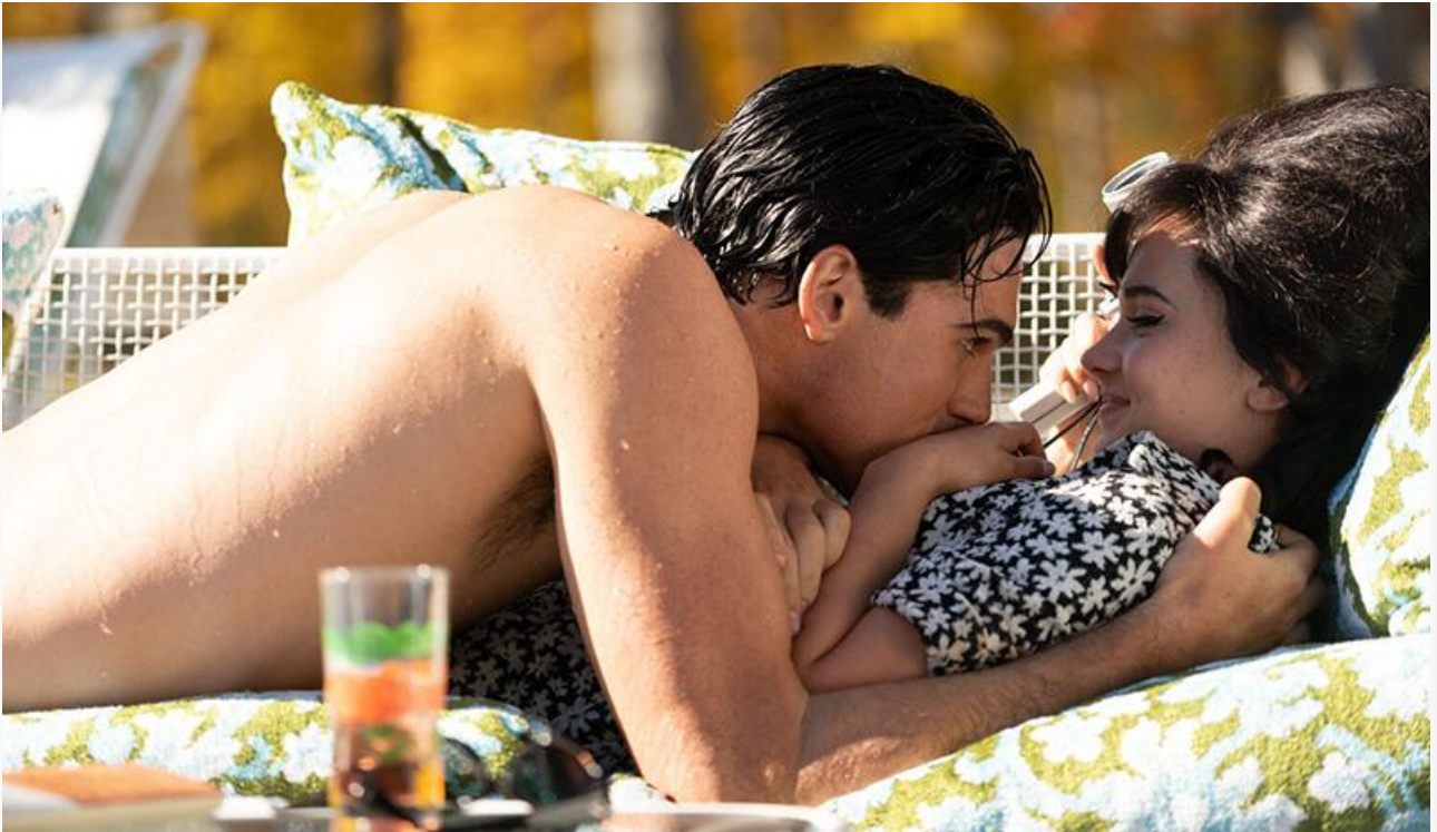
Кадр из фильма «Присцилла: Элвис и я»