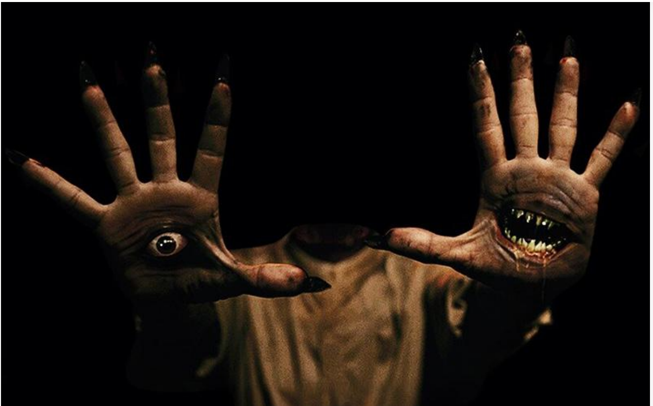
Постер к фильму «Демон, приходи: Новый ритуал»