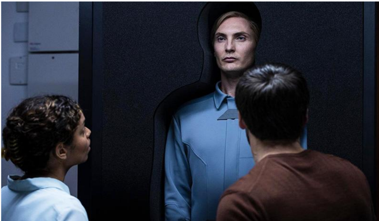
Кадр из фильма «Иллюзия превосходства»