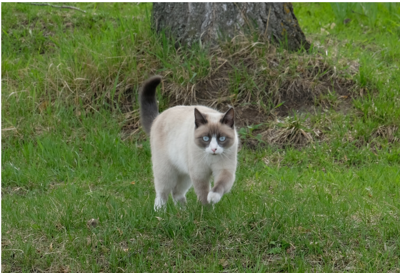
Автор: Алёна Штерн Фото из альбома "Кошки" © Фотобанк "RuBabr"

Необходимо проводить активную работу по стерилизации и кастрации бездомных животных с целью контролирования их популяции . Это может быть эффективным путем снижения численности бездомных животных и предотвращения размножения.