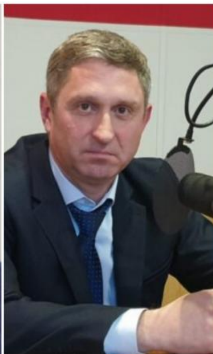
Фото: vtomske.ru , admin.tomsk.ru , radio-blagovest.ru

Автор: Андрей Тихонов © Babr24.com ПОЛИТИКА, ЖКХ, ЭКОЛОГИЯ, ТОМСК 👁 21437 24.01.2024, 23:09 👍 287