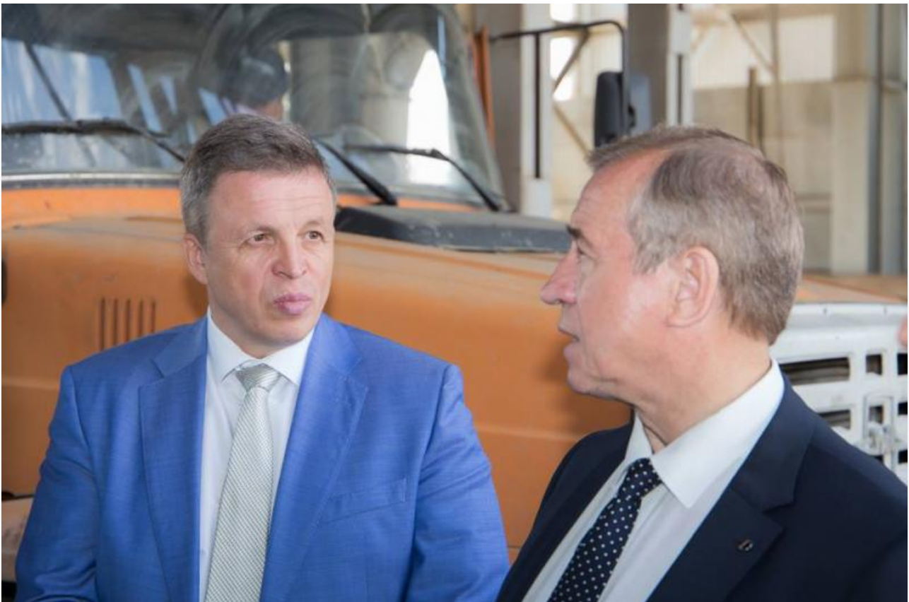
В прошлом, видимо, товарищество