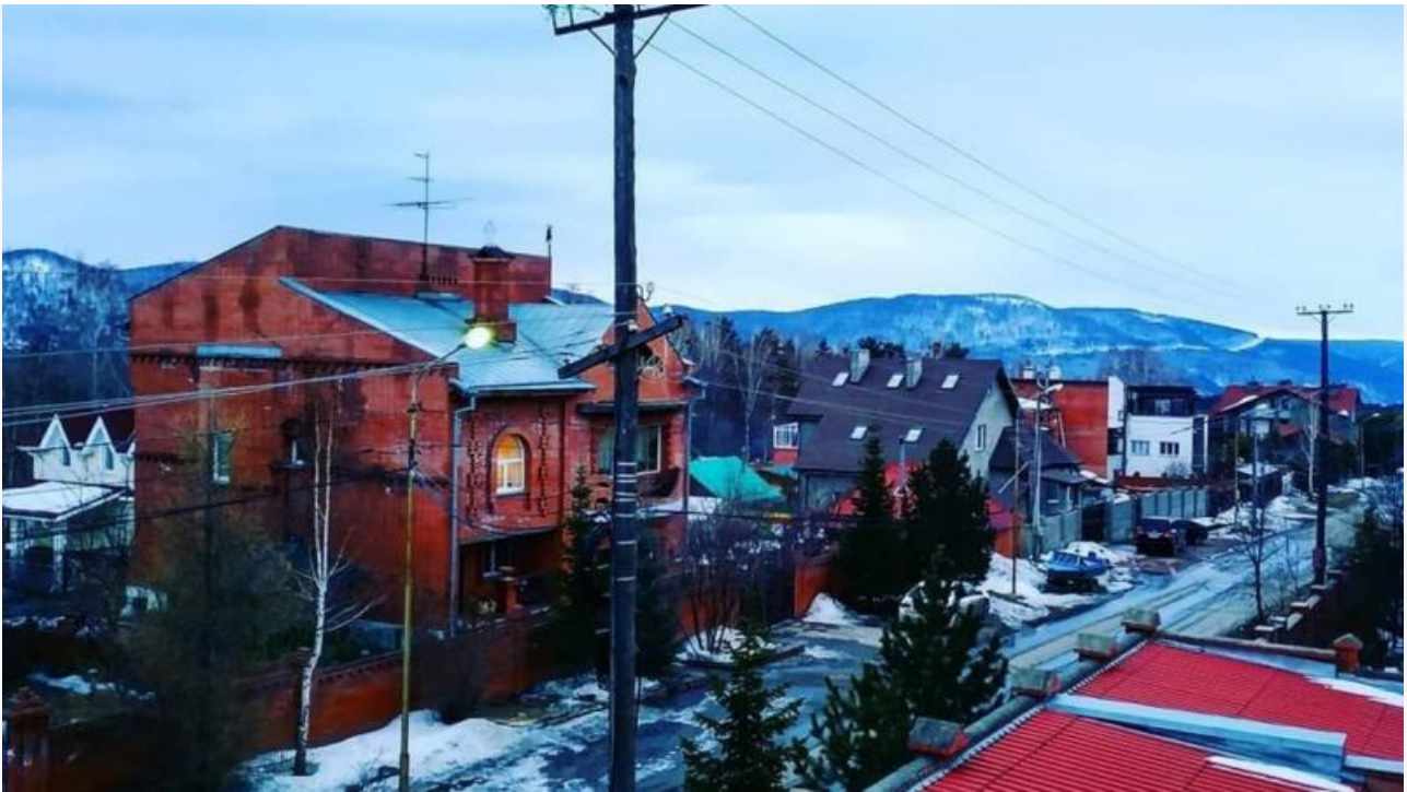
Микрорайон Горный / danilovsergei_

Участок земли на Большом бульваре в микрорайоне Горный давно стал предметом пересудов для местных жителей и тех, кто землей владел. Первые конфликты начались еще в 2016 году: тогда на участке было разрешено строительство частного дома на 512 квадратных метров, в три этажа вместе с подземной частью. Впоследствии, рассказывают соседи, выяснилось, что участок разрабатывают не совсем по плану: на месте вырыли котлован и начали заливать фундамент, работы проводились на площади, превышающей норму.