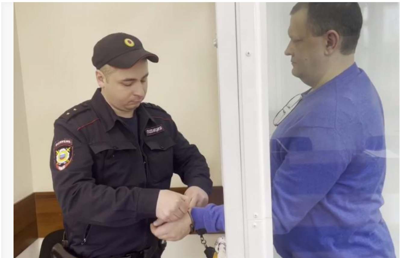
Экс-министр лесного хозяйства Красноярского края Дмитрий Маслодудов

Несмотря на то что Маслодудов не признает своей вины, обвинение просит для бывшего чиновника наказание в виде 13 лет лишения свободы в колонии строгого режима , штрафа в 17,8 миллиона рублей и запрета на занятие должностей в органах государственной власти в течение 14 лет.