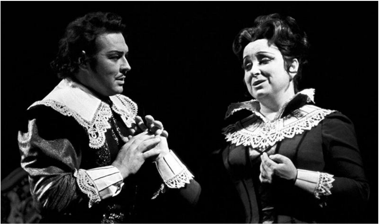
Тамара Милашкина и Владимир Атлантов в партиях Донны Анны и Дон Жуана в опере «Каменный гость»

Голосу и актёрскому мастерству Тамары Милашкиной аплодировала публика театров Милана, Вены, Зальцбурга, Парижа, Нью-Йорка, Вашингтона, Берлина, Мюнхена, Висбадена, Дрездена, Афин, Токио, Монреаля, Торонто.