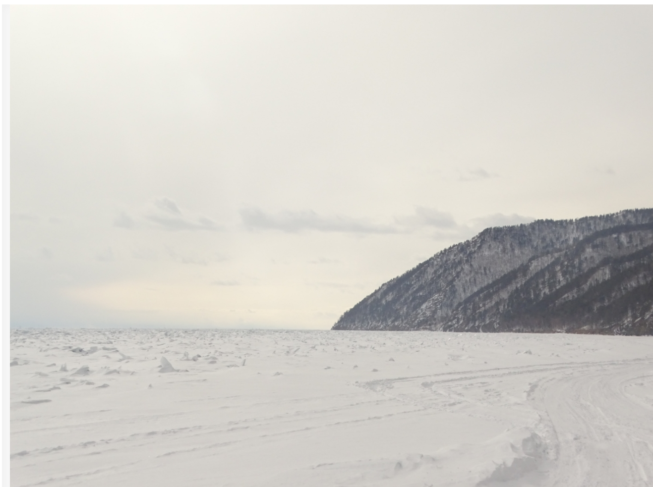
Автор: Инга Гаврикова Фото из альбома

Есть четкое ощущение, что эти компании забыли о главной цели и намеренно отводят общественное внимание от проблемы загрязнения озера. Граждане, волонтеры, фонды и частные компании вкладывают больше усилий и собственных средств для решения проблемы экологии Байкала, чем государственные корпорации.