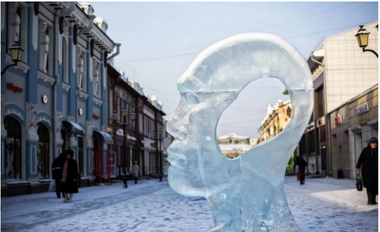
Символ организаторского мыслительного процесса