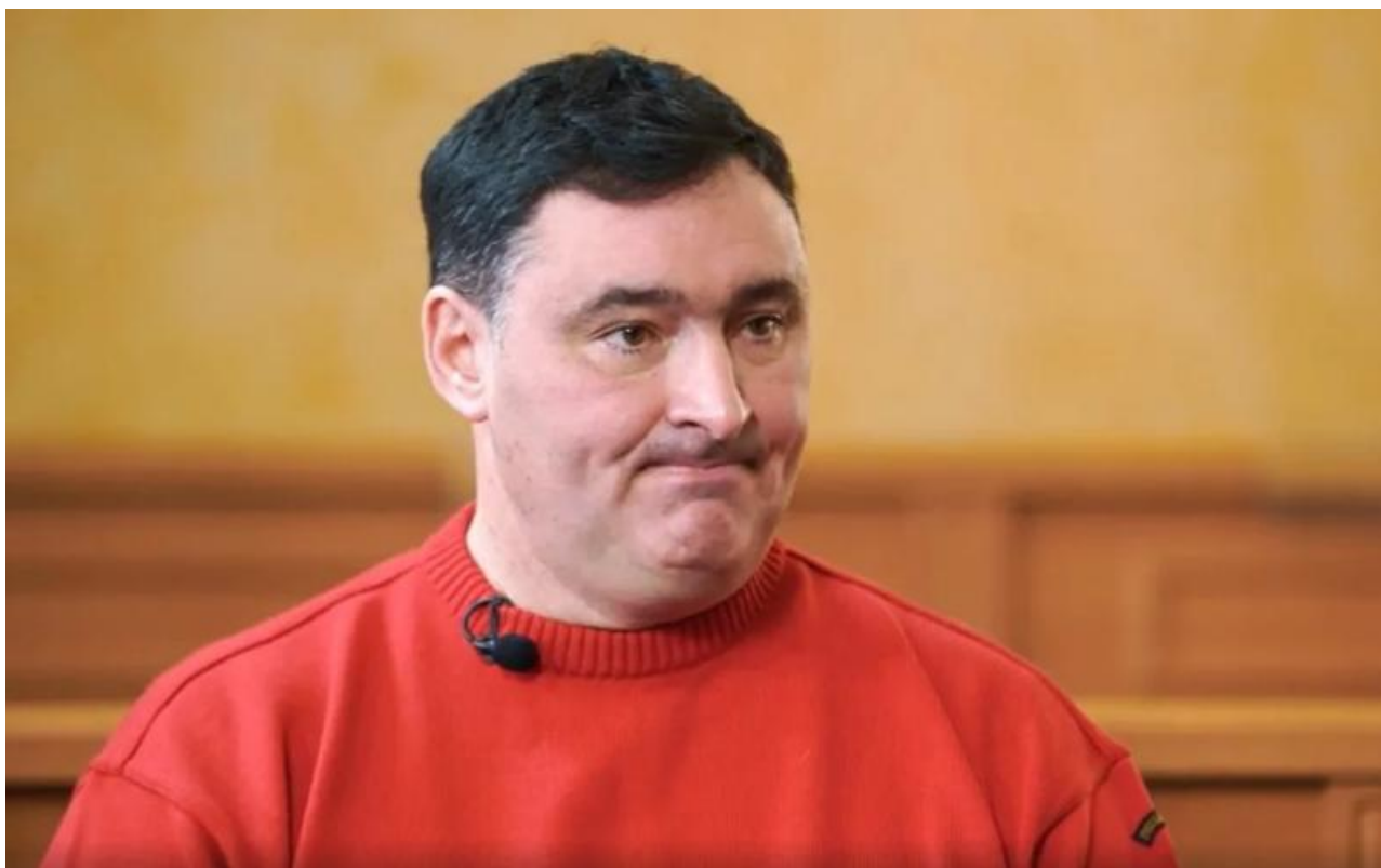
Фото портала ИрСити и пресс-службы администрации Иркутска

Автор: Георгий Булычев © Babr24.com ОБЩЕСТВО, ПОЛИТИКА, ИРКУТСК 👁 36141 29.12.2023, 12:29 📌 238 URL: https://babr24.com/?IDE=255013 Bytes: 4315 / 3677 Версия для печати Скачать PDF