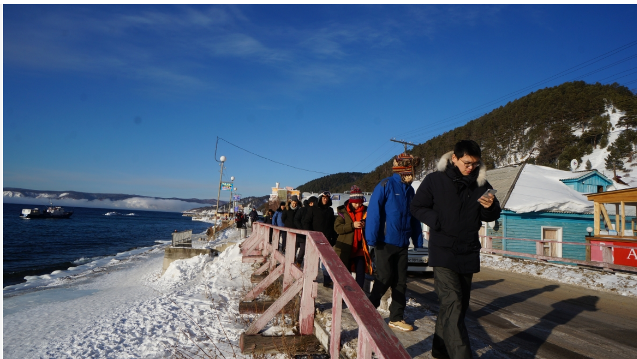
Автор: Ольга Новикова Фото из альбома "Байкал - китайские туристы" © Фотобанк "RuBabr"

Но прежде чем всю продолжать развитие туризма, необходимо принять эффективные меры по очищению Байкала от вредных веществ и промышленных загрязнений. Подобные действия должны стать приоритетом, а не откладываться на второй план из-за желания заработать деньги.