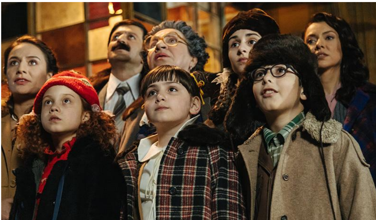
На съёмках фильма «Манюня: Новогодние приключения»