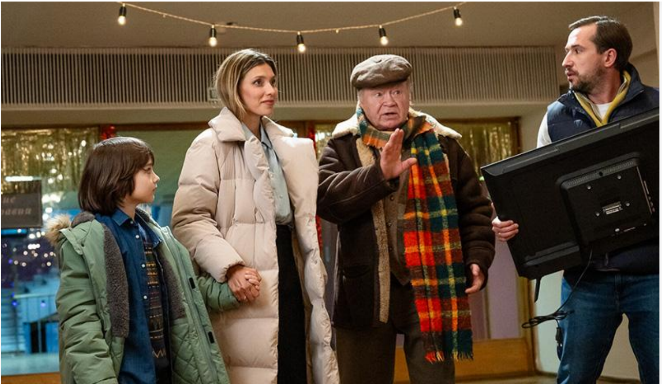
На съёмках фильма «Ёлки 10»

В активе последних – 74,6 миллиона на 2 193 экранах с потерей в сборах 36 %. Годом ранее потери «Ёлок 9» на втором уикенде составили всего 17,6 %, а общая касса была на 55 миллионов больше, чем сегодня у десятой части франшизы.