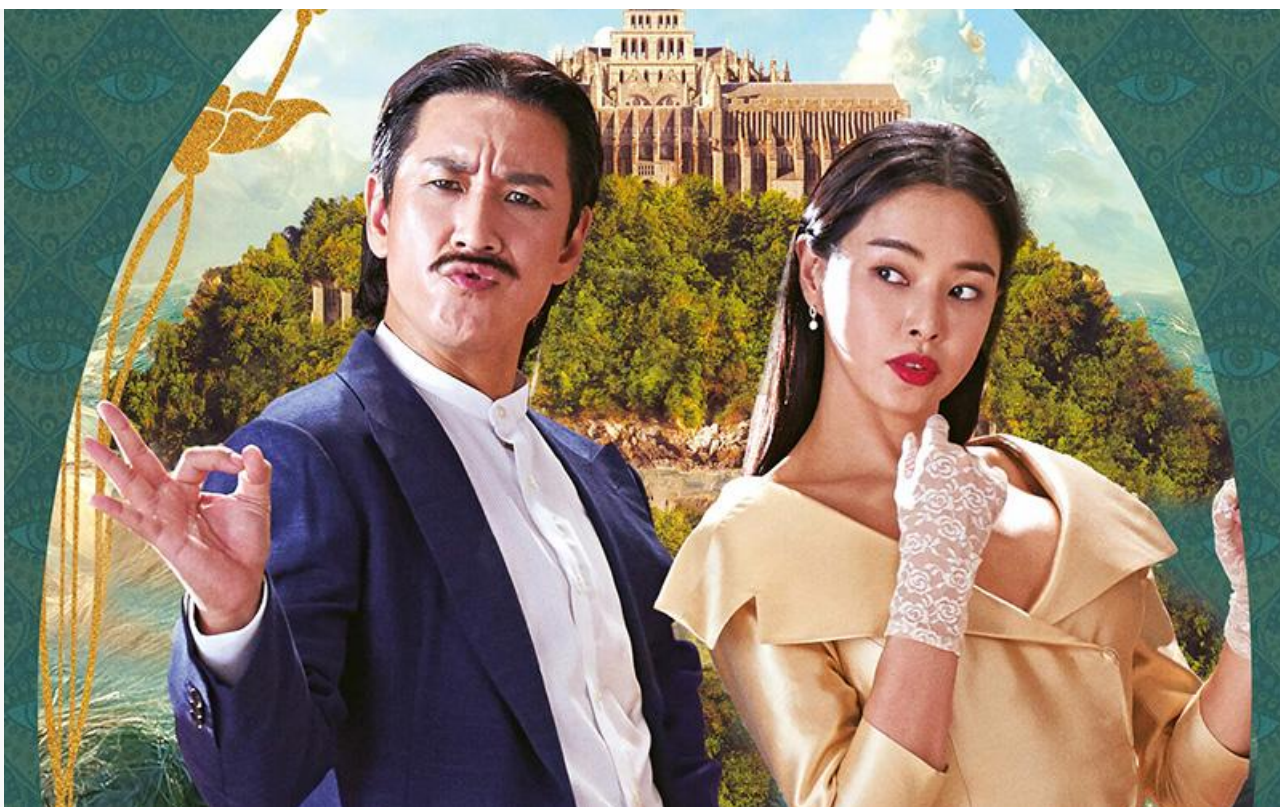
Постер к фильму «Мистер и Миссис Икс»