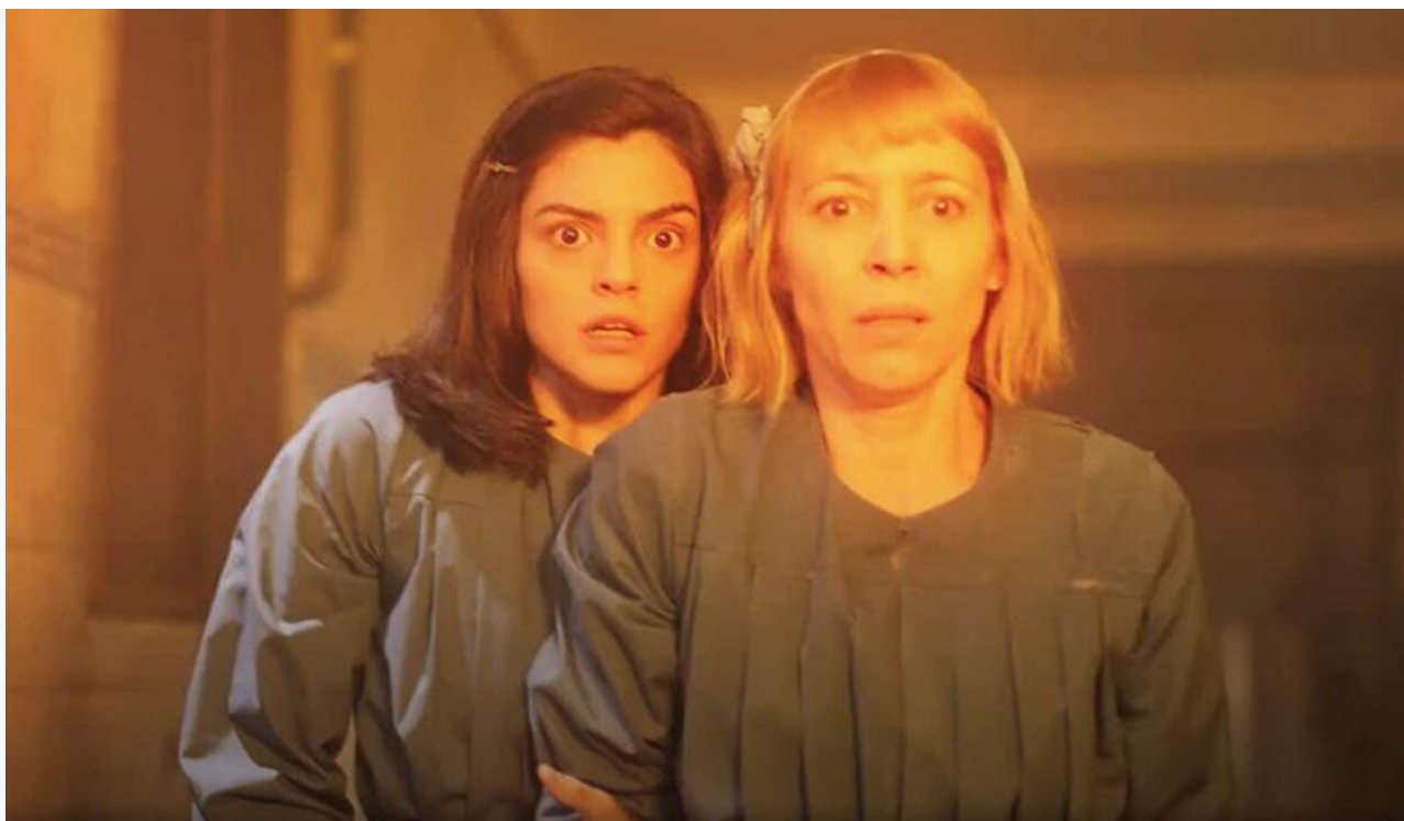
Кадр из фильма «Заклятие. Зарождение зла»