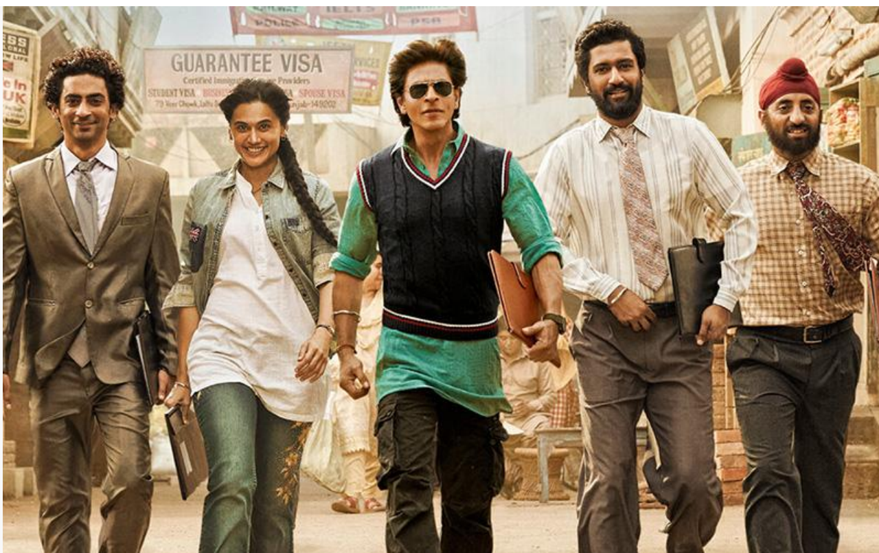
Постер к фильму «Дунки»