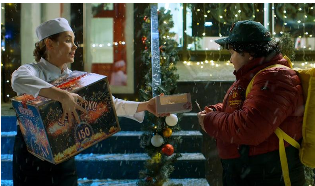
Кадр из фильма «Новогодний шеф»

Ещё три премьеры уикенда уверенно вошли в топовую десятку. Это боевик Тома Венсана «Моя жена – киллер» , ставший седьмым с прибылью 17,4 миллиона, и два «ужастика»: религиозный хоррор Тамаэ Гаратеги «Заклятие. Зарождение зла» (11,2 миллиона и восьмое место) и скандинавское фэнтези Магнуса Мартенса «Гномы. Новогодний беспредел» (10 миллионов и девятое место).