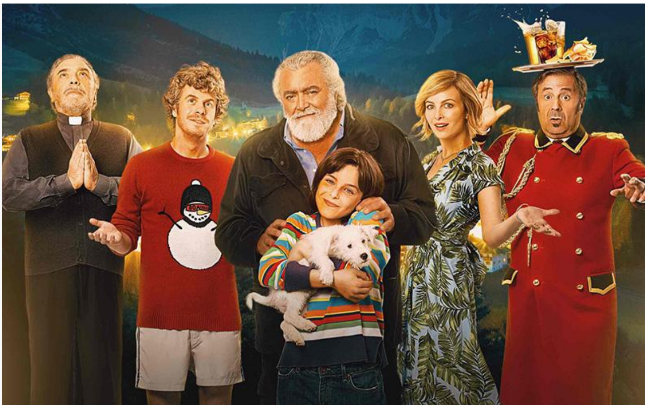
Постер к фильму «Рождество в подарок»