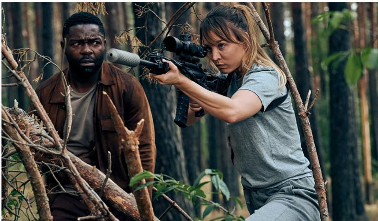
Кадр из фильма «Моя жена – киллер»

1 445 экранах всего 4 миллиона рублей. Средняя посещаемость третьей части «честно-разводной» франшизы за первые четыре дня проката составила 8,3 зрителя за сеанс.