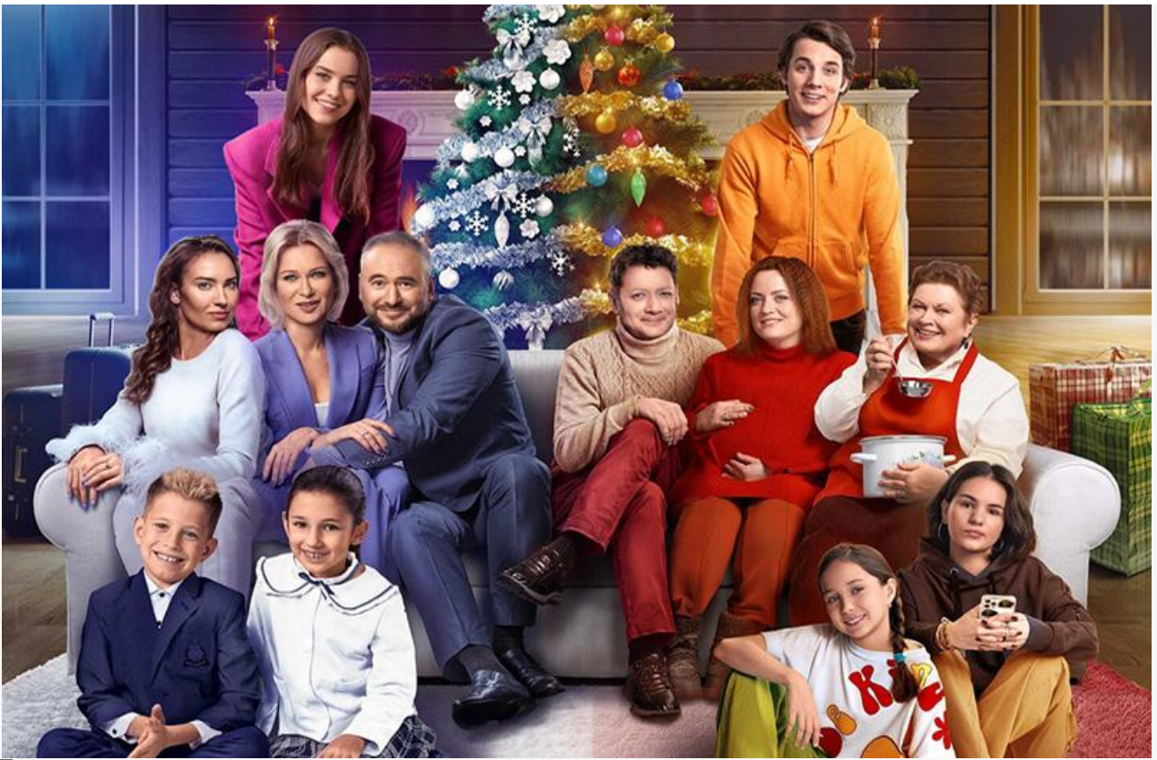
Постер к фильму «Новогодний ол инклюзив»