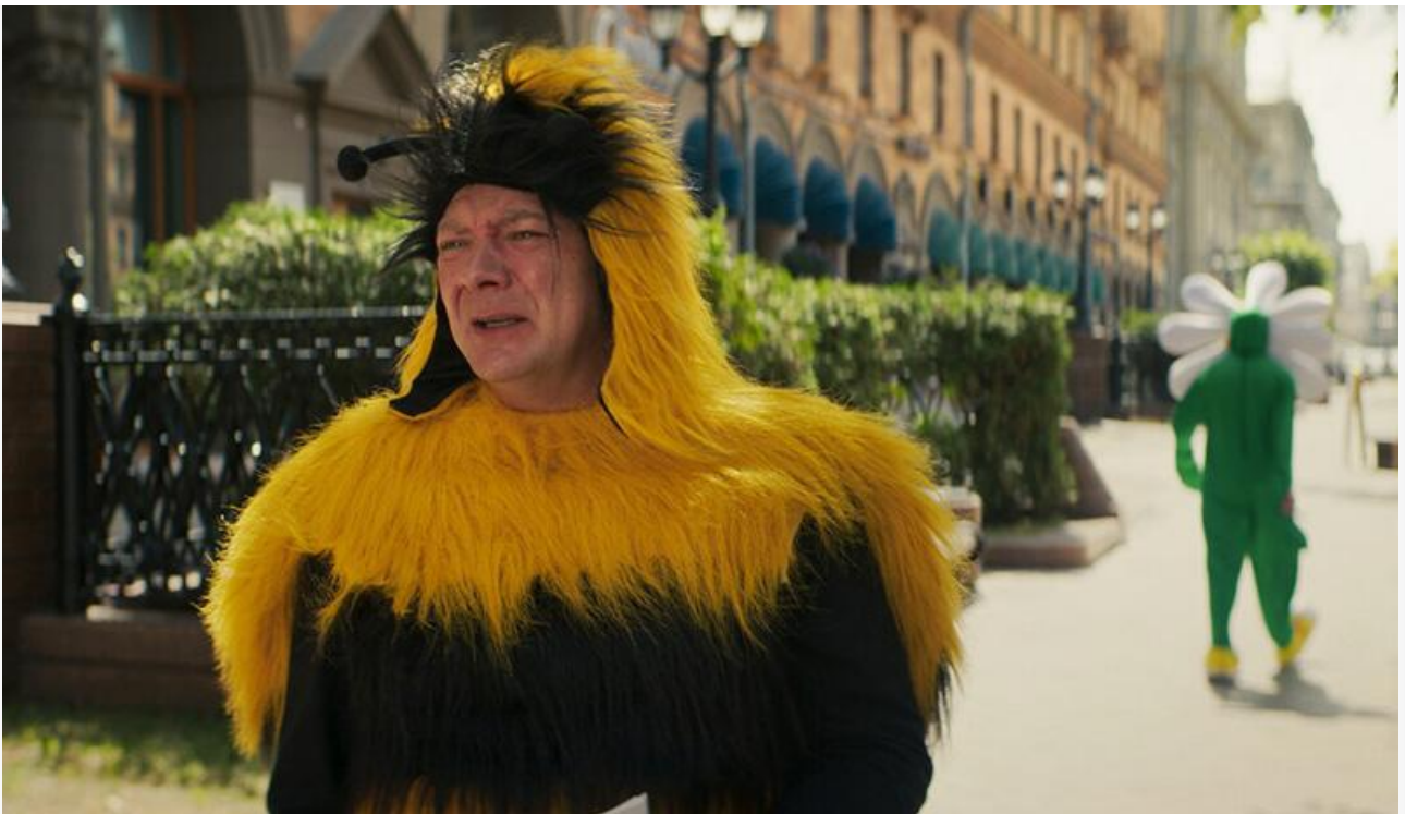
Кадр из фильма «Вредная привычка»

Любителей фестивального кино ждёт в кинотеатрах номинант на «Золотую пальмовую ветвь» Каннского кинофестиваля уходящего года – итало-французская драмеди Нанни Моретти «Великая магия» (18+).