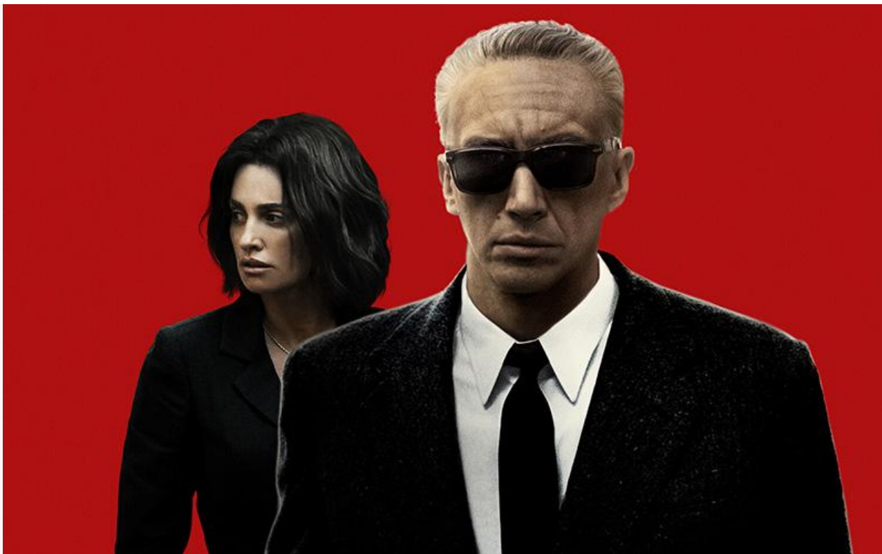
Постер к фильму «Феррари»

Главные роли основателя автомобилестроительной компании и гоночной команды своего имени Энцо Феррари и его супруги Лауры сыграли Адам Драйвер и Пенелопа Крус. Мировая премьера потенциального блокбастера состоялась 31 августа в рамках основной программы Венецианского кинофестиваля.