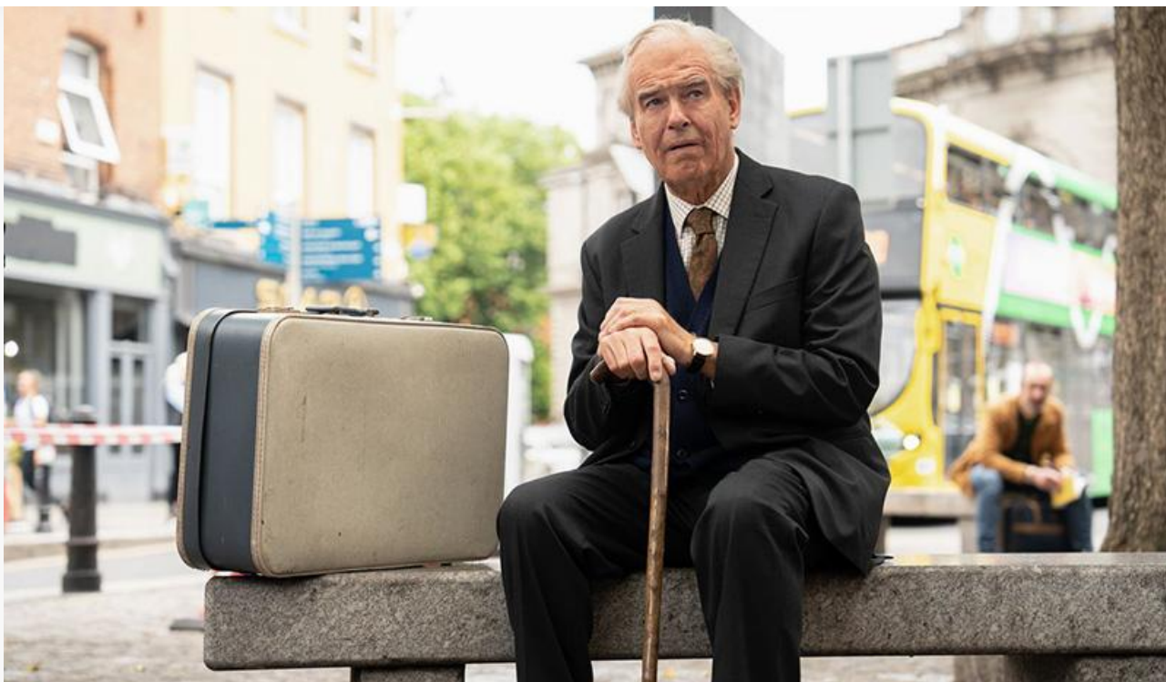
Кадр из фильма «Последний стрелок»

стрелок» (18+) с Пирсом Броснаном в роли ветерана войны Арти Кроуфорда, южнокорейская комедийная мелодрама Ли Вон-сока «Мистер и Миссис Икс» (18+), итальянская комедия Франческо Патьерно «Рождество в подарок» , индийская драмеди Раджжумара Хирани «Дунки» и отечественный мультфильм от студии Great Frame «Шмяк. Волшебная лавка Есении» .