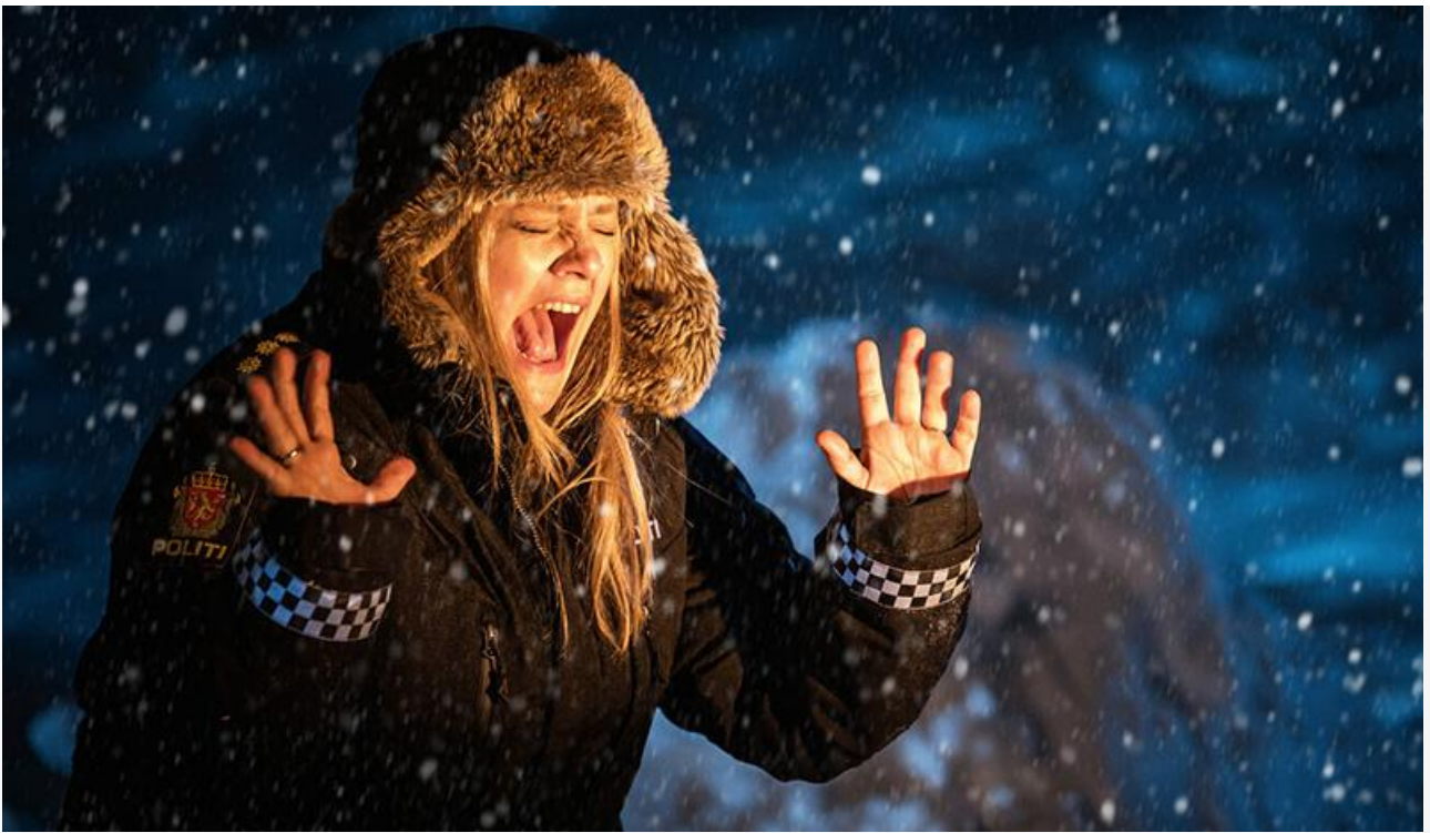
Кадр из фильма «Гномы. Новогодний беспредел»

Бронзовый призёр прошлых выходных – мультфильм Хаяо Миядзаки «Мальчик и птица» – потерял в сборах 34 % и с суммой 68,2 миллиона опустился на четвёртое место, пропустив вперёд «Манюню» Марутяна.