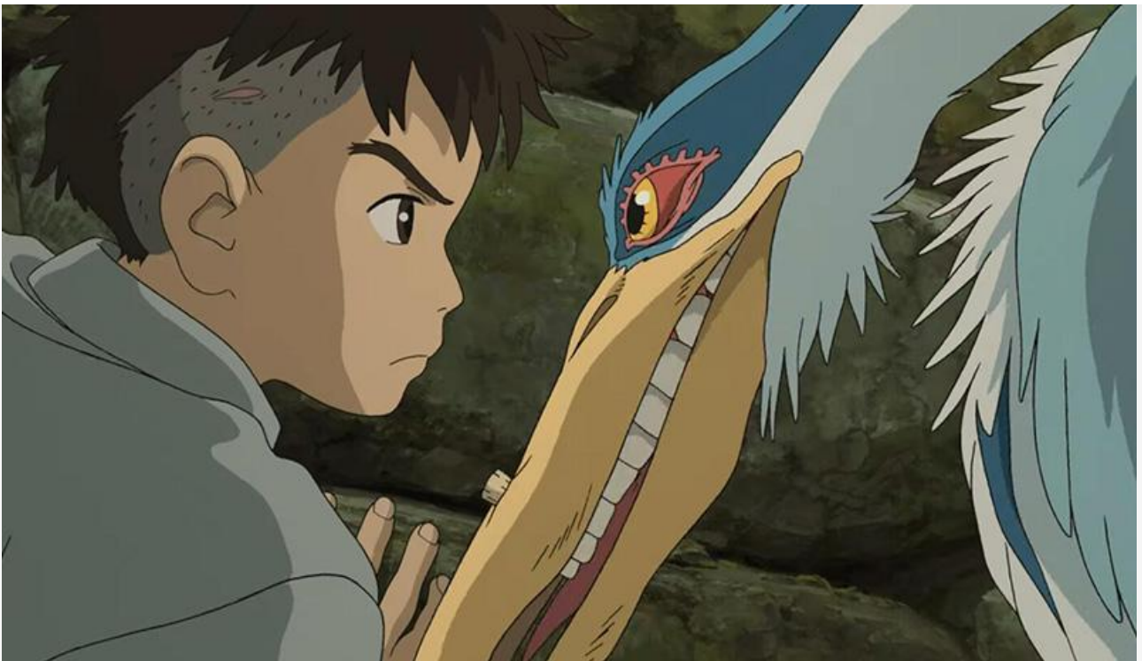
Кадр из фильма «Мальчик и птица»

Покинули десятку лидеров «Хоккейные папы», «Баба Мороз и тайна Нового года», «Кто не спрятался», «Немая ярость» и «Паранормальные явления: Другое измерение».