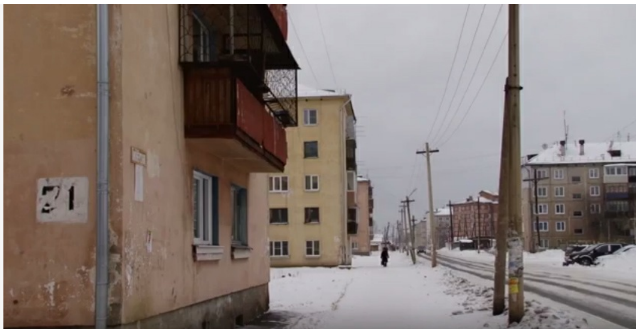
Фото из альбома "Иркутская область. Вихоревка" © Фотобанк "RuBabr"

В действительности братчане, конечно, не хотят присоединяться к району или еще куда-то (хотя об этом открыто уже пишут жители Осиновки, Сухого, просто горожане). Суть – в качественном управлении