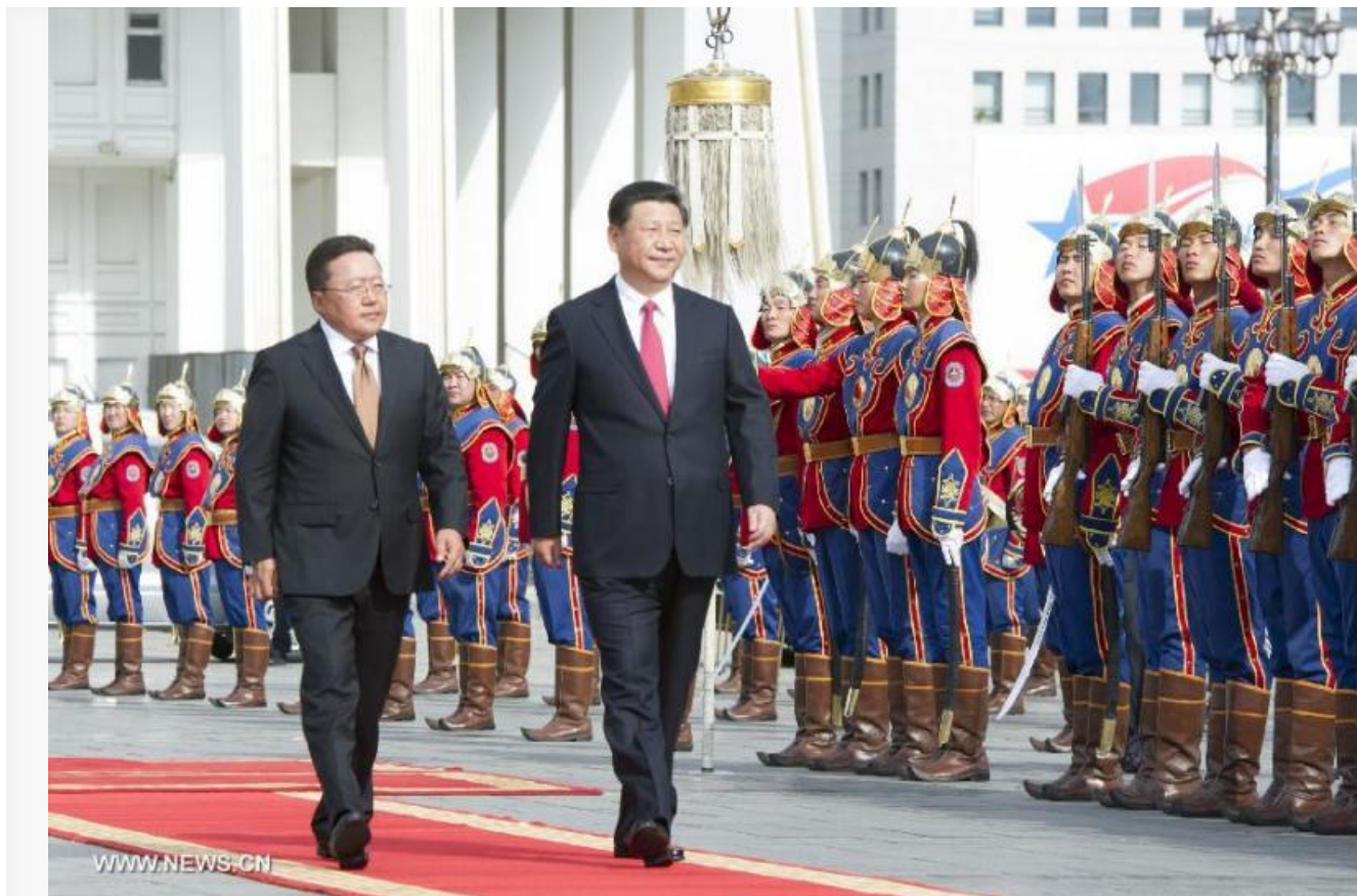
Си Цзиньпин в Монголии в 2014 году

Правительство Монголии придало большое значение визиту Си Цзиньпина в страну в 2014 году и надеется на его повторение спустя десять лет. Уже в конце ноября 2023 года состоялась встреча между членом Постоянного комитета Политбюро Коммунистической партии Китая Цай Ци и генеральным секретарем Монгольской народной партии А. Дашзегве для обсуждения предстоящей поездки китайского лидера в Монголию. Но Китай пока не дал более точной информации по этому визиту.