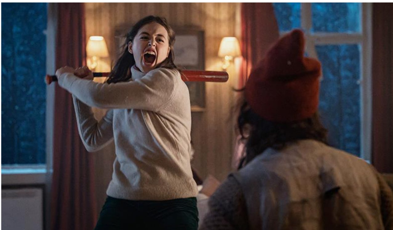
Кадр из фильма «Гномы. Новогодний беспредел»

аргентинский религиозный хоррор Тамаэ Гаратеги «Заклятие. Зарождение зла» (18+).