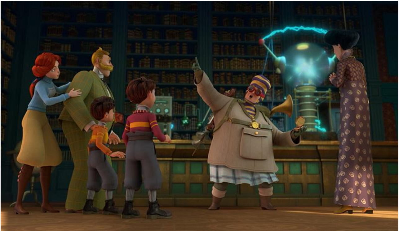
Кадр из фильма «Кентервильское привидение»