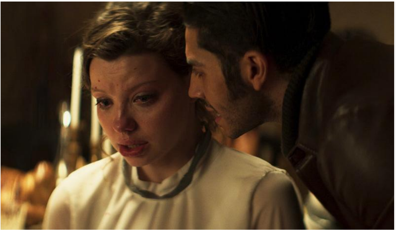
Кадр из фильма «Кто не спрятался...»