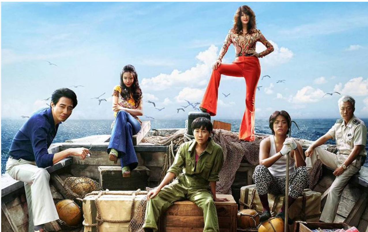
Постер к фильму «Контрабандистки»

Впервые на больших экранах в России будет показана драма Джима Джармуша « Более странно, чем в раю » (18+), в 1984 году получившая приз «Золотая камера» Каннского кинофестиваля за лучший режиссёрский дебют.