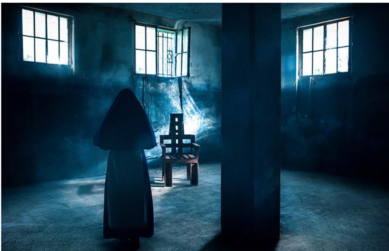
Постер к фильму «Заклятие. Зарождение зла»

Также на экраны выходят южнокорейский криминальный боевик Рю Сын-вана «Контрабандистки» (18+), американский боевик Арта Камачо «Костолом» (18+) с Дермотом Малруни, южнокорейский мультфильм Ом