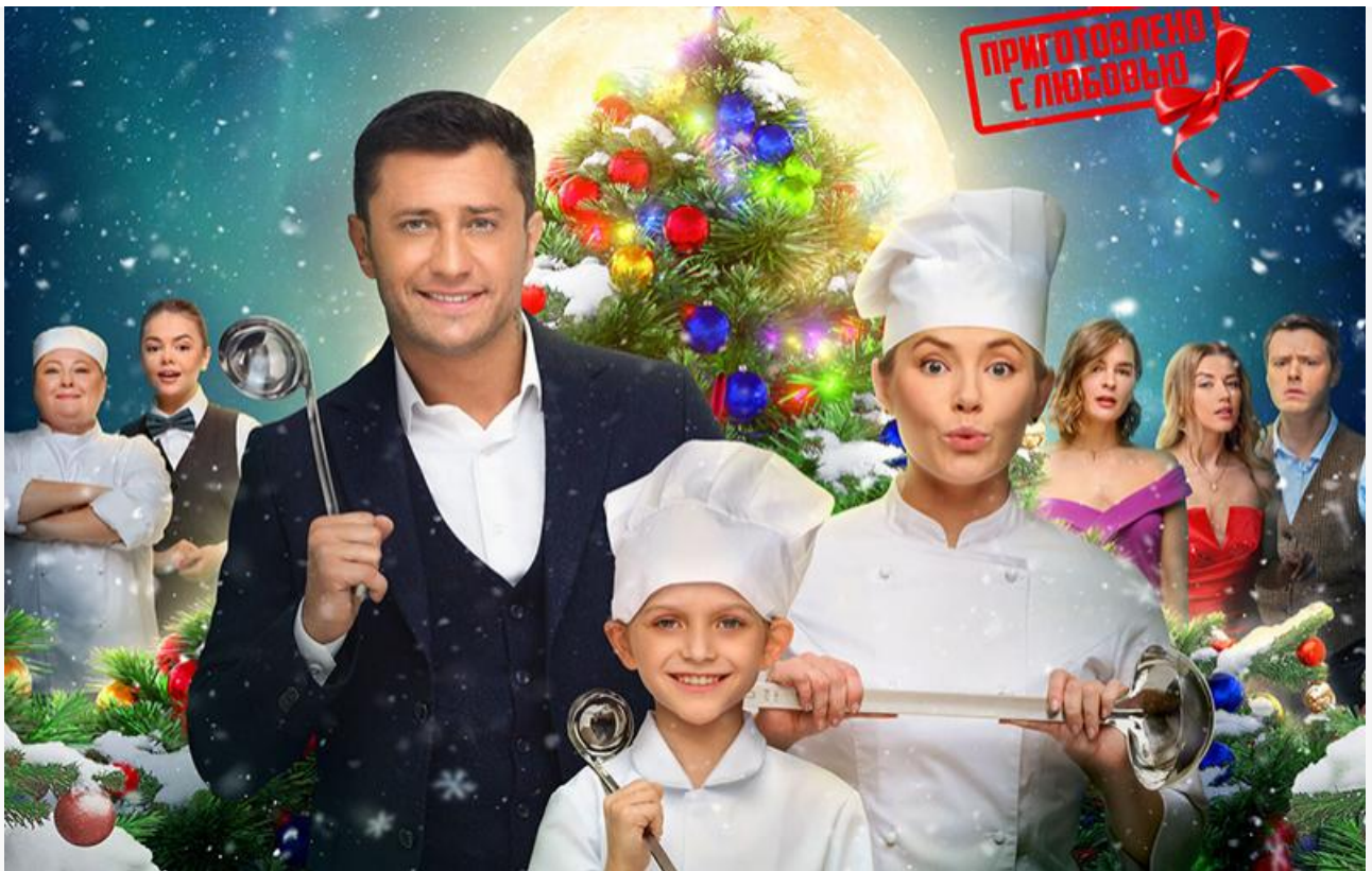
Постер к фильму «Новогодний шеф»