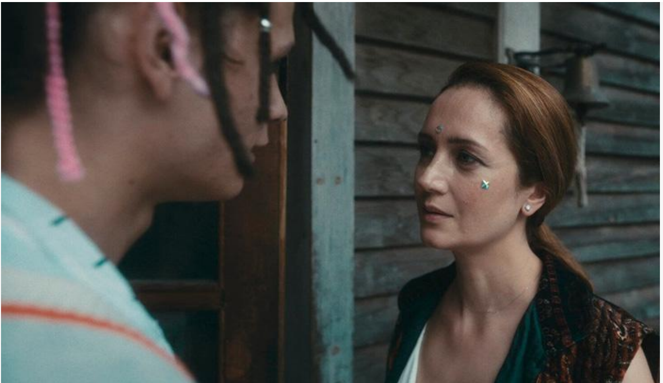
Кадр из фильма «Лунатики»

Общая касса топ-20 фильмов уикенда составила 494 миллиона рублей. Это на 11,48 % больше, чем в предыдущие выходные .