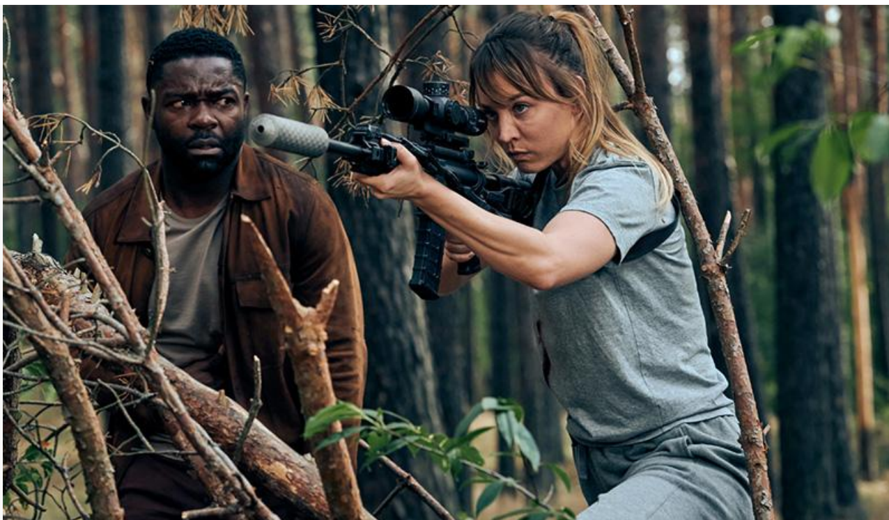
Кадр из фильма «Моя жена – киллер»