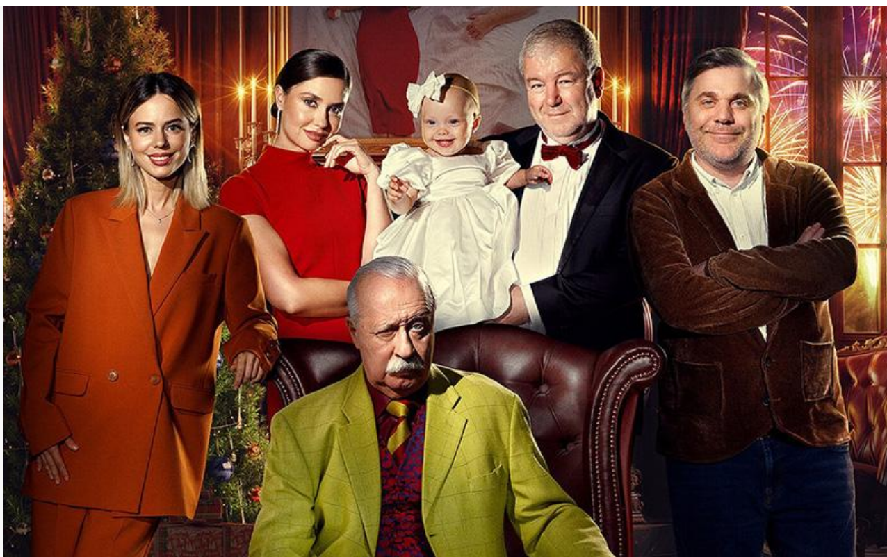
Постер к фильму «Честный развод. Бенефис»