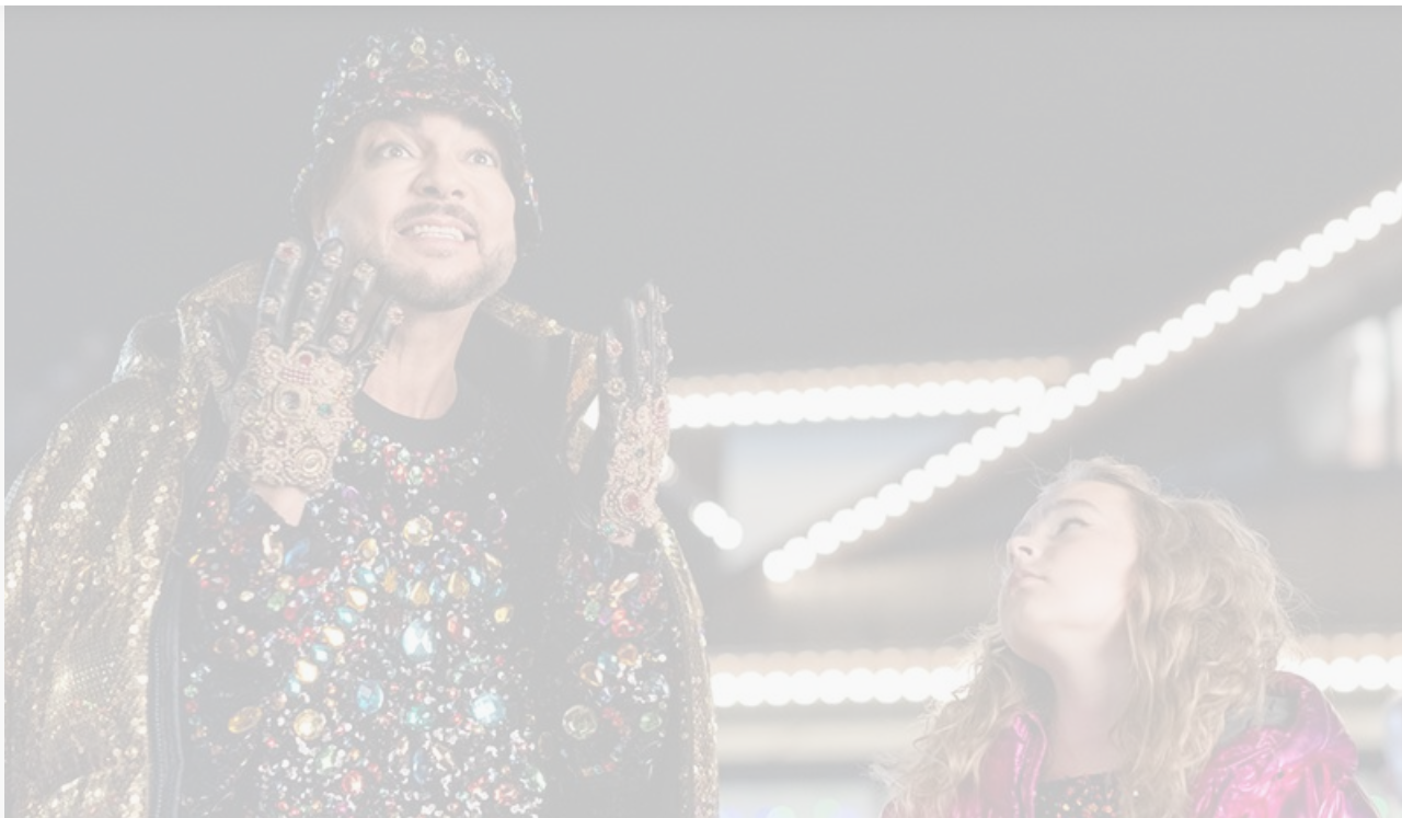
На съёмках фильма «Ёлки 10»

Отметим, что «сарафан» у «Ёлок» традиционно ужасен: рейтинг на «Кинопоиске» составляет всего 4,4 балла. Рейтинг «Тёщи» при этом – 6,1.