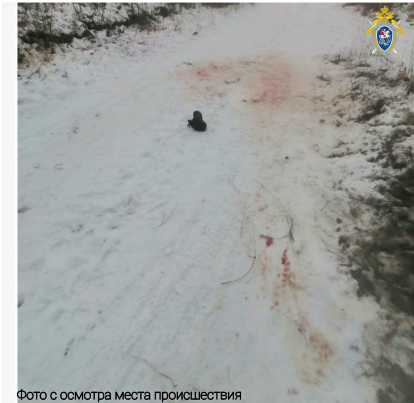
Фото с осмотра места происшествия

Так, они загрызли человека 17 ноября в Усольском районе. И жертве даже нечего вменить в плане несоблюдения мер безопасности. Это был пусть и пожилой, но обычный гражданин, не какой-нибудь пьяный маргинал (хотя и в этом случае ЧП было бы вопиющее, конечно). С собой у погибшего имелись документы, одет был хорошо, на дворе стоял белый день. Ангарчанина именно загрызли: причиной смерти названа кровопотеря от многочисленных укусов.