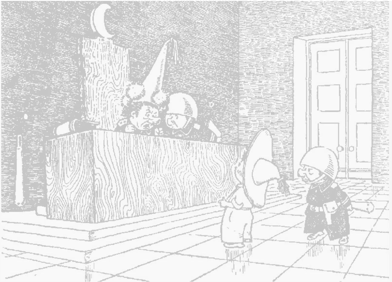
Иллюстрация Генриха Валька к роману Николая Носова «Незнайка на Луне»

Полиция для того и существует, чтобы бороться с преступниками. Если же преступники перестанут совершать преступления, то полиция станет не нужна, полицейские потеряют свои доходы, сделаются безработными, и существующая в нашем обществе гармония будет нарушена. Если вы этого не поймёте, то за свои вредные мысли сами в конце концов угодите в полицейское управление, и там с вами разделаются своими средствами.