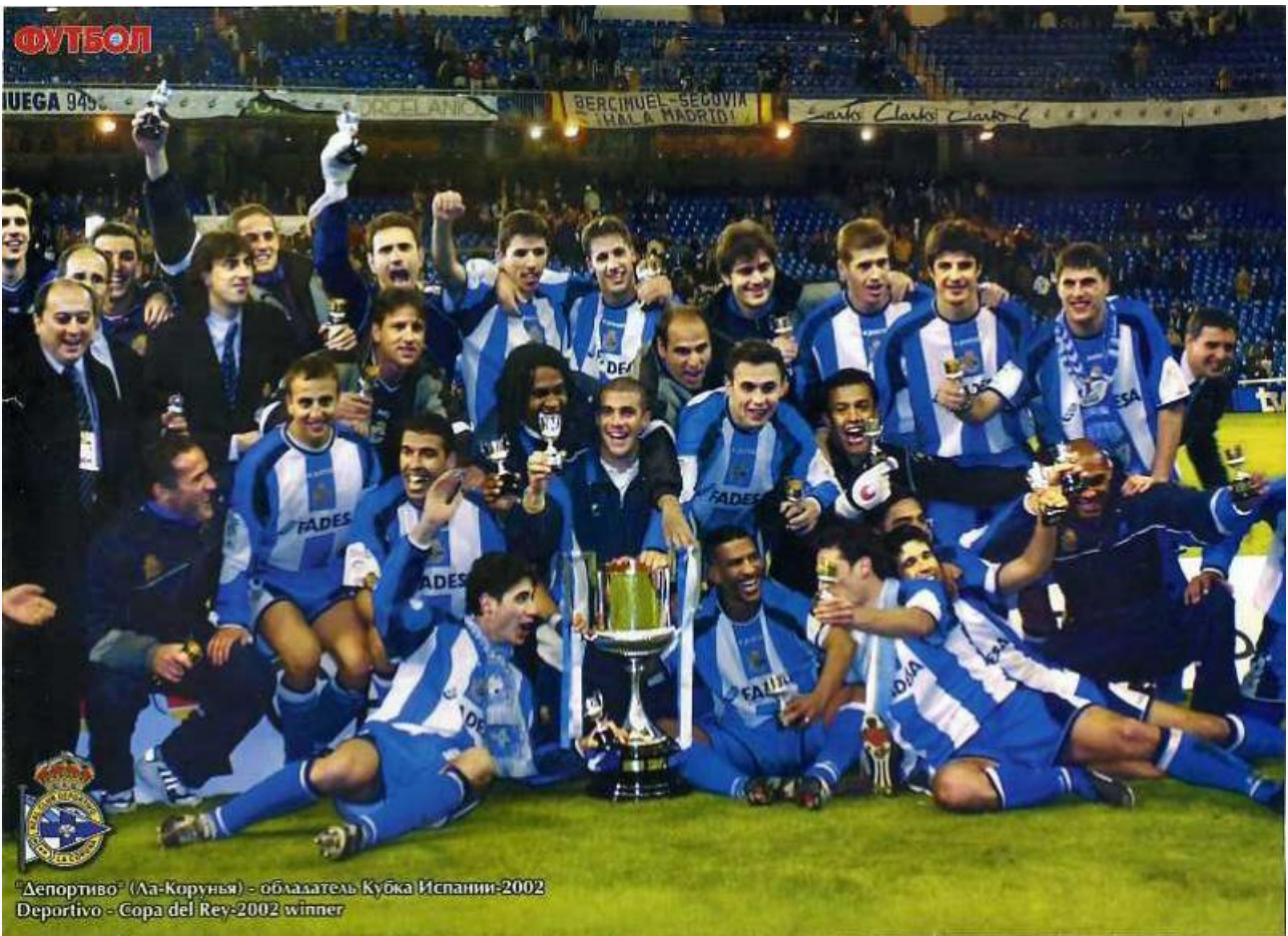
«Депортиво» Ла-Корунья обладатель Кубка Испании 2002