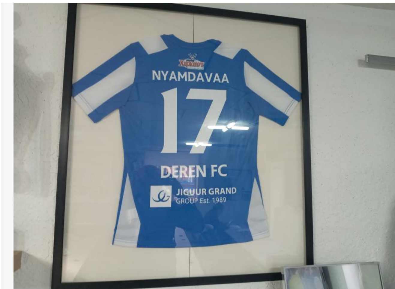
Основная форма ФК «Дэрэн». Ничего не напоминает?

Навскидку я могу назвать десяток клубов, которые сейчас ведут реальную работу с детьми. И это для современных монгольских реалий совсем неплохо. Однако, по моему мнению, флагманом развития детско-юношеского футбола в стране является именно «Дэрэн». Это объективный факт. Ведь у большинства школ нет возможности полноценно заниматься футболом зимой. А мы, например, имеем небольшой манеж с искусственным травяным покрытием.