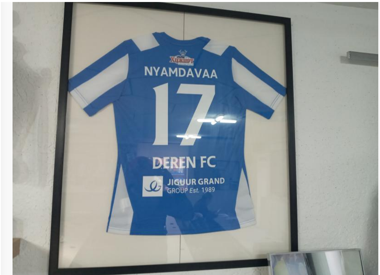
Основная форма ФК «Дэрэн». Ничего не напоминает?

Навскидку я могу назвать десяток клубов, которые сейчас ведут реальную работу с детьми. И это для современных монгольских реалий совсем неплохо. Однако, по моему мнению, флагманом развития детско-юношеского футбола в стране является именно «Дэрэн». Это объективный факт. Ведь у большинства школ нет возможности полноценно заниматься футболом зимой. А мы, например, имеем небольшой манеж с искусственным травяным покрытием.