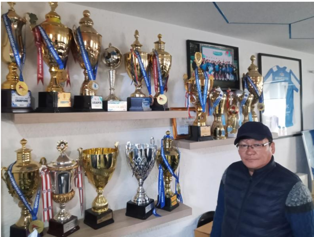
Зал славы академии «Дэрэн»