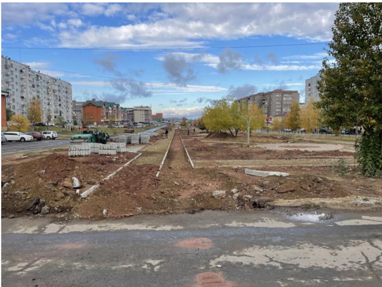
Так выглядела улица 30 сентября, в тот день, когда изначально должны были закончить

Но апгрейда этого, увы, не случилось, срок сдачи объекта сдвинули ещё до 9 ноября. И вот почему. Если взглянуть на послужной список компании, что сумела урвать этот лакомый кусочек, то в благоустройство верится с трудом. Напомним, цена контракта составила 30 миллионов рублей. И сейчас из-за того, что одну из центральных улиц Братска никак не могут благоустроить, город остаётся в зоне риска по невыполнению ключевой программы «Комфортная среда». Вероятнее всего, братчан ждёт печальный недодел и помочь с ним не смогут даже суды.