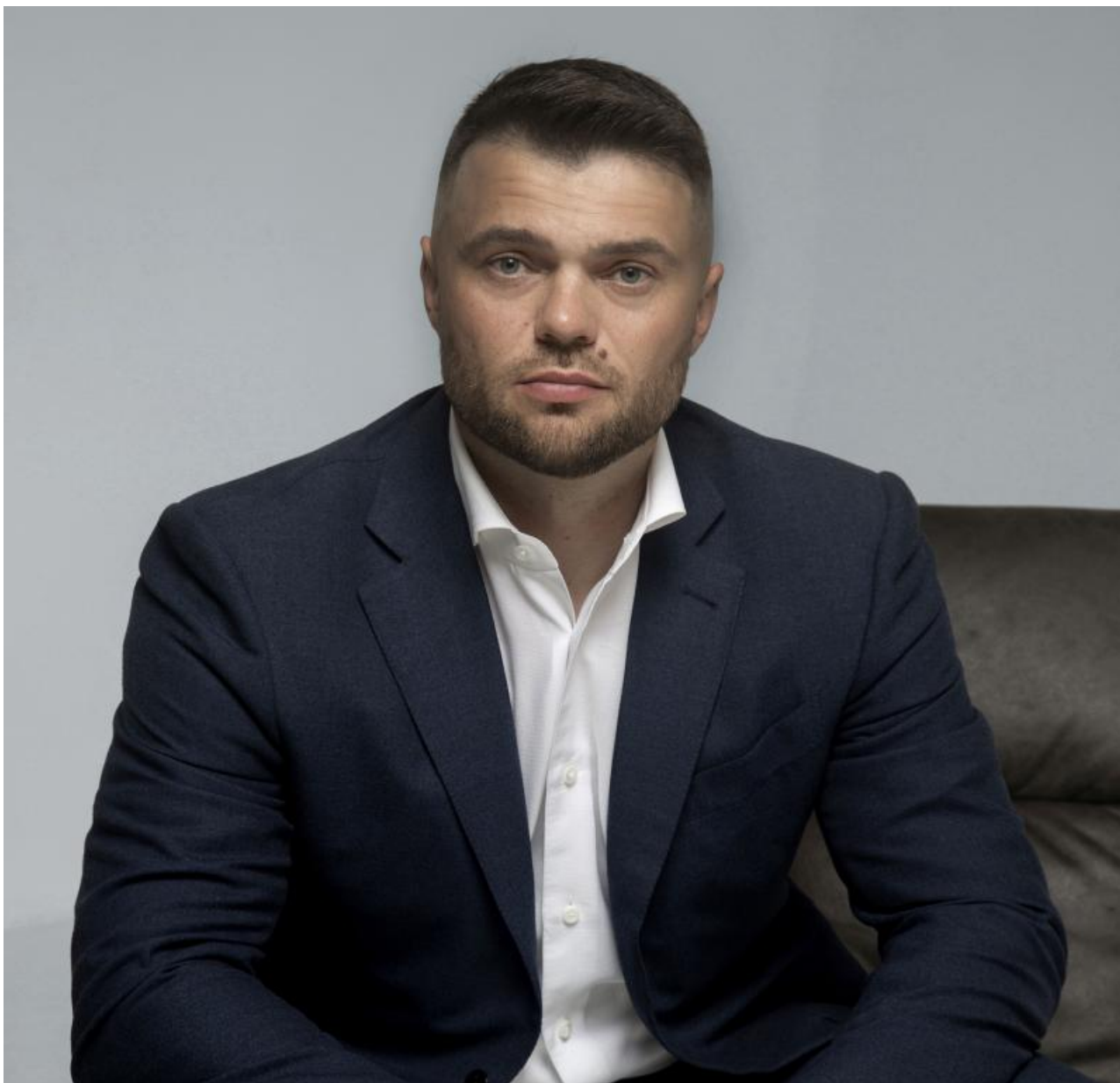
Фото «РТ-НЭО Иркутск»

Автор: Ярослава Грин © Babr24.com ОБЩЕСТВО, ИРКУТСК 👁 10095 03.11.2023, 10:57 🍷 252