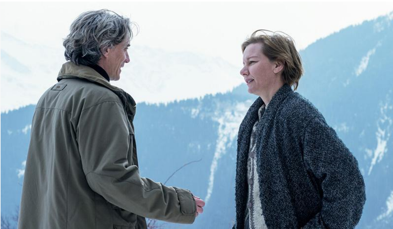
Кадр из фильма «Анатомия падения»

Из старожилов проката сохранили места в топовой десятке «Баба Яга спасает мир» (14,9 миллиона и седьмое место) и «Школа магических зверей: Тайна подземелья» (6,7 миллиона и десятое место). Покинули десятку лучших «Великая ирония», «Выжившая», «Иван Семёнов: Большой поход», «Дурные деньги» и «Неудержимые 4».