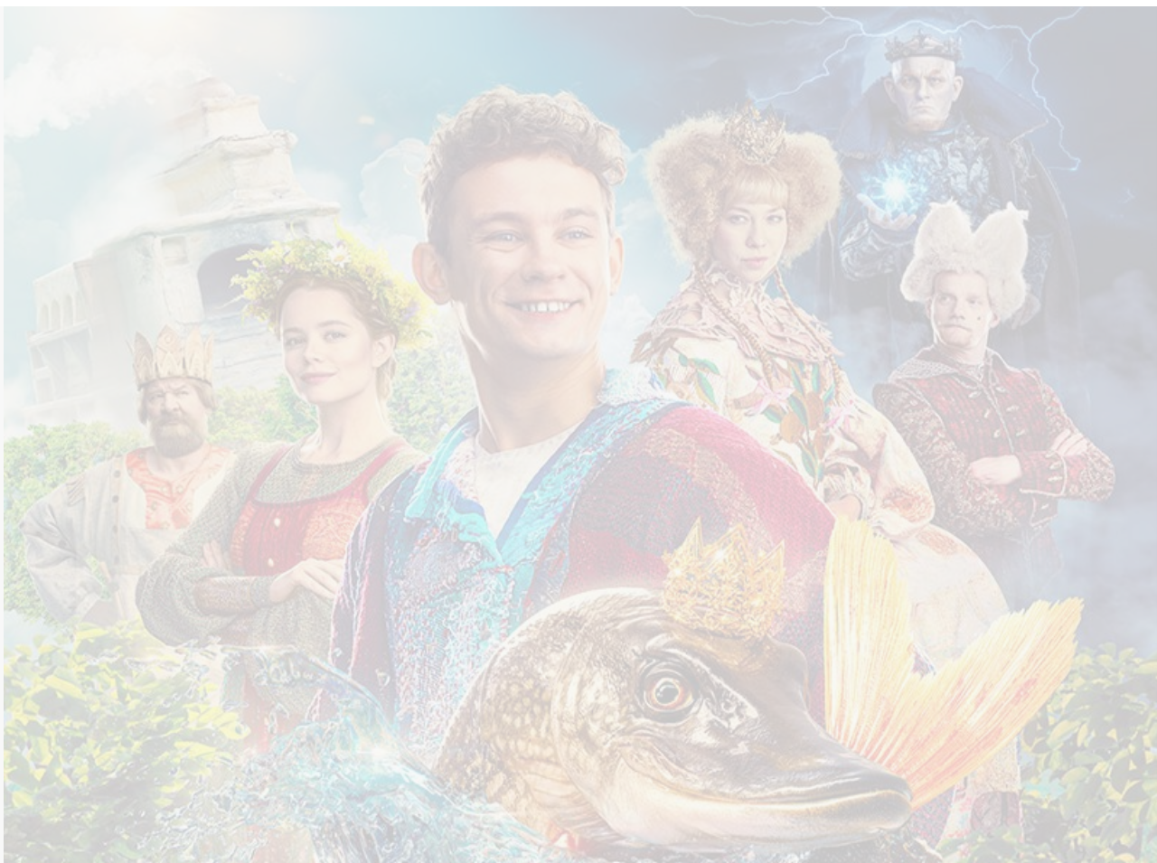
Постер к фильму «По щучьему велению»

Ещё одна громкая премьера предстоящих выходных – «Императрицы» Андрея Кравчука. За «Императриц» играет Пушкинская карта и успех предыдущей исторической ленты режиссёра «Пётр I: Последний царь и первый император». Скорее всего, Юлия Пересильд (Елизавета I), Анна Уколова (Анна Иоанновна), Ольга Лерман (Екатерина II) и компания если и не оккупируют вторую строку чарта, то второй новинкой уикенда станут точно.