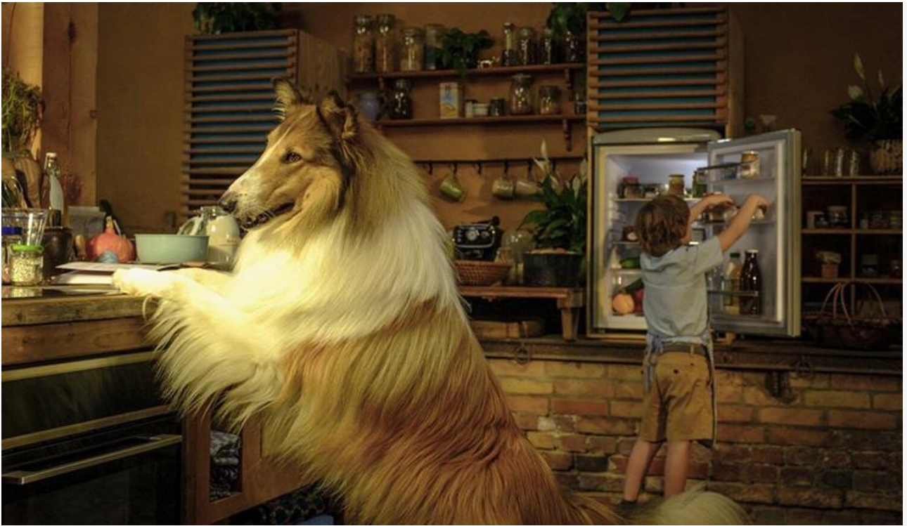
Кадр из фильма «Лесси – лохматый детектив»