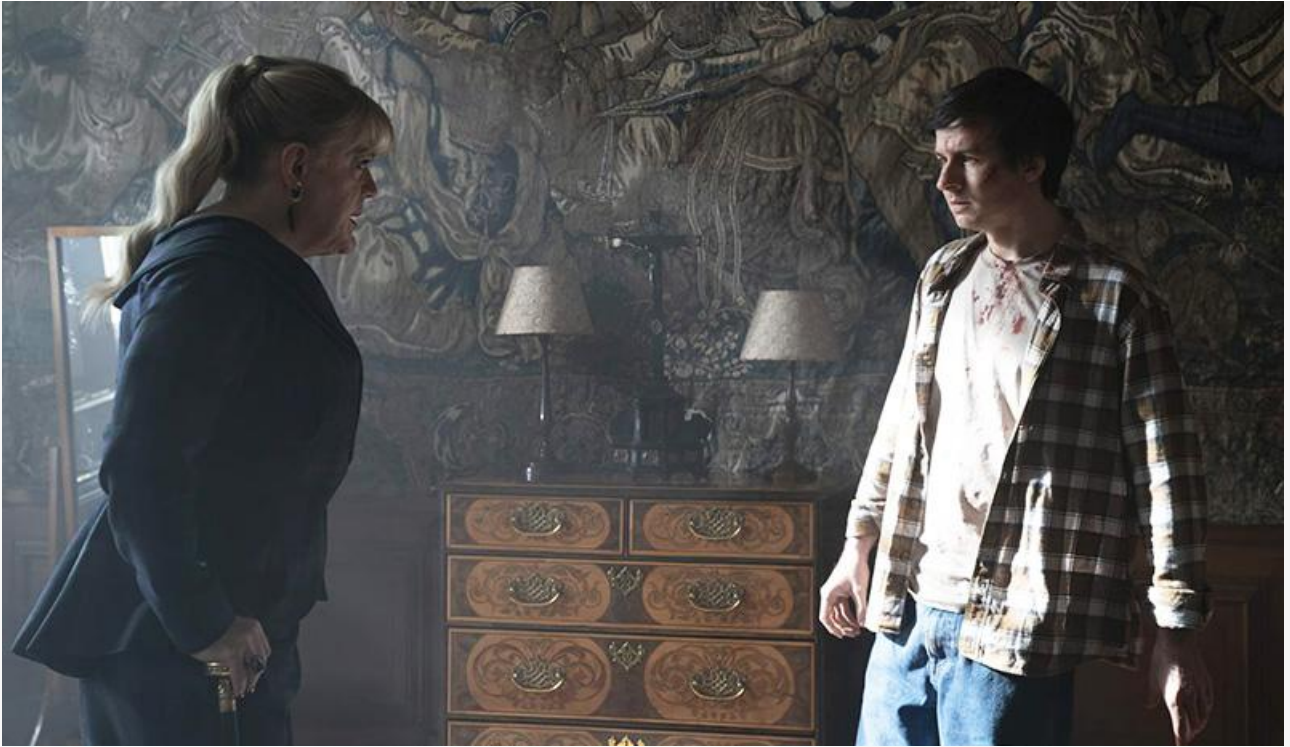
Кадр из фильма «Доктор Джекилл»