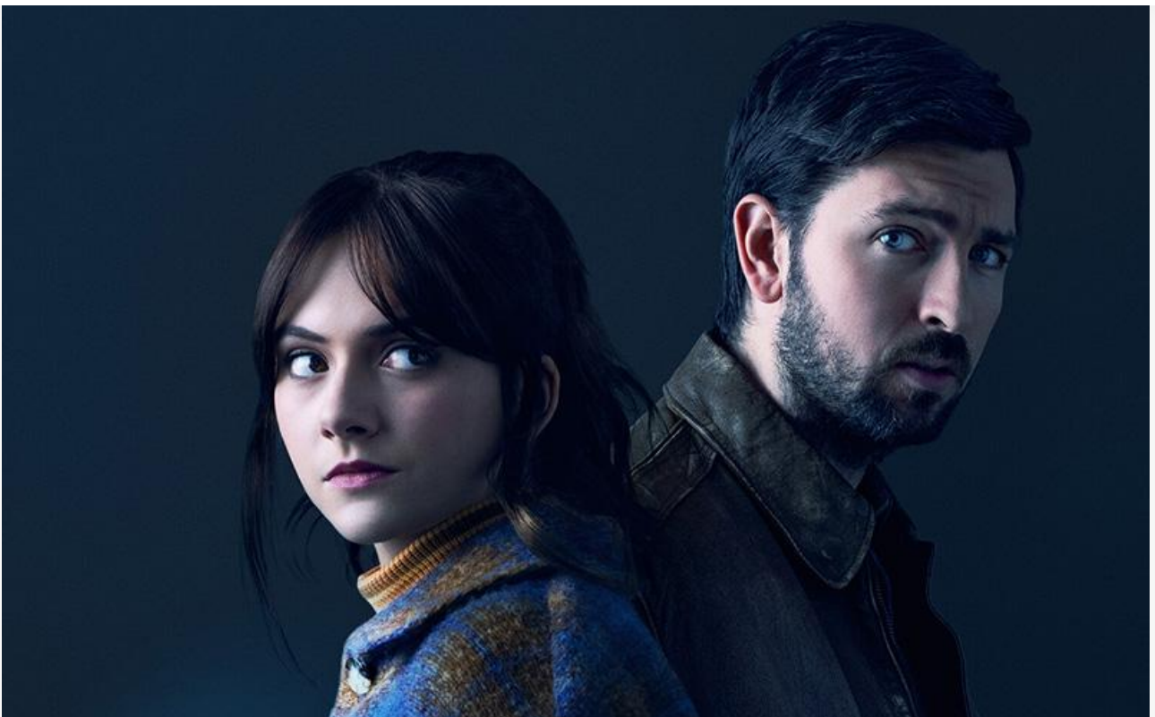
Постер к фильму

Как минимум двум из этих релизов вполне по силам навести шороху в десятке лидеров проката.