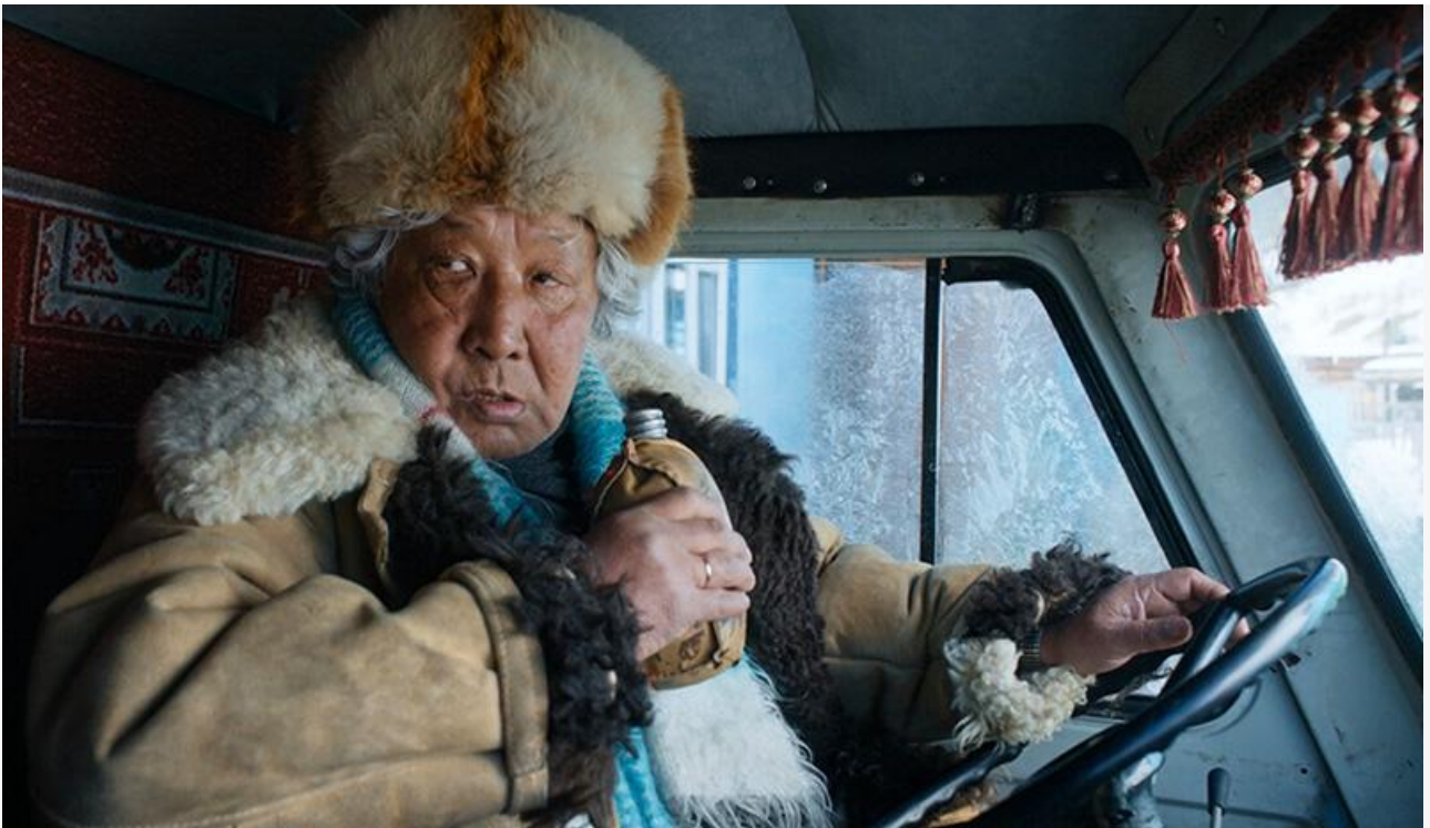
Кадр из фильма «Дух Байкала»