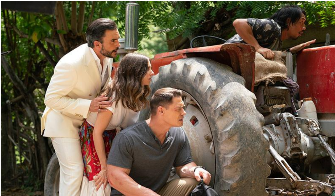
Кадр из фильма «Телохранитель на фрилансе»

Замкнул тройку лидеров с прибылью 35,1 миллиона, собранной на 2 023 экранах, мультфильм «Смешарики снимают кино».