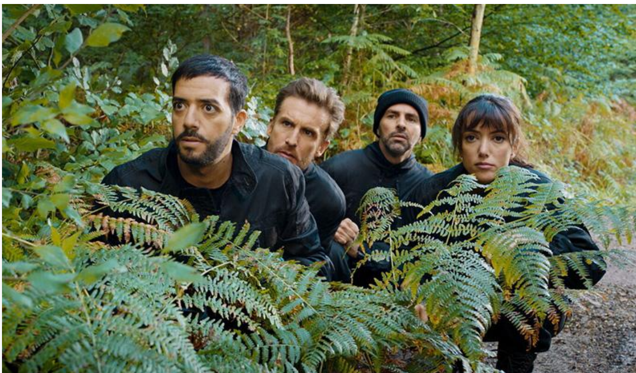
Кадр из фильма «SuperКопы: Миссия „Бабушка“»