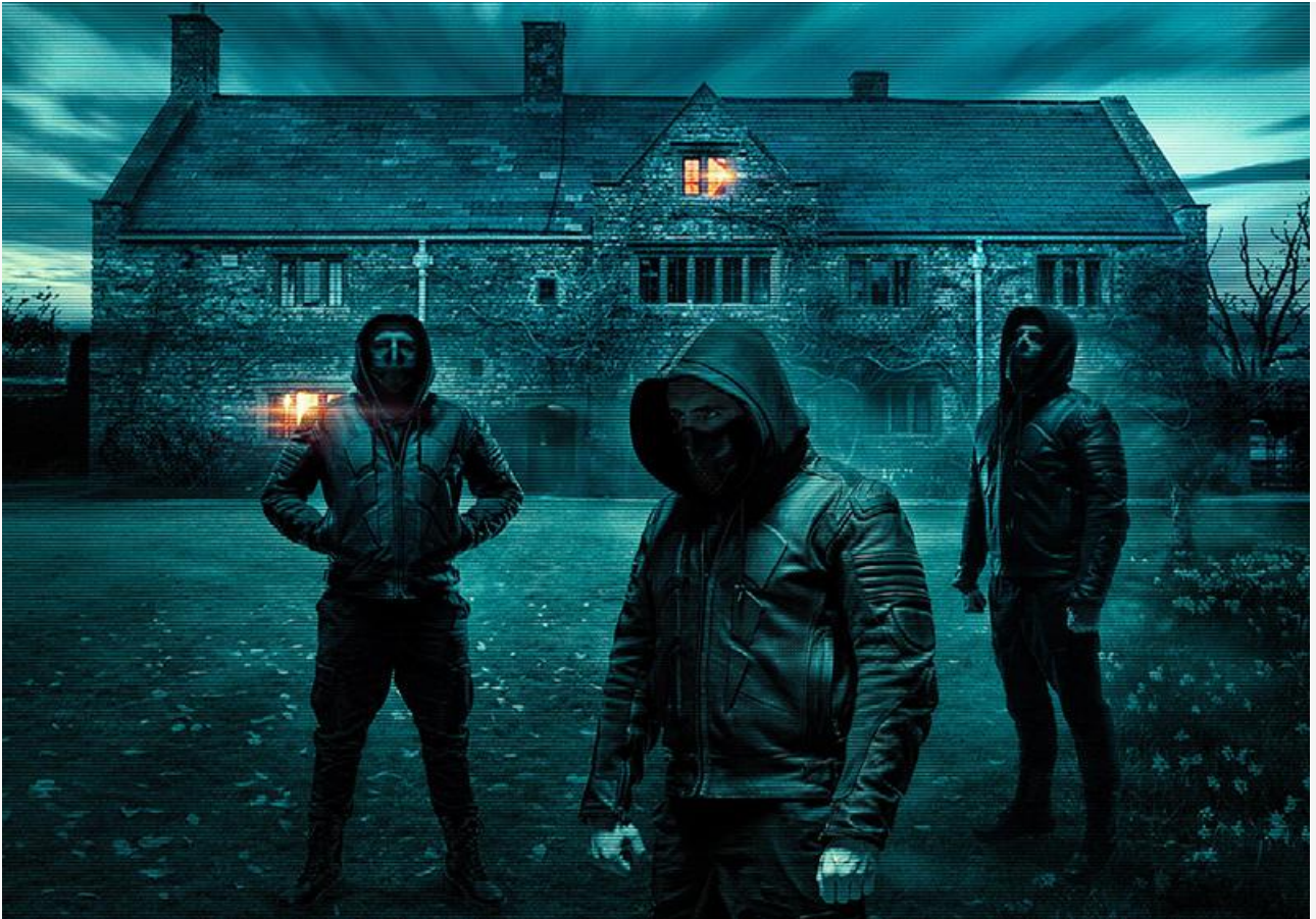
Постер к фильму «Дом-ловушка»