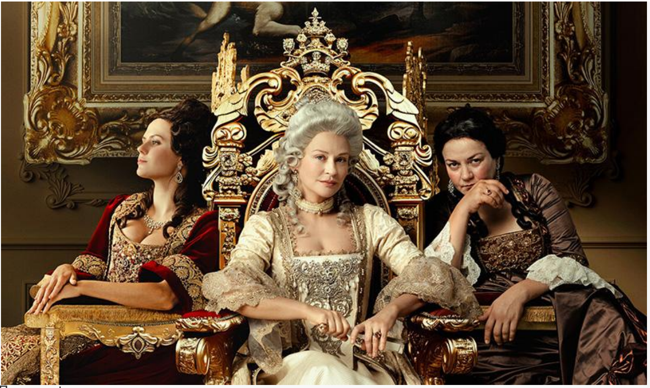
Постер к фильму «Императрицы»

Неплохие шансы на попадание в топ-10 у американо-французского триллера Сюзанны Фогель «Кошки-мышки» (18+) с Эмилией Джонс, Николасом Брауном и Изабеллой Росселлини.