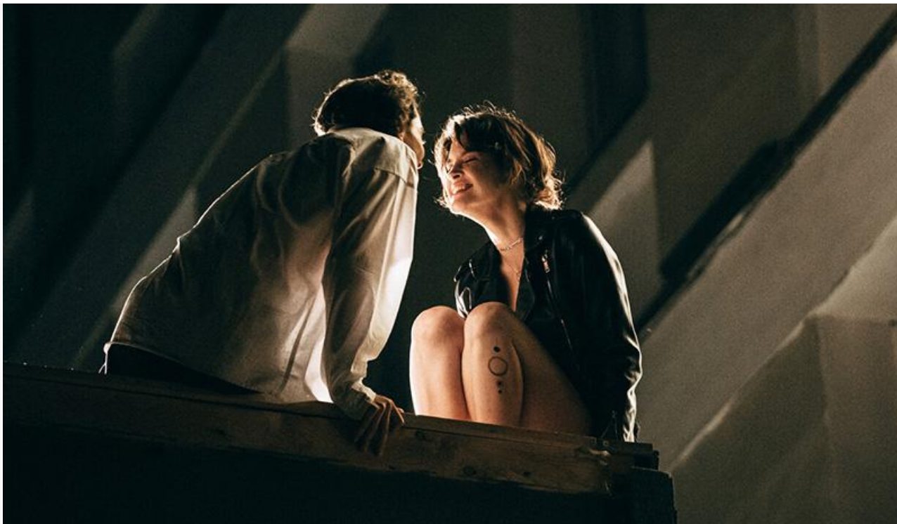
Кадр из фильма «Страсти по Матвею»