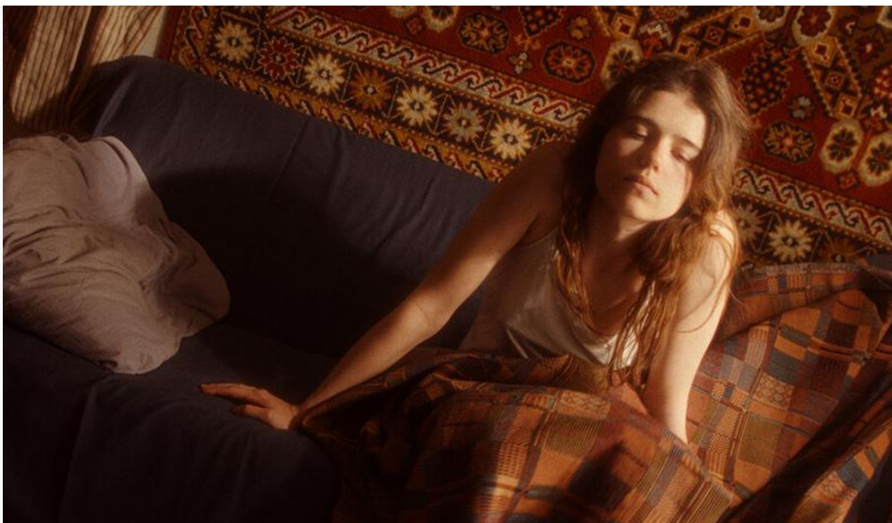
Кадр из фильма «Отпуск в октябре»