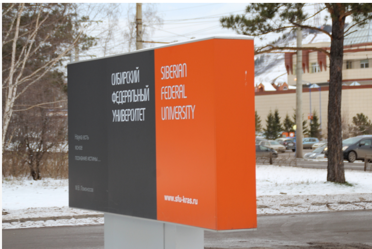
Автор: Алёна Штерн Фото из альбома "Красноярск. Сибирский федеральный университет" © Фотобанк "RuVabr"

От расплаты за растрату 844 тысяч рублей Вчерашнему уйти не удалось. Правда, суд назначил ему максимально мягкое наказание — всего лишь штраф. Суд не смутила масса отягчающих обстоятельств — отсутствие раскаяния со стороны преступников, использование служебного положения, совершение преступления в составе группы и по предварительному сговору, отказ от признания вины. За решением суда прослеживается чья-то влиятельная рука. Даже выдавшая виды красноярская прокуратура была в шоке от мягкости приговора и собирается его обжаловать.