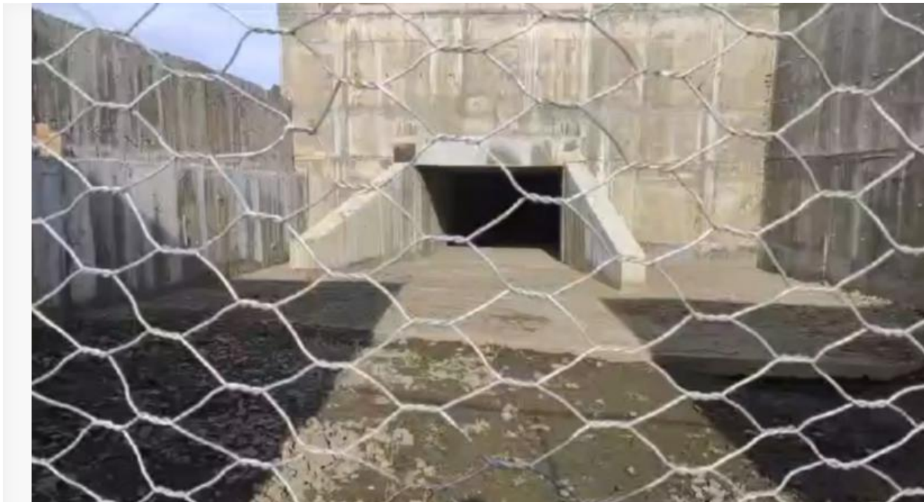
Река планам мэрии подчиняться не стала