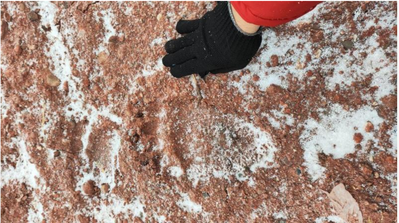
Жители обнаружили след медведя на улице Калинина

Пятый день неуловимые медведи бродят по городу. Жители недоумевают, почему специализированные службы не могут их поймать. Будто бы никто не знает, как отловить хищного зверя. Животные попадают в объективы камер, их видят из окон машин, но к приезду спецслужб медведи странным образом исчезают.