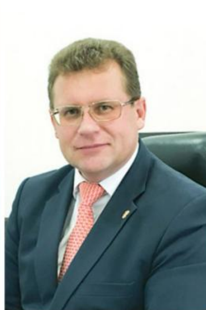
Фото: администрации Убинского и Колыванского районов; ksonline.ru; ИД «Советская Сибирь»

Автор: Лев Блиссов © Babr24.com ПОЛИТИКА, СКАНДАЛЫ, НОВОСИБИРСК 👁 22575 24.10.2023, 17:44 👍 420