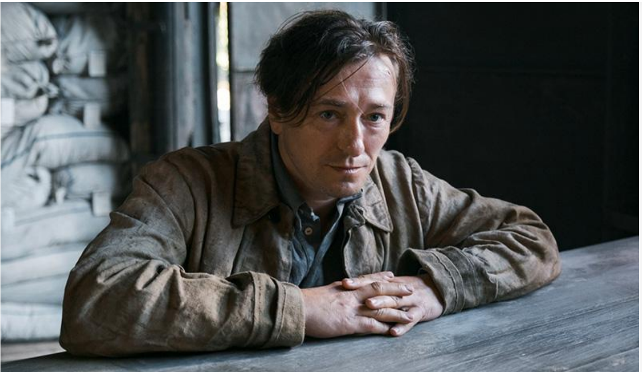
Сергей Трофимов в фильме «Учёности плоды», 2021 год