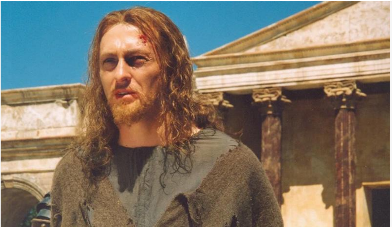
Иешуа в фильме «Мастер и Маргарита», 2005 год