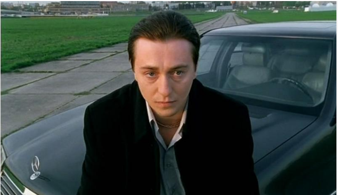
Саша Белый в фильме «Бригада», 2002 год