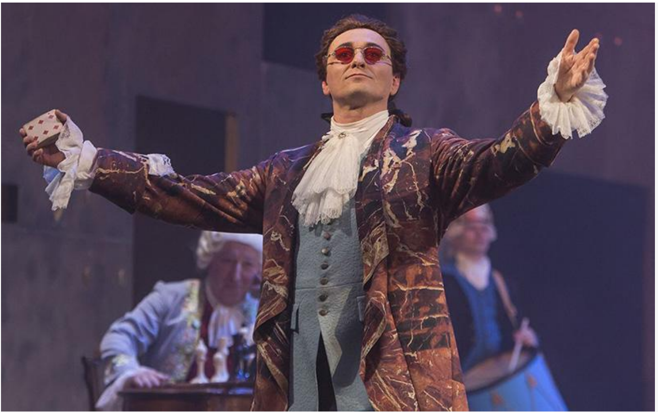
Казанова в спектакле «Казанова. Ars Vivendi». Губернский театр, постановка 2021 года

В кино Сергей Безруков начал активно сниматься сразу после окончания училища. Первая же его главная роль – Чибиса в криминальной мелодраме Каринэ Фолиянц «Ноктюрн для барабана и мотоцикла» – была отмечена призом «За актёрское обаяние и непосредственность» международного фестиваля «Созвездие».