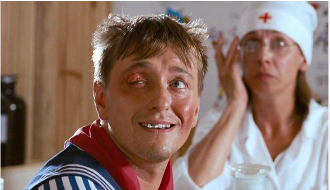
Виктор Сумароков («Сумрак») в фильме

Тратить время на описание активной общественной позиции юбиляра не будем: она не всегда последовательная, но «единственно верная», иначе вряд ли удалось бы к 50 годам достичь таких высот. Лучше вспомним знаковые кинороли одного из самых популярных актёров современной России. Их более 60, но мы бы выделили четыре: Саша Белый, Есенин, Иешуа и Годунов.