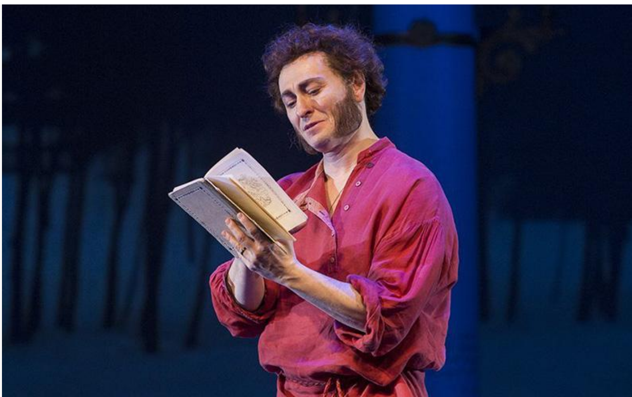
Александр Пушкин в спектакле «Пушкин». Губернский театр, постановка 2010 года