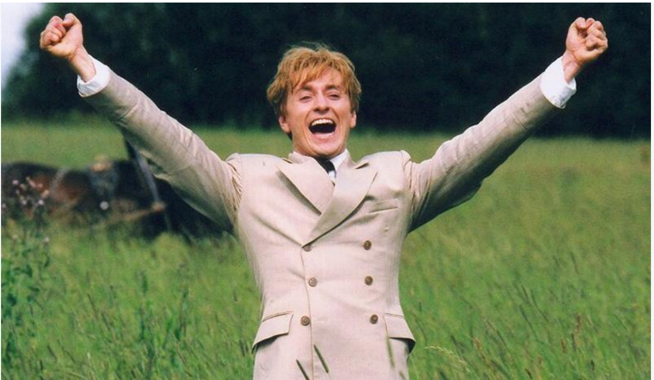
Сергей Есенин в фильме «Есенин», 2005 год