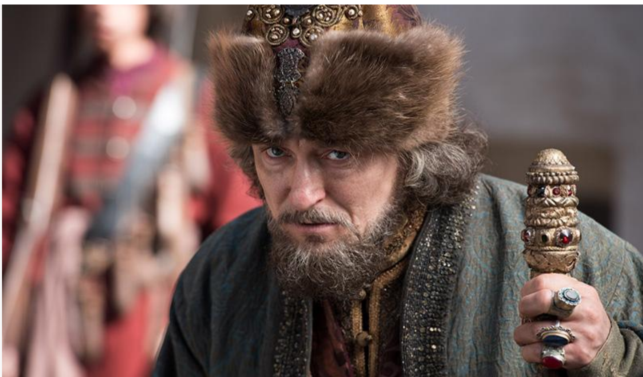
Борис Годунов в фильме «Годунов. Продолжение», 2019 год