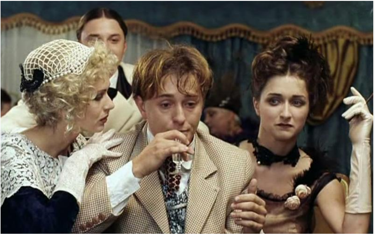
Коля Сидихин в фильме «Китайский сервизъ», 1999 год