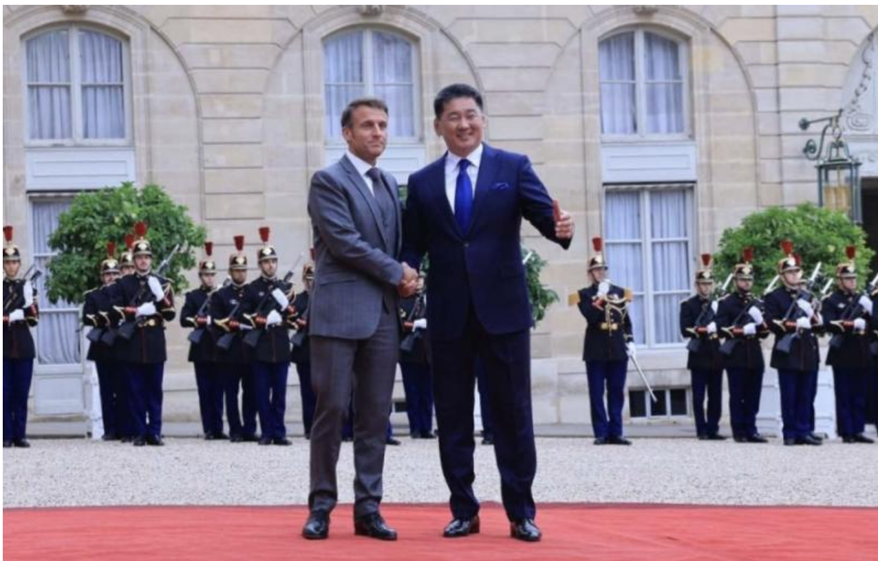
Фото: пресс-служба президента Монголии

Автор: Денис Большаков © Babr24.com ПОЛИТИКА, ЭКОНОМИКА И БИЗНЕС, МОНГОЛИЯ 👁 17478 17.10.2023, 17:10 📄 283