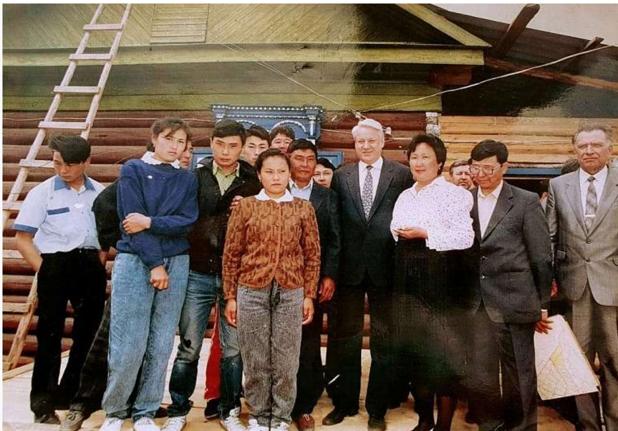
Борис Ельцин в Бурятии, 1992 год

В рейтинге РИА «Рейтинг» за 2022 год из 85 российских регионов по качеству жизни Бурятия оказалась на 81 позиции. По числу семей, которые относятся к среднему классу, Бурятия заняла 32 место (8,9% от общей численности населения). Иркутская область, где по версии РИА «Рейтинг» проживает 13,9% семей среднего класса, на 15 месте, а Забайкальский край с долей семей среднего класса в 9% занял 30 место по России.