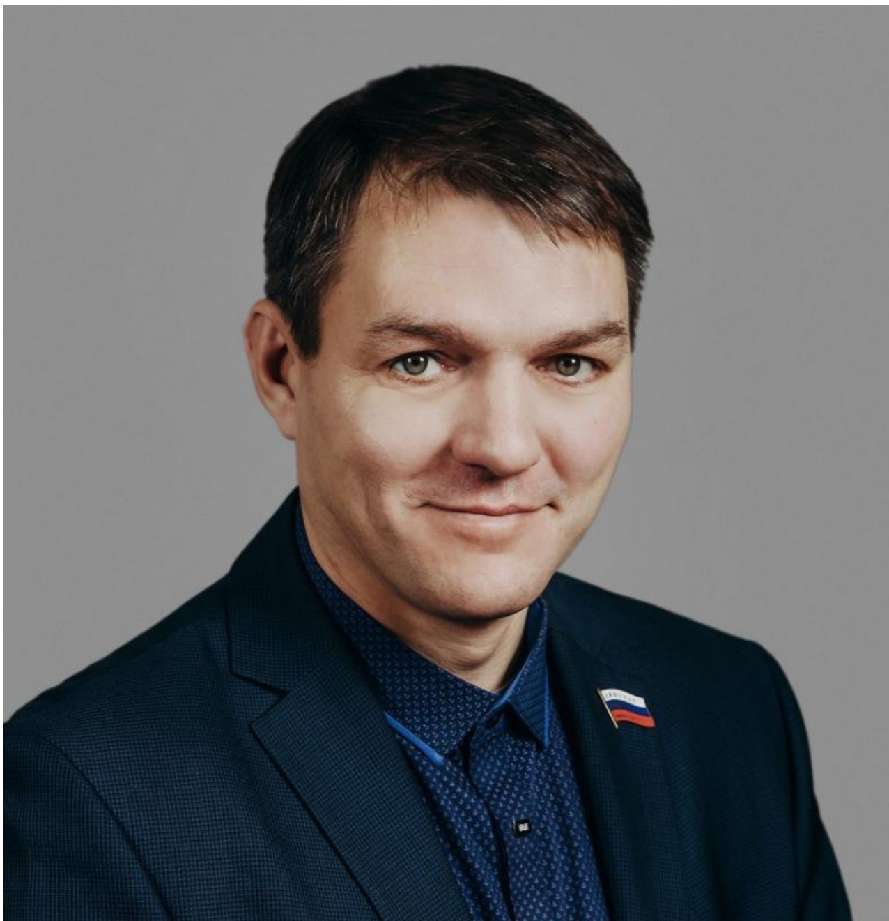
Фото с сайта думы Братска

Автор: Алина Саратова © Babr24.com ПРОИСШЕСТВИЯ, ИРКУТСК 👁 2589 11.10.2023, 12:49 🇱🇲 208 URL: https://babr24.com/?IDE=251983 Bytes: 1638 / 1413 Версия для печати Скачать PDF