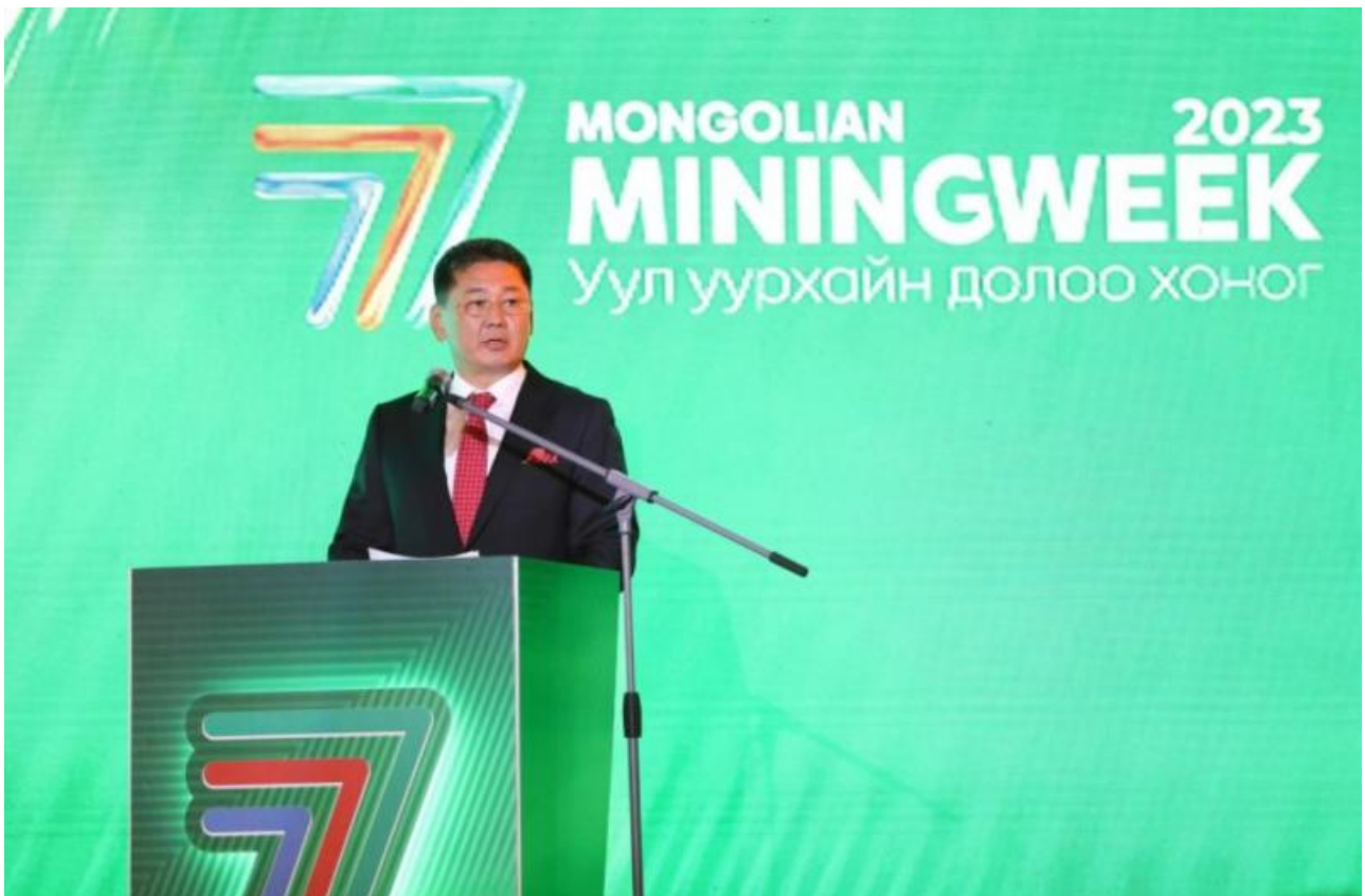
Фото: Монцамэ, пресс-служба президента Монголии

Автор: Денис Большаков © Babr24.com ПОЛИТИКА, ЭКОНОМИКА И БИЗНЕС, МОНГОЛИЯ 👁 17004 09.10.2023, 17:04 📄 248