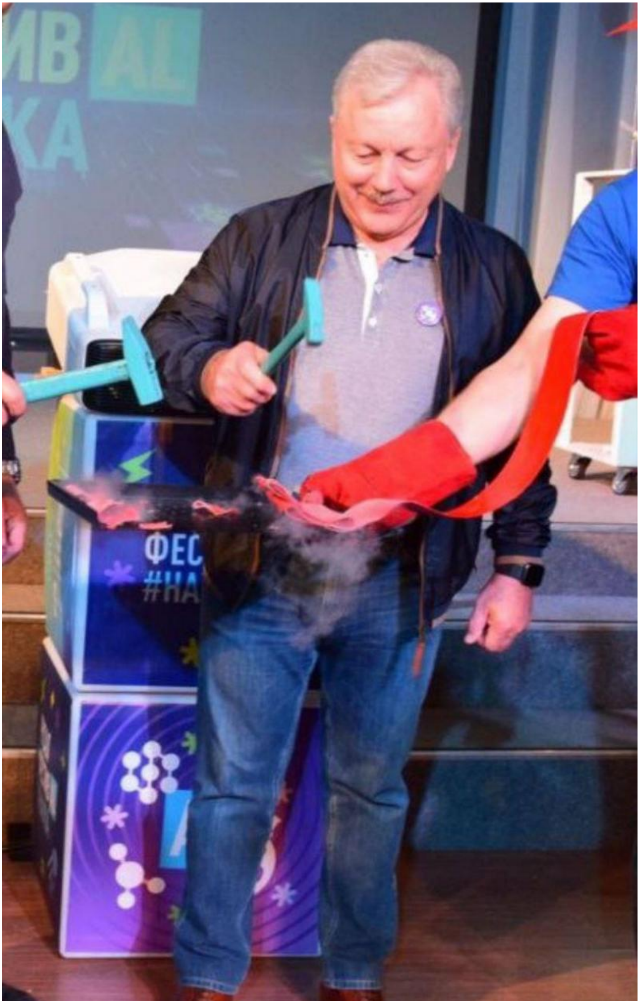
Кстати, означенным фестивалем «Илим» не удовлетворится.