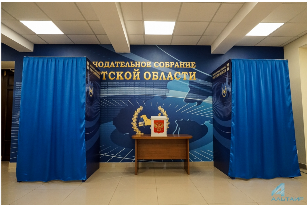
Фото из альбома "Иркутск. Государственные учреждения" © Фотобанк "RuBabr"

Автор: Алина Саратова © Babr24.com ПОЛИТИКА, ИРКУТСК 👁 12497 18.09.2023, 15:03 📌 163 URL: https://babr24.com/?IDE=251011 Bytes: 2144 / 1876 Версия для печати Скачать PDF