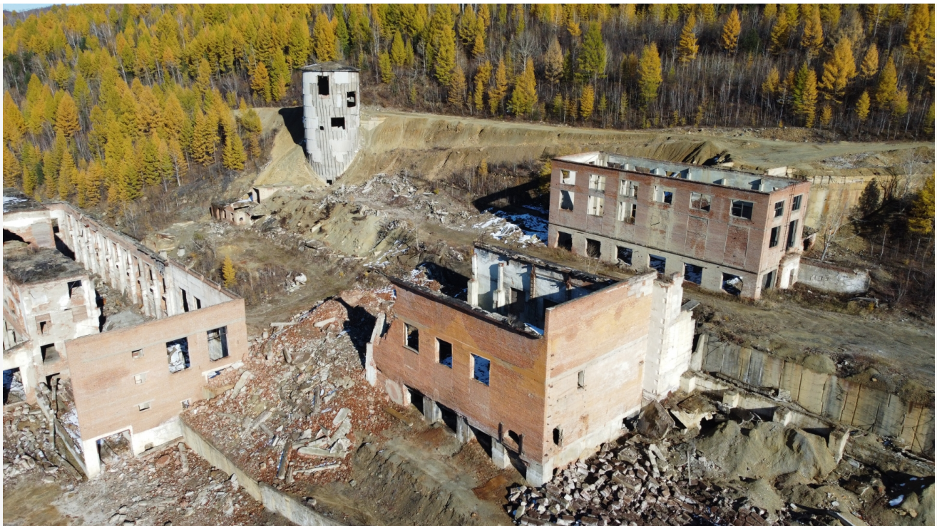
Автор: Аксель Дронов Фото из альбома "Бурятия. Джидинский вольфрамо- молибденовый комбинат" © Фотобанк «RuBabr»

В предыдущем материале Бабр подробно рассказывал о провальной рекультивации отходов ДВМК. Последними, кто принялся за эти работы, стала фирма ЗАО «Закаменск» (ОГРН: 1090327010091) – дочерняя компания «Акрополя» (ОГРН: 5067746109987). Однако спустя многолетнее выкачивание федеральных средств ситуация в городе не изменилась. Помимо красивых обещаний компания так и не смогла порадовать положительными результатами. А отходы комбината продолжили распространяться по округе.