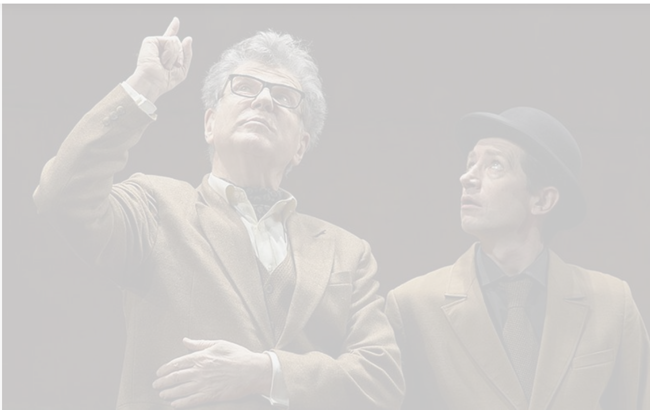
Князь Дулебов в спектакле «Таланты и поклонники». Театр Маяковского, постановка 2012 года

С треском провалившись в Школе-студии МХАТ, несостоявшийся инженер, тогда ещё не осознавая, что всё к лучшему, был принят на курс Андрея Гончарова в Государственный институт театрального искусства. В 1973 году выпускник ГИТИСа пополнил труппу Театра имени В. Маяковского, которым руководил его мастер курса и сцене которого он служит уже 50 лет.