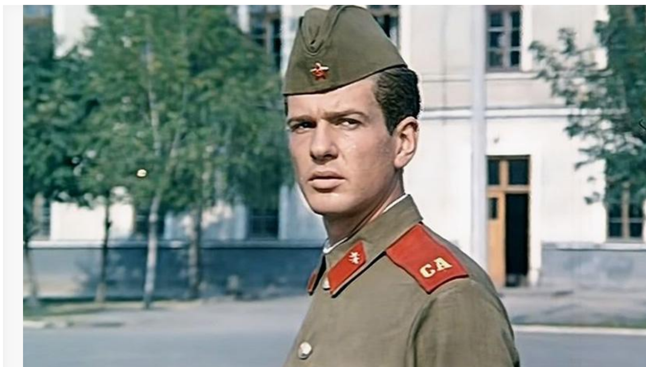
Алик Полухин в фильме «Весенний