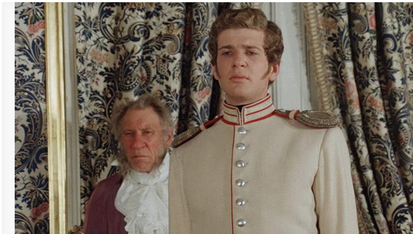
Иван Анненков в фильме «Звезда пленительного счастья», 1975 год