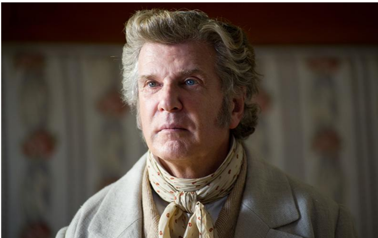
Степан Трофимович Верховенский в фильме «Бесы», 2014 год

В 2017 году Игорь Костолевский сменил ушедшего из жизни Георгия Тараторкина на посту президента Национальной театральной премии «Золотая маска». Должность «свадебно-генеральская», ни на что не влияющая, но красивая.