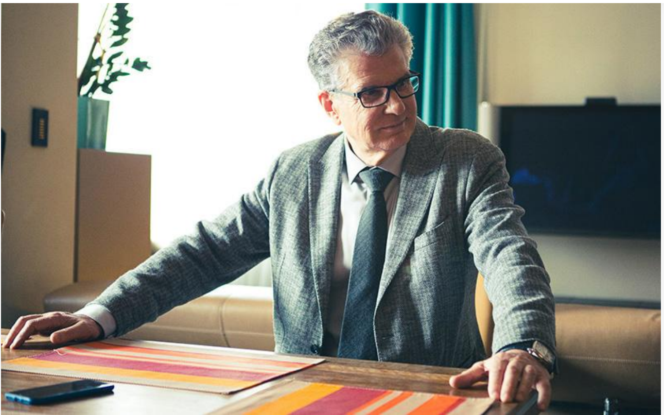
Александр Волков в фильме «Серебряный волк», 2022 год