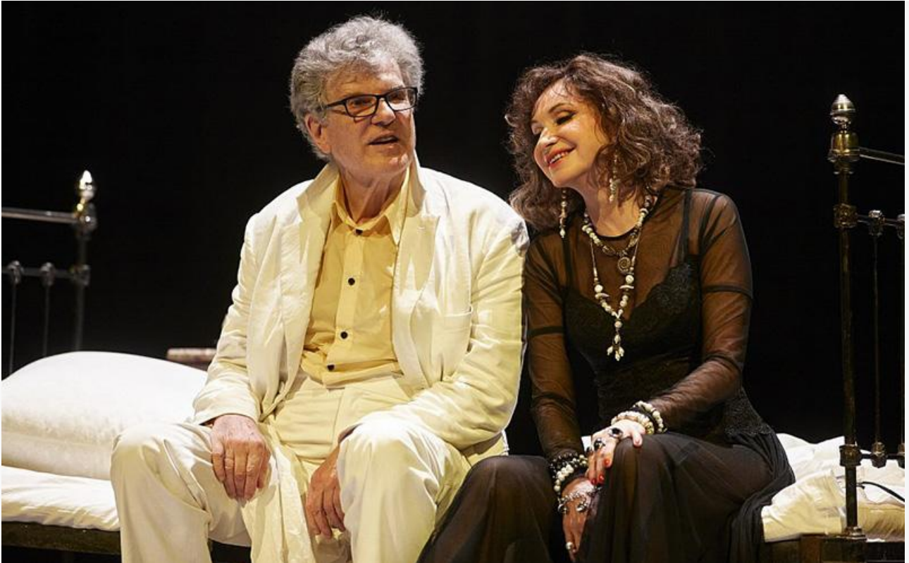
Габито в спектакле «Любовь по Маркесу». Театр Маяковского, постановка 2023 года

В кино, принесшем ему всесоюзную славу и миллионы поклонниц, Игорь Костолевский дебютировал