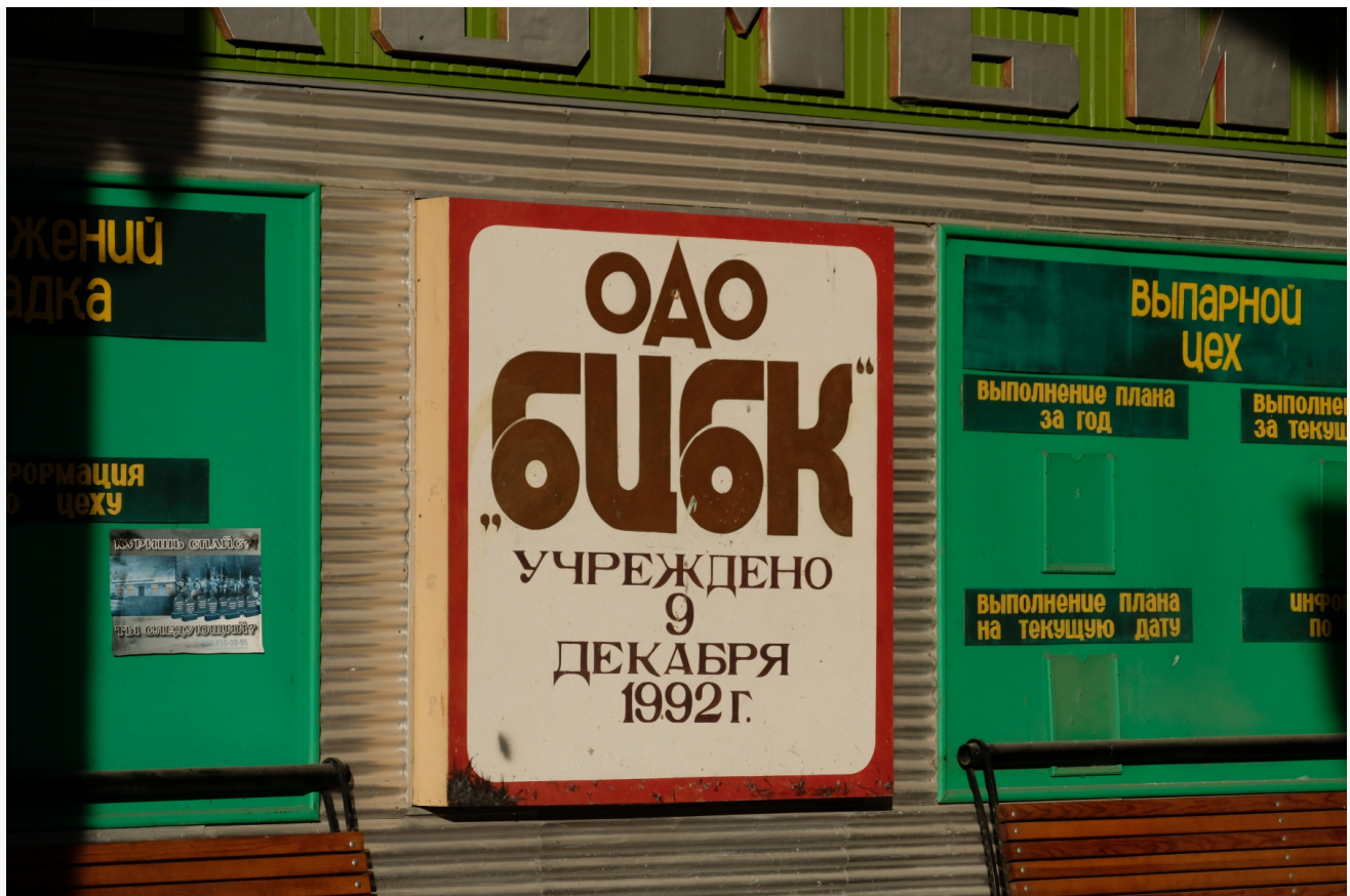
Автор: Алёна Штерн Фото из альбома "Иркутская область. Байкальск. БЦБК" © Фотобанк "RuBabr"

Через 10 лет все оказалось на точке старта. За прошедшие годы не было достигнуто никаких результатов в утилизации отходов. Трое подрядчиков были заменены, но это не принесло никаких положительных изменений. Более того, значительные средства были потрачены на различные этапы проекта, включая 131 миллион рублей на проект «ВЭБ Инжиниринг» и 421 миллион рублей, полученных «Росатомом» на двухгодичный период безделья.