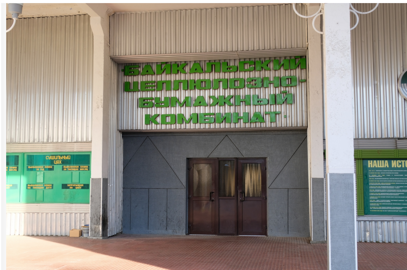
Автор: Алёна Штерн Фото из альбома "Иркутская область. Байкальск. БЦБК" © Фотобанк "RuBabr"

Сколько лет понадобилось экспертам, чтобы прийти к такому выводу. Наконец-то сообразили, что надо хотя бы определиться с объемом лабораторно-аналитических исследований. А мы уж не надеялись.